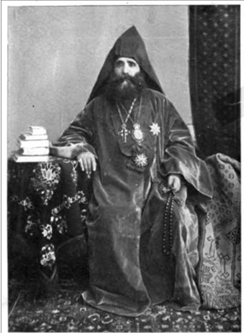
Patriarch of Constantinople. The ecclesiastical head of the Armenians is the Catholicos residing at Etchmiadzine, in the Caucasus. Of the same rank are the Catholicos of Aghtamar (near Van) and the Catholicos of Sis, in Cilicia. Next come the Patriarchs of Constantinople and Jerusalem, the former taking precedence as the civil head of the Armenians in Turkey.