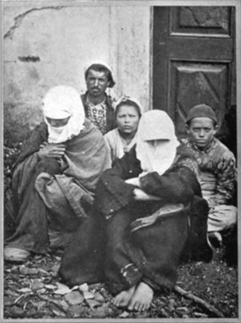
TURKISH PEASANT FAMILY , from the interior of Western Asia Minor. The family consists of the mother in the foreground, the son and his wife and their two children, son and daughter. An excellent illustration of the average Turkish peasantry of the somewhat better class, as found in the villages of Asia Minor.