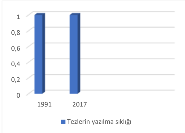
Grafik 6. Milliyeti Hareket Partisi tezlerinin yazılma sıklıĐı

man BlkbaŐı'dır. Cumhuriyeti Millet Partisinin, Kyl Partisi ile birleŐmesiyle 16 Ekim 1958'de Cumhuriyeti Kyl Millet Partisi (CKMP) Őeklini almıŐtır. 1 AĐustos 1965'de byk kongrede Alpaslan TrkeŐ CKMP'nin genel baŐkanlıĐına seilmiŐtir. CKMP, 8-9 Őubat 1969'da Adana kongresinde ismini Milliyeti Hareket Partisi olarak deĐiŐtirmiŐtir. 1981'de darbe ile diĐer siyasi partilerle birlikte kapatılmıŐtır (Fidan, 2010, s. 160). MHP, 1983'de siyasi parti yasakları kalktıktan farklı isimlerle siyasi hayata baŐlasa da 1992'deki kongrede tekrar Milliyeti Hareket Partisi ismini alarak siyasi hayatına devam etmiŐtir. MHP, farklı oluŐumlar erevesinde 1950'li yıllardan gnmze kadar varlıĐını devam ettiren nemli kitle partileri iinde yer almaktadır.