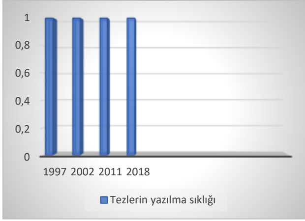
Grafik 11. Koalisyon hkmetleriyle ilgili yazılan doktora tez sayıları.

1997-2018 tarihleri arasında koalisyon hkmetleri ve ok partili hkmetler sorunsalı odaklı 4 tane doktora tezi yazılmıştır. Doktora tezlerinde de farklı dnemlerde Trkiye’de kurulan koalisyon dnemleri kaleme alınmıştır. Bunlar 61-80 yılları arası kurulan koalisyon hkmetleri, 1961 Anayasası ve İnn hkmeti koalisyonları, 1991-2002 yılları arasındaki Demirel Hkmeti-iller Hkmeti-Yılmaz Hkmeti-Erbakan ve Ecevit Hkmeti dnemleri mercek altına alınmıştır. Aynı zamanda 1970-1980 dneminde Ecevit-Demirel Hkmetlerinin koalisyonunun siyasi algı ve propaganda alıřmaları da incelenmiştir (Akdağ, 2018).