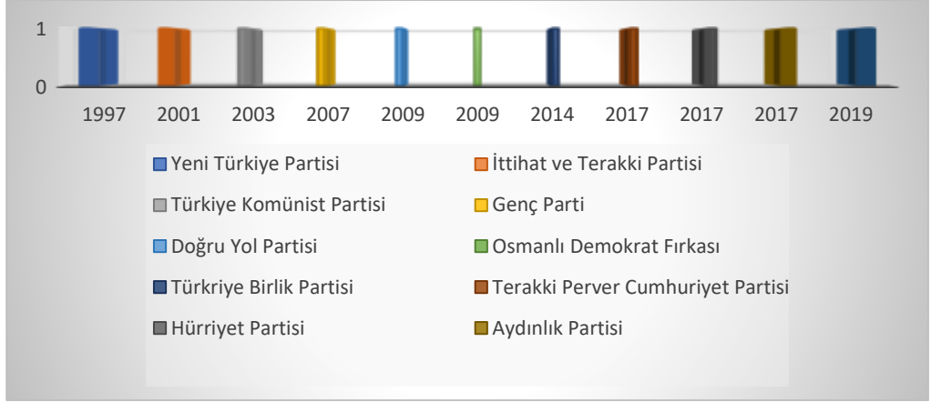
Grafik 10. Diğer partiler üstünde yazılan doktora tezlerinin yazılma sıklığı.

le partilerin ideolojik duruşu, tarihsel süreci, tabanıyla ilişkisi, kuruluşu ve faaliyetleri, partinin siyasi hayattaki konumu ve yeri ile hitap ettiği kitle ve lider arasındaki ilişki üstünde araştırmalar yapılmıştır.