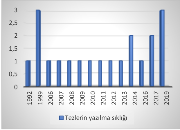
Grafik 5. Demokrat Parti tezlerinin yazılma sıklığı