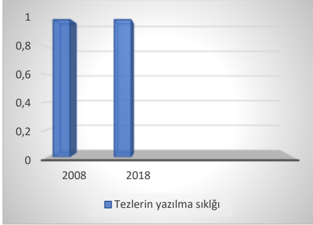
Grafik 3. Anavatan Partisi tezlerinin yazılma sıklığı.

miştir ne de onlara tabi olmuştur. Bu yüzden Anavatan Partisi her düşünceden ve eğilimden insana partisinin kapılarını açmıştır (Zariç, 2017, s. 55-57).