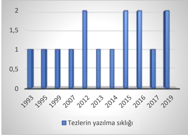
Grafik 4. Cumhuriyet Halk Partisi tezlerinin yazılma sıklığı

nemden Atatürk'ün vefatına kadarki süreç (1923-1938) CHP'nin "Ebedi Şef" dönemi olarak adlandırılırken, 26 Aralık 1938'de düzenlenen CHP üçüncü büyük kurultay ile İsmet İnönü "Milli Şef" olarak ilan edilir. 1939-1950 yılları da İsmet İnönü'nün hem cumhurbaşkanlığı hem de CHP'nin liderliğini yaptığı Milli Şef dönemi olarak anılır (Fidan, 2010, s. 3).