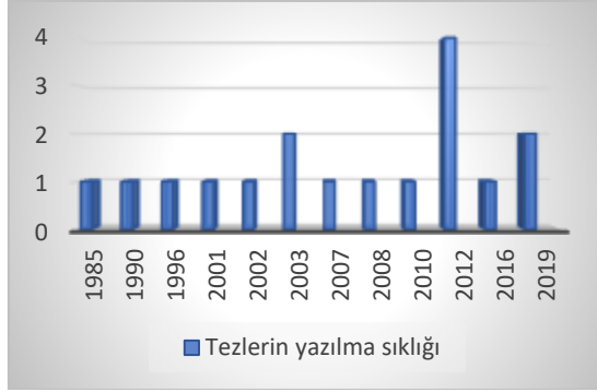
Grafik 8. Tek Parti ile ilgili tezlerin yazılma sıklığı

Tek parti dönemi Türki siyasi hayatında Türkiye Cumhuriyeti'nin ilk kurulduğu yıllardan itibaren 22 yıllık hatta Demokrat Partinin 1950'de seçimleri kazanmasıyla birlikte 27 yıllık önemli bir zaman dilimini kapsamaktadır. Tek parti odaklı 1984'den günümüze kadar toplamda 18 doktora tezi yazılmıştır. Tek partiyle ilgili doktora tezleri içerik olarak Tek Parti rejimi, gelişimi ve siyasi hayattaki yeri, yerel politikaları, azınlık siyaseti, iktidar ve muhalefet ilişkisi, toplumsal cinsiyet anlayışı, devletçilik politikalarının iş hayatındaki yansımaları, ekonomik hayatı canlandırma faaliyetleri, yasal-siyasi ve sosyolojik kökenleri, kullandığı semboller ile propagandası ve medyada temsil şekli üstünde durulmaktadır. Ancak tek parti döneminde çalışılan tezler genel itibariyle değerlendirildiğinde ağırlıklı olarak erken Cumhuriyet döneminde benimsenen devlet politikaları, kalkındırma faaliyetleri ve Türk siyasi hayatındaki konumu üstünde çalışıldığı gözlemlenmektedir.