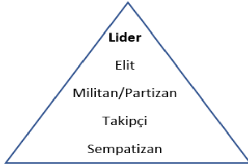
Őekil. Siyasi Parti Piramiti