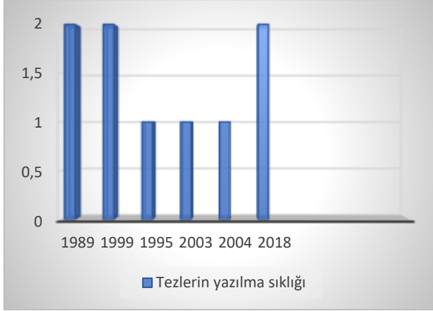
Grafik 9. Çok partili siyasi hayatla ilgili tezlerin yazılma sıklığı.

seimlerde Demokrat Parti oyların %53,3'n kazanarak mecliste %84,4'lk temsil oranı ile iktidar partisi olmuŐtur.