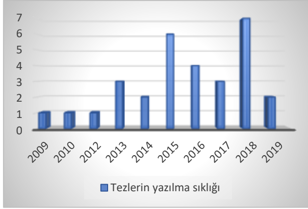
Grafik 2. Ak Parti tezlerinin yazılma sıklığı

Ak Parti 2001’de kurulmasına rağmen siyasi partiler hakkında yazılan tezler bazında (30 tez) üstünde en çok çalışılan doktora tezi konusu olmuştur. Ak Parti ile ilgili ilk doktora tezi 2009’da kaleme alınmış, 2018’de ise 7 tez ile yıl bazında en çok çalışılan siyasi parti odaklı tez konusu haline gelmiştir.