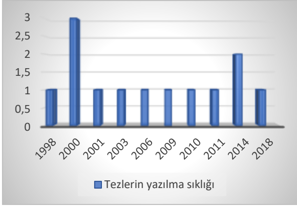
Grafik 12. Genel siyasi parti konularında çalışılan doktora tezlerinin yazılma sıklığı.

Doktora tezlerinde çalışılan konular Türkiye'nin içinde bulunduğu siyasi bağlam ile paralellik arz etmektedir. Çünkü Millî Görüş hareketi içinde yer alan Refah Partisinin 1998'de ve Fazilet Partisinin de 2001'de kapatılması üzerine aynı zaman aralığında bu konuyla ilgili 3 tane doktora tezi çalışılmıştır. Genel siyasi parti çalışmalarında odaklanılan önemli bir diğer konu da partilerin ideolojik duruşları ve kutuplaşma olgusudur. Sağ ve sol merkezli partilerin yükselişi, ideolojik yapısı, dinamikleri ve siyaset anlayışları hakkında araştırma yapılmıştır. Bu konuların dışında Türkiye'de siyasi parti kimliği, hesap işleri, parti sistemi üstünde çalışılmıştır.