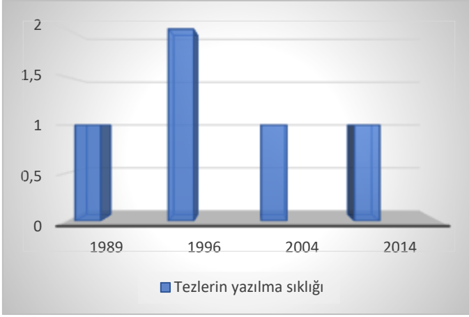
Grafik 1. Adalet Partisi doktora tezlerinin yazılma sıklığı

1989 ve 2014 tarihleri arasında toplamda Adalet Partisi ile ilgili 6 doktora tezi çalışılmıştır. Sadece 1996'da Adalet Partisi üstünde iki tane tez araştırması yapılmıştır. Tezlerin konu içeriği incelendiğinde ise Adalet Partisinin ideolojik duruşu, kurucuları ve Türk siyasi hayatındaki yerinin incelendiği gözlemlenmiştir.