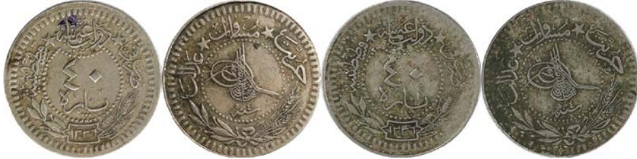
Sikke Nu.174:Ç.:24 mm, A.:6.0923 gr. Ni. S. Para. Sikke Nu.175:Ç.:24 mm, A.:6.003 gr. Ni. S. Para. Zeno:91360/Zeno:91360

٤٠ پاره دولت عثمانیه حریت مساوت عدالت ضرب فی قسطنطنیه محمد خان بن عبدالمجید المظفر دنما سنه ٤