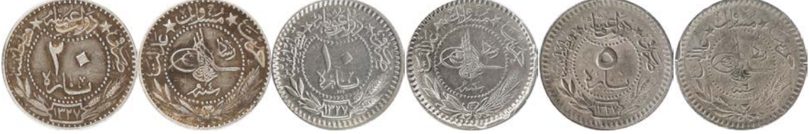
Sikke Nu.171:Ç.:21 mm, A.:4.008 gr. Ni. A. Para. Sikke Nu.172:Ç.:19 mm, A.:2.667 gr. Ni. A. Para. Sikke Nu.173:Ç.:15.5X16 mm, A.:1.723 gr. Ni. A. Para. Zeno:22731/Zeno:55380/Zeno:21484

٥ پاره دولت عثمانیه حریت مساوت عدالت ضرب فی قسطنطنیه محمد خان بن عبدالمجید المظفر دنما سنه ٦