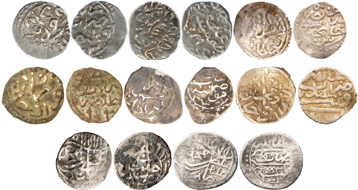
Sikke Nu.95:Ç.:11 mm, A.:0.263 gr. AR. Akçe. Sikke Nu.96:Ç.:11.5X10 mm, A.:0.338 gr. AR. Akçe. Sikke

۱۰۱ حلد ملکه ضرب خالب سنه ۱۰۰۳ ۱۰۲ حلد ملکه ضرب خالب سنه ۱۰۰۳