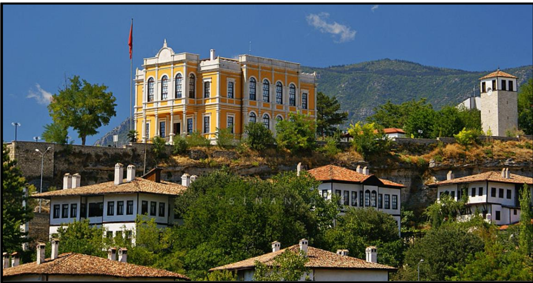
Fotoğraf 5: Çeşme Mahallesi (Kent Tarihi Müzesi ve Tarihi Saat Kulesi)