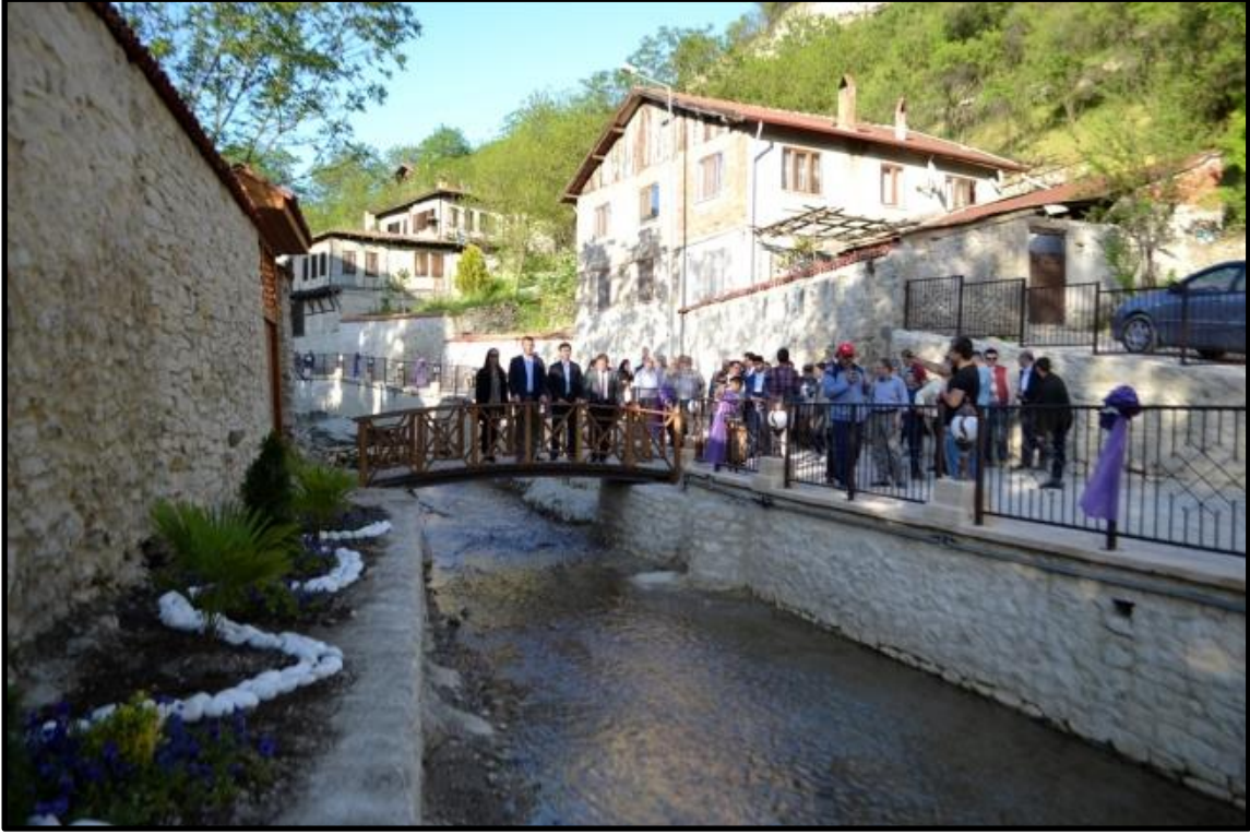
Fotoğraf 1: Akçasu Mahallesi (Mahalleye Adını Veren Akaçasu Deresi)