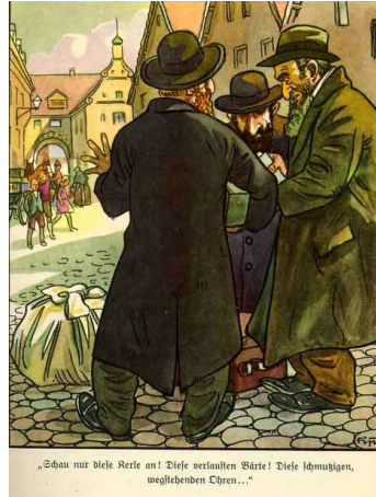
Resim 7. Altıncı Hikâyeye Ait Görsel

Nazizm ideolojisindeki ırksal ayırımı Yahudiler, Almanlara atfedilen saf ırkın dışında tutulmakta ve alt insan (Untermensch) olarak tabir edilmektedir (Bytwerk, 2005, s. 38). Naziler, Yahudilerin fiziksel olarak ari ırkın özelliklerini yansıtmadıklarını belirtmekte, diğer yandan yıkanmadıkları, pis oldukları, bu yüzden de hastalık taşıdıkları iddialarında bulunmaktadır. Anlambilimsel boyutta hikâyede Yahudilerin, ari ırk olarak atfedilen Almanlardan farklı oldukları vurgulanmaktadır. Hikâyede yer alan üç kişinin gerek yazılı gerekse görsel kodlardan Yahudi oldukları mesajı verilmektedir. Görselde Alman mimarisini yansıtan yapılar, Alman şehirlerinin, Alman yerel kıyafetlerini giyen insanlar ise Alman halkının metonimi olarak kullanılmaktadır. Görselde yer alan Yahudiler ise Almanya'da yaşayan Yahudileri temsil etmektedir.