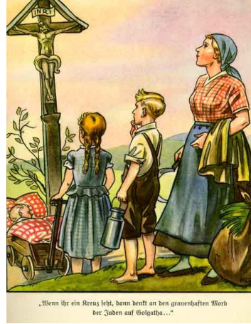
Resim 4. Üçüncü Hikâyeye Ait Görsel

Naziler, Yahudileri kötülüklerin kaynağı olarak nitelendirmekte ve Almanya'nın maruz kaldığı zor durumun sorumlusu olarak da Yahudileri ön plana çıkarmaktadır (Kaplan, 1999, s. 14). Anlambilimsel boyutta hikâyede de dinsel söylemler kullanılarak Yahudi karşıtı mesajların verilmeye çalışıldığı ortaya çıkmaktadır. Görselde Hıristiyanlık inancına göre Hz. İsa'nın çarmıha gerili temsili üzerinden Yahudilerin Hz. İsa'nın çarmıha gerilmesine neden olduğu mesajı verilmektedir. Çarmıhın çevresindeki Alman yerel kıyafetleri içerisindeki kişiler, Alman halkının metonimi olarak yer almaktadır.