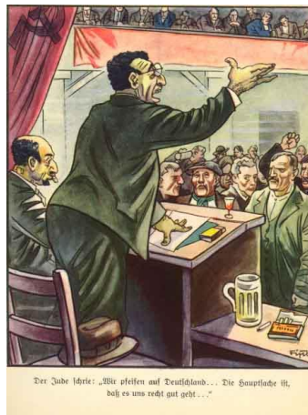
Resim 3. İkinci Hikâyeye Ait Görsel

NSDAP, Komünizm ideolojisine karşı propaganda gerçekleştirmektedir (Gülada, Gazi, & Çakı, 2019, s. 1088). Naziler, Almanya için büyük bir tehdit olarak nitelendirdikleri