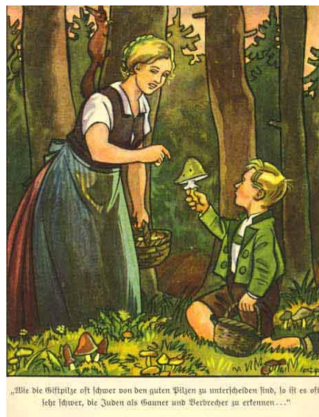
Resim 8. Yedinci Hikâyeye Ait Görsel

Yedinci hikâye "Zehirli Mantar" başlığını taşımaktadır. Sözdizimsel boyutta görselde ormanda Alman yerel kıyafetleri içerisinde bir anne kadın ve bir erkek çocuk resmedilmektedir. Görselde çevresinde mantarlar bulunan erkek çocuğun elindeki mantarı kadına uzattığı, elinde sepet bulunan kadının da işaret parmağıyla mantarı gösterdiği yansıtılmaktadır. Hikâyede yer alan görselin altında da "Zehirli mantarlardan yenilebilir bir mantarı ayırt etmek genellikle zor olduğu gibi, Yahudiye dolandırıcı ve suçlu olarak tanımak da çok zor..." yazısı bulunmaktadır. Gösterge olarak anne ve çocuk görsellerine odaklanılabilmektedir. Düz anlam boyutunda hikâyede ormanda mantar toplayan bir anne ve çocuğa yer verildiği görülmektedir.