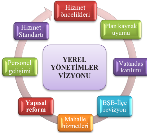
Şekil 7: Yerel Yönetimler Politika ve Tedbirler