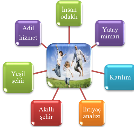
Şekil 3: Şehirleşme Politika ve Tedbirler

Söz konusu politikaların uygulanmasıyla 2023 yılına kadar, Medeniyetimizi yaşatan şehir beratı alan şehir sayısının 26; Özgün mahalle sertifikası alan yerleşim sayısının 81 olması hedeflenmektedir (11 KP 2019:174).