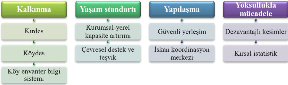
Şekil 6: Kırsal Kalkınma Politika ve Tedbirler