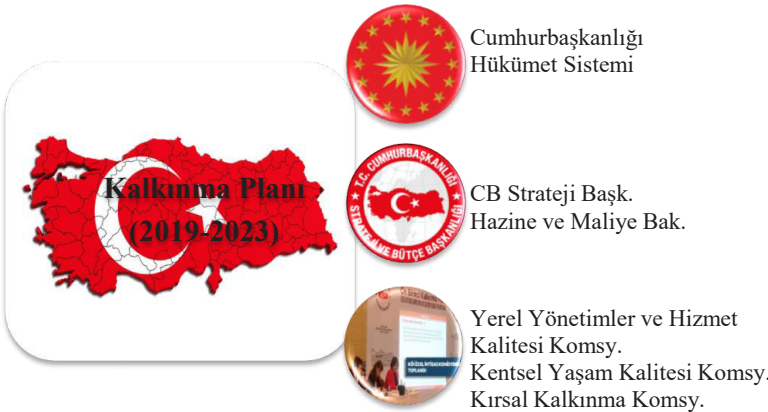
Şekil 1: Planın Künyesi Süreç ve Yönetmel İlişkiler

On Birinci Kalkınma Planı, kamu kurumları ile toplumun tüm kesimlerinin katkılarıyla katılımcı şekilde hazırlanmıştır. Plan hazırlıkları kapsamında 75 ihtisas komisyonu ve 32 çalışma grubu oluşturulmuştur. Türkiye’nin sektörel ve sosyo ekonomik kalkınma önceliklerine yönelik olarak düzenlenen toplantılarda kamu, özel ve sivil toplum kuruluş mensupları ile vatandaşların görüş ve önerileri alınmıştır (Şekil 1).