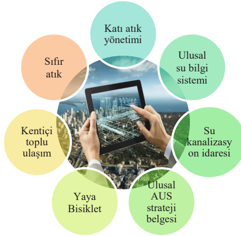
Şekil 5: Kentsel Altyapı Politika ve Tedbirler

Kaynak: (Yazar tarafından hazırlanmıştır)