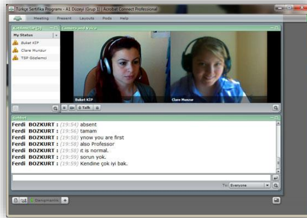
Resim 6. Randevulu Online Sözlü Sınav

Türkçe e-Sertifika Programları bünyesinde adayların dinleme ve konuşma becerilerini ölçmek amacıyla randevulu online sözlü sınavlar uygulanmıştır. Bu sözlü sınav türünün en önemli özelliği sınava katılan adayların ve sınav uygulayıcılarının uygun oldukları gün ve saatte randevu usulüyle sanal sınıf ortamında gerçekleştirilmiş olmasıdır. Randevu sürecinde öncelikle danışmanların sınav haftası süresince müsait olacakları saat dilimleri belirlenmiştir. Ardından online bir anket aracılığıyla öğrencilerin talepleri alınmıştır. Son olarak danışmanların zaman dilimlerine ve öğrencilerin taleplerine göre her bir öğrenci için sınav tarihi belirlenmiştir. Bu şekilde, bir dönemde, 5 Türkçe dil uzmanı ve dünyanın farklı yerlerinde yaşayan ortalama 400 kişilik öğrenci grubuna bir hafta süre boyunca online sözlü sınav uygulanabilmiştir. Randevulu online sözlü sınavlar, bir sanal sınıf ortamında kamera ve mikrofon eşliğinde, danışman ile öğrencinin katılımıyla gerçekleştirilmiştir.