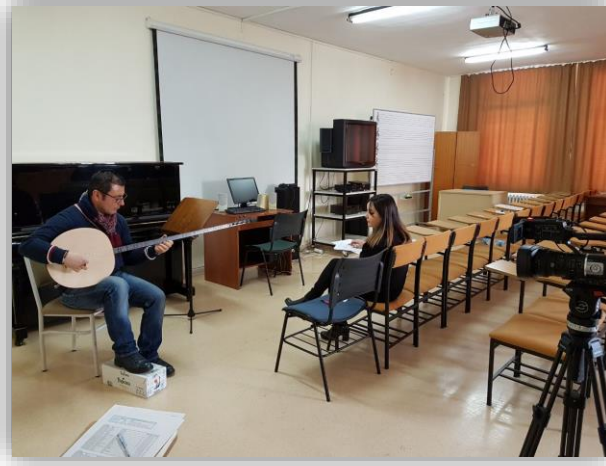
Resim 3. Uygulamalı Çalgı Sınavı

Uygulamalı çalgı sınavında adaylar sınav esnasında kendilerine verilen çalgıya aşina olmadıkları gerekçesiyle sınav kaygısı yaşamaktadır. Bu soruna çözüm olması amacıyla adayların kendi çalgıları ile sınava katılmalarına izin verilmiştir.