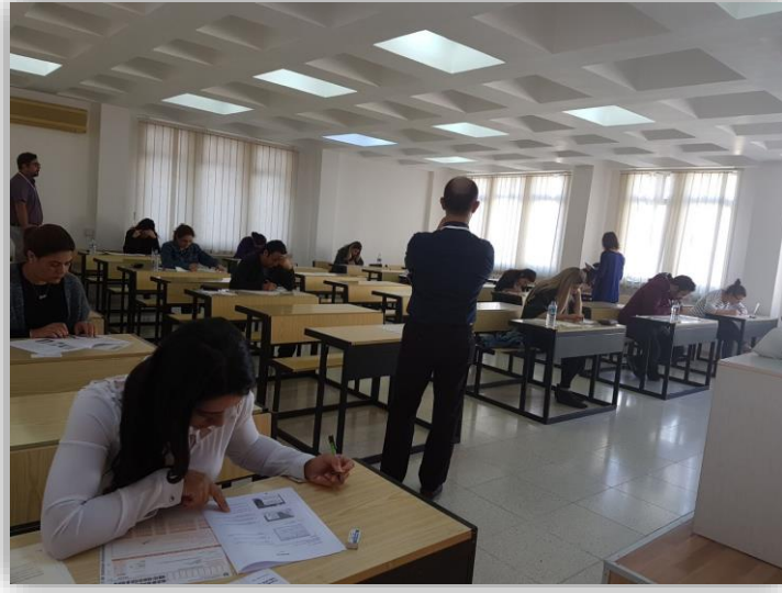
Resim 4. Okuma-Yazma Sınavı

Okuma-yazma sınavında, adaylara yazılı metin verilerek metne dayalı soruları yanıtlamaları beklenmektedir. İşaretler, broşürler, gazeteler ve dergiler gibi basit yazılı bilgileri anlama becerilerinin ölçüldüğü okuma-yazma sınavında 1 saat 10 dakika süreyle 56 soru sorulmaktadır.