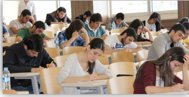
Resim 1. Gözetimli Kağıt Sınavı

Gözetimli kâğıt sınavının en büyük dezavantajı sınavı yapan kurum açısından maliyetinin yüksek olmasıdır. Ancak gözetimli olması özelliğiyle kamu kurumlarıyla yapılan işbirliği çalışmalarında daha güvenilir olması nedeniyle en fazla tercih edilen sınav türü olduğu söylenebilir. Gözetimli kâğıt sınavında ortaya çıkan yüksek maliyet yükünü azaltmak amacıyla gözetimli online sınav modeli geliştirilmiştir.