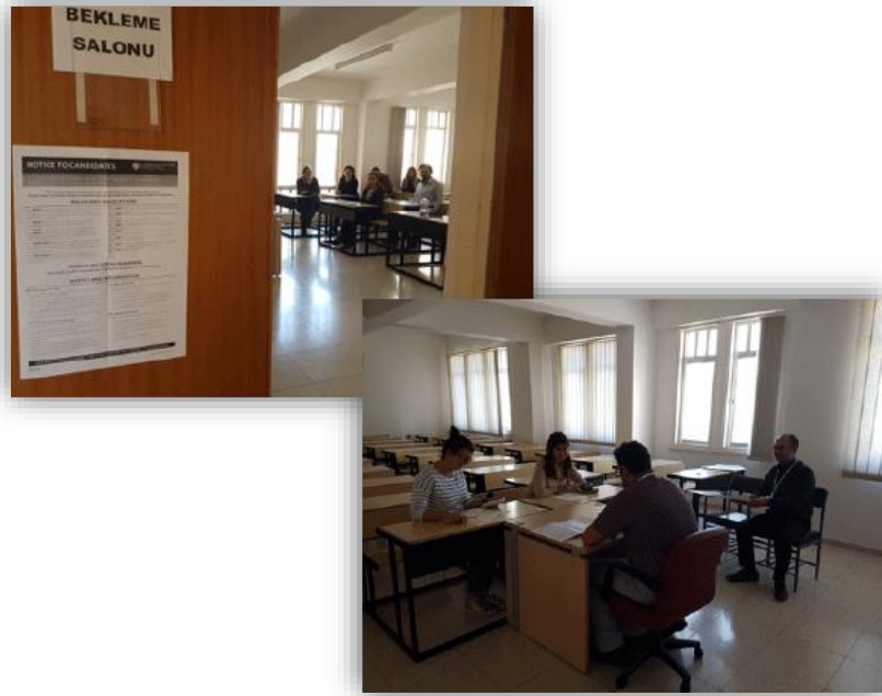
Resim 5. Konuşma Sınavı

Sınavın son aşaması olan konuşma sınavı ikili aday çiftleri şeklinde yapılmaktadır. Adaylar ikişerli eşleştirilerek çiftler oluşturulmaktadır ve sınavdan önce kendilerine hangi saatte konuşma sınavına katılacakları bildirilmektedir. Aday çiftleri sınav öncesinde hazırlanan boş bir salonda toplanmakta, yol gösterici görevli tarafından çiftler halinde sınavın yapılacağı salona götürülmektedir. Adaylar sınav salonunda yer alan iki sınav uygulayıcısının gözetiminde karşılıklı diyalog kurulması yoluyla sınava alınmaktadır. Sınavı tamamlayan aday çifti yine yol gösterici görevli eşliğinde salonda bekleyen diğer adaylarla görüşülmeden sınavın yapıldığı binadan çıkarılmaktadır. Konuşma sınavında 10 dakika süreyle adayların basit sorulara yanıt vererek ve sorular sorarak bir diyalogda yer alma becerileri ölçülmektedir. Bugüne kadar 2013 yılından bu yana İngilizce e-Sertifika Programlarına kayıtlı 4.593 kişi okuma-yazma, dinleme, konuşma sınavlarına katılmıştır.