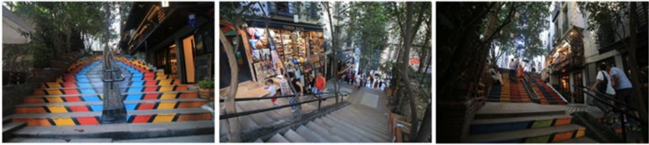
Resim 5. Hacı Ali Sokağı genel görünüm, Temmuz 2019 (Gül Yücel Arşivi)

Basamakların bitiminde yokuşla devam eden Hacı Ali Sokağı konfor ve ulaşılabilirlik parametreleri altında fiziksel olarak incelendiğinde iki bölümden oluşmakta olduğu görülmektedir (Tablo 3). Geniş basamak yapısı ve görece alçak rıht özelliği taşımaktadır. Her iki yanda bina ile sınırlı merdivenli sokağın genişliği ise derin gölge oluşturacak biçimdedir. Arada sahanlık bulunan merdivenli sokağın sadece ikinci bölümünde korkuluk yer bulmaktadır (Resim 5). Merdivenli sokak basamakları yenilenmiş durumda ve rıhtları farklı renklerde desen oluşturacak şekilde boyanmıştır. (Resim 5).