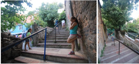
Resim 11. Merdivenlerde oyun – sosyal paylaşım, Merdivenli Mektep Sokak, Temmuz 2019

Bazı yeme-içme mekânlarının sahanlıklara taşıdığı/açıldığı merdivenlerde, çocukların korkuluk gibi merdiven bileşenleri ile ya da sahanlığın üzerinde oyun oynadıkları görülmektedir. Çocukların merdivenli sokağı oyunlarına katıp, kurallar geliştirip oyunun bir parçası haline getirmesi durumu, tam da o semtin çocuklarının dünyasında merdivenleri sokakların sosyal mekân olarak kullanılmasına bir örnek niteliğindedir (Resim 11). Bu eylemlerin tümü kullanıcıların, kentlinin merdivenle etkileşimine açık bir örnektir.