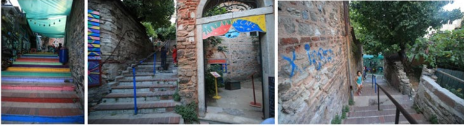
Resim 7. Merdivenli Mektep Sokağı genel görünümü, Temmuz 2019

Sokağın alt kotunda ziyaretçilerin yoğun olarak bulunduğu meydan bulunmaktadır. Sokak üzerinde kültür ve eğlence mekânları bulunmakta, çok yoğun olarak kullanılan merdivenli sokak çoğunlukla ziyaret, ulaşım ve kamusal amaçlı kullanılmaktadır.