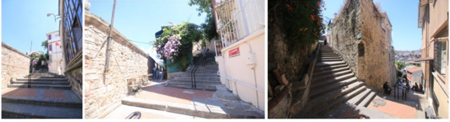
Resim 6. Yeni Dünya Sokağı genel görünüm, Temmuz 2019

Yeni Dünya Sokağı'nda peyzaj, manzara, tarihi bina varlığı ön plana çıkan unsurlardır. Başlangıcını Üsküdar meydanının devamı niteliğinde, Mihrimah Sultan Cami yanından çıkan sokağı sınırlayan bina cephelerinden birinde temsili bir konu resmedilmiştir (Resim 9). Evcil Hayvan varlığı da gözlemlenen sokak üzerinde kedi evleri ve mama, su kabı gibi ihtiyaçları için de malzemelerin olduğu tespit edilmiştir. Konut, ticaret, kültür ve eğitim işlevlerine hizmet eden yapıların bulunduğu sokağın kullanımının yoğun olduğu ve konut, ziyaret, ulaşım ve kamusal alanları kullanım amacıyla ziyaret edildiği gözlemlenmektedir. Merdivenin bağladığı sokaklar arasındaki güzergahı boyunca doğal yeşil alanların varlığı, mevsimine göre çiçeklerinin renkleri ve bakımlı durumdaki tarihi yapılarının bir arada fotoğraf çekmek için cazibe noktası durumundadır. Sosyal medya (Instagram) araştırmasına göre Yeni Dünya Sokak etiketiyle gönderilerde bulunduğu görülmektedir. Paylaşılan fotoğraflarda ağırlıklı eski yapılar ve merdiven ilişkisi ile yeşil dokunun merdiven ile ilişkisine yer verildiği görülmüştür.