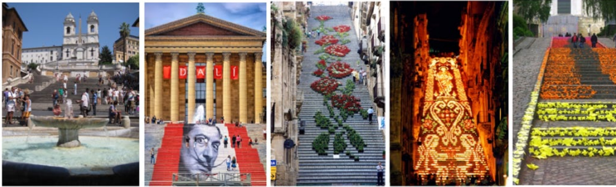
Resim 1. a. Roma-İspanyol merdivenleri, b. Philadelphia-ABD-Dali Müzesi merdivenleri, c. ve d. Sicilya-İtalya-Caltagirone merdivenleri, e. Fransa-Angers merdivenleri

İspanyol Merdivenleri 1723-1726 yılları arasında Roma'da inşa edilmiştir. İsmi, İspanyol toprağı olarak kabul edilen İspanyol Büyükelçi-