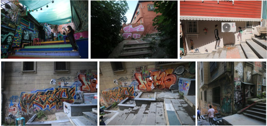
Resim 9. Sırasıyla; (1,2,3)Hacı Ali Sokak, (4,5)Merdivenli Mektep Sokak, (6)Yeni Dünya Sokak, Temmuz 2019

Graffiti diye adlandırılan duvar resimlerin varlığı da bir çeşit resim sanatının farklı yollarla kendini var ettiğini, mesaj ve protest bir tavırla duvarlarda insanlara sunulmak üzere merdivenli sokağın sosyal mekân olarak kullanıldığını göstermektedir. Son yıllarda "mural" (renkli duvar resimlerine verilen isim) uygulamalarının uluslararası düzeyde festivallerle İstanbul'da yer bulduğunu söylemek mümkündür. 6 Duvar resimlerinin, graffitilerin semtlere göre değişik şekillerde yansıtıldığı ve daha çok Be-yoğlu semtinde yoğunlaştığı söylenebilir (Resim 9).