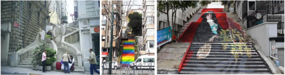
Resim 3. Sırasıyla (1,2,3); Kamondo merdivenleri, Salı Pazarı Sokağı, Enli Sokağı

İstanbul'da Kamondo Merdivenleri (Galata), Salı Pazarı Sokağı (Fındıklı), Enli Sokağı (Beyoğlu) gibi örnekler de sosyal katılıma teşvik eden, kentliyi kent ile etkileşime sokan örnekler olarak gösterilebilir (Resim 3). 2020 yılının yaz aylarının sonlarında Kılıç Ali Paşa Mahallesi'ndeki Enli Yokuşu merdivenlerine Mimar Sinan Üniversitesi öğrencileri ve eski mezunları, Osman Hamdi Bey'in 'Mimozalı Kadın' eserini resmetmiştir. Beyoğlu Belediye Başkanı sanatı sosyal mekânlara, merdivenli sokaklara taşımada kamunun da desteğini verdiğini belirterek, başka örnek uygulamalar için çalışmalar yürüttüklerini belirtmiştir.