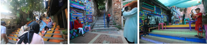
Resim 10. Merdivenlerde Özçekimler (1)Hacı Ali Sokak, (2,3) Merdivenli Mektep Sokak, Temmuz 2019

özel bir sanatsal çalışmanın ya da doğa güzelliklerinin olduğu bölgede fotoğraf çekimleri sırasında merdivenlerde sıkışma, sıra bekleme olduğu görülmüştür.