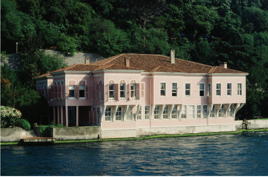
Ek 4: Kuzguncuk'ta Ahmed Fethi Paşa Yalısı