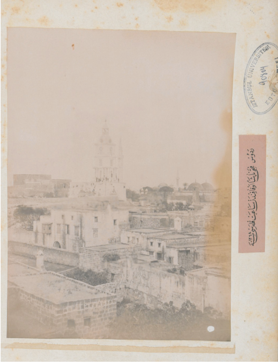
Ek 3: Ahmed Fethi Paşa Evkâfından Saat Kulesi (Rodos)