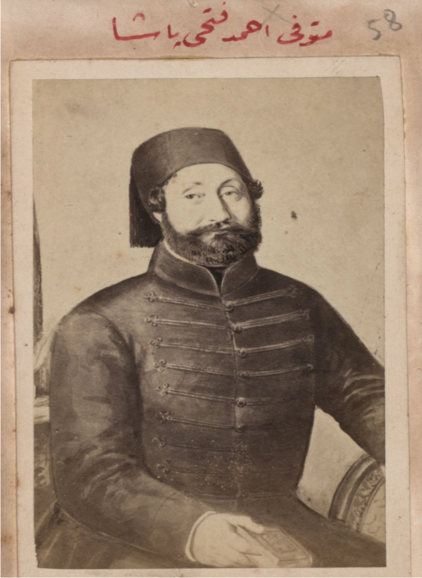
Ek 1: Damat Ahmed Fethi Paşa