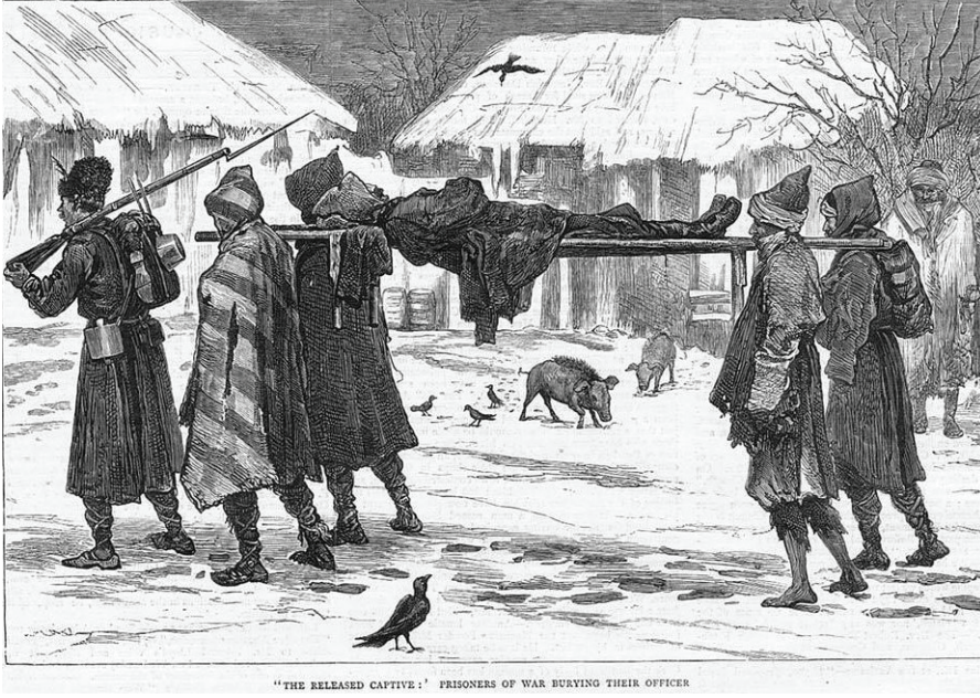
Ek 2: “Serbest Tutsak”: Komutanlarını Defneden Savaş Esirleri. 106