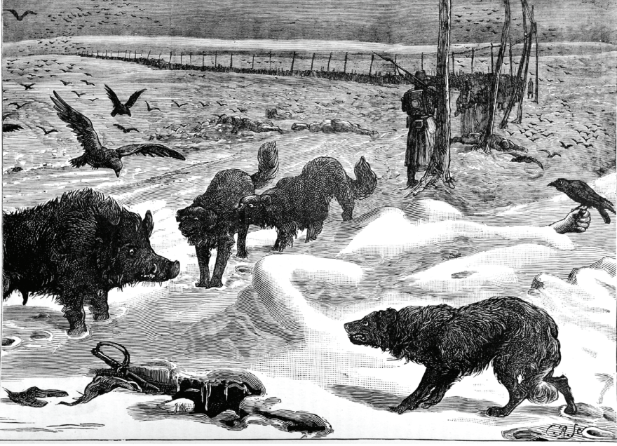
TURKISH PRISONERS FROM PLEVNA EN ROUTE TO RUSSIA.