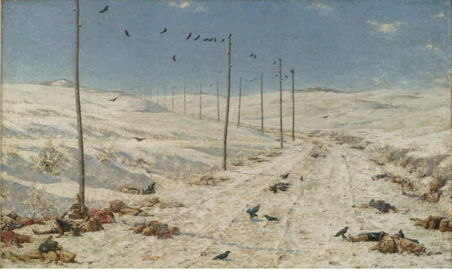
Resim 1: Vasily Vereshchagin (Rus, 1842-1904)'in esir konvoyunun bu yürüyüşünden esinlenerek çizdiği The Road of the War Prisoners (Savaş Esirlerinin Yolu 1878-1879) isimli tablosu.

Binlerce yırtıcı kuş kafilinin önüne ve arkasına üşüşerek sefil kafilayı acımasız bir şekilde tıpkı batmakta olan bir geminin etrafındaki köpekbalıkları gibi takip etmekteydi. Birkaç metre ileride, yarısı karla kaplı ve üzerindeki eskimiş elbiseleri, biraz daha sıcak kalabilme gayesiyle arkadaşları tarafından alınmış, başka bir Türk'ün çıplak bedeni uzanıyordu. Leşçil bir karga ölmüş bir esirin eline henüz konmuştu ve köpekler kurbanlarının etrafında dönüyorlardı. Birkaç adım ötede hızla yağın kar nedeniyle yüzü gökyüzüne sabit bir şekilde bakan ve hayata gözlerini yummuş diğer bir sefil esiri bize getirdiler. Şimdi bir köyün yanındayız, bir köpek ile domuz arasındaki soğuk cesede ilk hangisinin ulaşacağına karar vermek için yapılan dalaşmaya şahit olduk. Burası Putinein köyüydü ve köy neredeyse kar ve buzun içinde kaybolacaktı. Bu köy, Tuna'nın en iyi geçiş noktası olarak bilinen Dragomiroff'u ararken, ilk kez yaz başında geçtiğim zamanki görüntüsünden ne kadar farklı görünüyordu. O zamanlar sivrisineklerden, bunalımcı sıcağın ve kör edici tozdan muztarıptık, şimdi ise soğuktan dolayı kürklerimizde titriyoruz.” 12