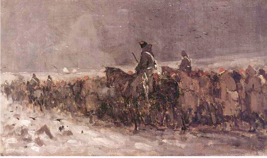
Resim 3: Nicolae Grigorescu'nun Convoi de Prizonieri Turci (Türk Esirleri Konvoyu) isimli tablosu.

esirlerin arasına sanki hayvana yem veriyormuş gibi somun parçaları atıyorlardı. Esirler günlerdir aç, susuz, yorgun ve uykusuz bir halde bu ekmekleri kapmak için birbirleriyle mücadelele girişiyorlardı. 25