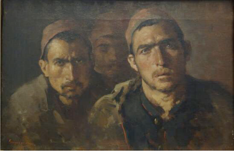
Resim 4: Nicolae Grigorescu'nun Prizonieri Turci (Türk Esirleri) isimli tablosu

Bu sırada Romanya hükümetinin Ruslara karşı olan bakış açısı değişmeye başlamıştı. Aslında Rumenlerin, Ruslarla ittifakı mecburiyetten kaynaklanmaktaydı. Bâbîâli'nin 1876 yılında yayınladığı meşrutiyet beyannamesinde Romanya'nın Osmanlı Devleti'ne tâbi muhtar bir eyalet olduğu yönündeki hüküm, kendilerini bağımsız hisseden Rumenleri, Rusya'ya mecbur bırakmıştı. Ayrıca Rumenler savaş sırasında tarafsız kalmak için çabalamışlar, fakat Osmanlı Devleti'ne ve Avrupalı devletlere yaptıkları müracaattan bir sonuç alamamışlardı. Rumenler çıkabilecek Osmanlı-Rus savaşının başından sonuna kadar Osmanlı Devleti lehine tarafsız kalacaklarını, gerekirse tarafsızlıklarını korumak için Ruslarla savaşı göze alacaklarını özel temsilcileri vasıtasıyla Bâbîâli'ye bildirmişlerdi. Bunun karşılığında Osmanlı Devleti'nden kendilerinin bağımsızlığını tanımalarını talep etmişlerdi. Buna karşın Osmanlı Devleti yetkilileri stratejik bir hata yaparak kendi hâkimiyetinde olan Romanya'nın tarafsız kalamayacağını, ancak kendisiyle ittifak ederek savaşa girmeleri gerektiğini ifade etmişlerdi. 37 Avrupalı devletler de Romanya'nın tarafsızlığını garanti etmekte çekimser kalmışlardı. Rumenler bahsi geçen sebep-