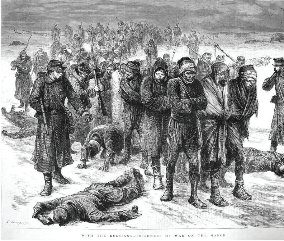
Ek 3: Rusların Denetiminde İlerleyen Savaş Esirleri 107