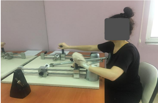
Çizim 3. Bilateral simetrik RİUBKE

İlk periyotta cihazın kolları masaya paralel olacak şekilde hastadan her iki kolu aynı anda simetrik olarak (her iki koluna aynı anda itme ve çekme hareketi yaparak) 5 dakika boyunca hareket ettirmesi istendi. İki dakikalık dinlenme arasından sonra cihazın pozisyonu değiştirilmeden bu defa kollar yine aynı anda senkronize bir şekilde bilateral resiprokal (bir koluna itme hareketi yaparken diğer koluna çekme hareketi yaparak) hareket ettirilerek 2. periyot sona erdirildi (Çizim 3).