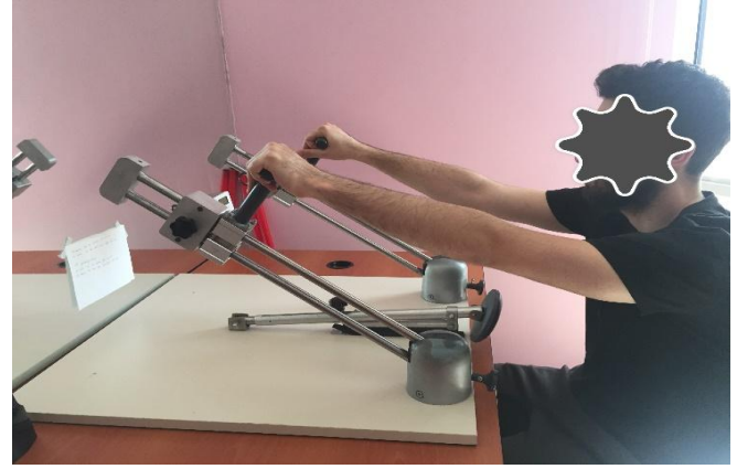
Çizim 4. Bilateral simetrik RİUBKE (45° lik açı)

tedavisi ile, tedavi öncesi ve sonrası değerlendirmeler aynı fizyoterapist tarafından yapıldı.