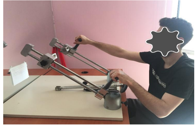
Çizim 5. Bilateral resiprokal (asimetrik) RİUBKE (45° lik açı)