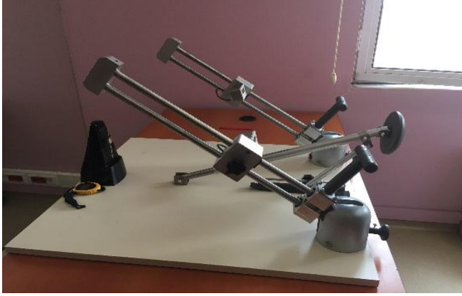
Çizim 2. RİUBKE cihazı

plejik el sabitlendi. Hastalar bu şekilde cihaza yerleştirildikten sonra 5'er dakikalık 4 periyottan oluşan toplam 20 dakikalık seanslar uygulandı.