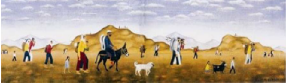
Resim 9. Nedim Günsür, Göçerler, 21 x 85 cm, 1980.

Nasıl ve nedeni ne olursa olsun göçlerin acı yüzleri sanat eserlerinde de kendini hissettirmektedir. Bu nedenle göçlerle ilgili yapılan çalışmalar insan sosyolojisinin canlı tanıkları, insani duyarlılık oluşturma gücü olan ve de insanlarda empatik duygular oluşturma çabasına sahip tarihi birer belgedirler (Üner, 2018, s.373).