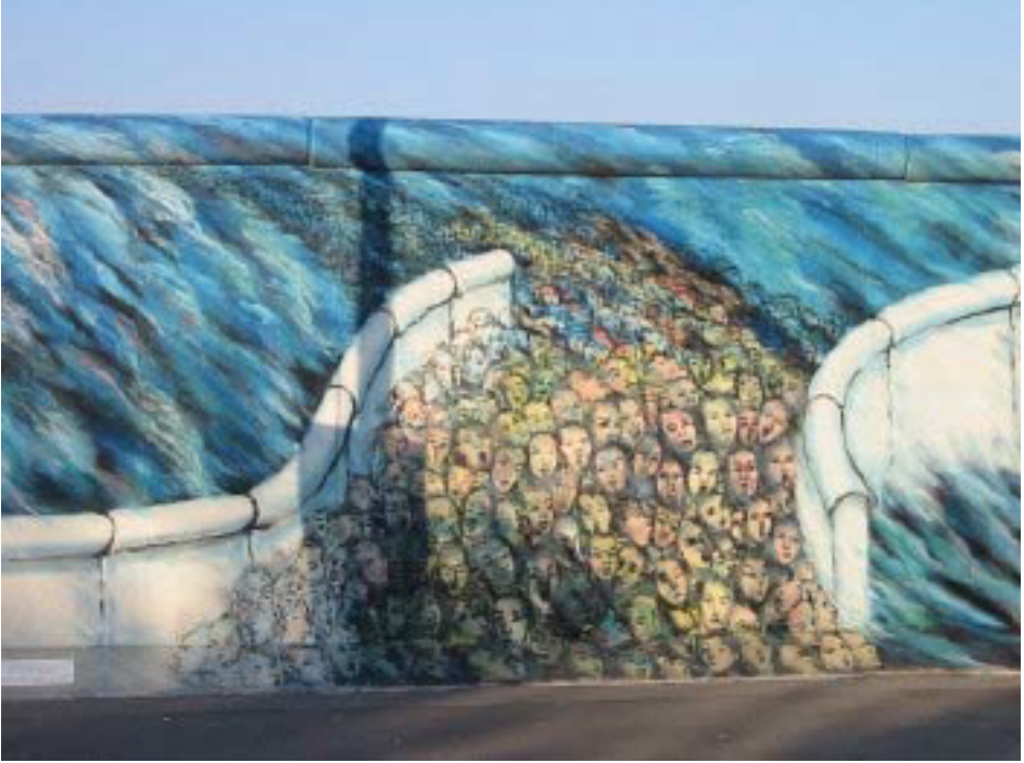
Resim 7. Berlin Duvarının doğu yakasındaki bölümüne kasım ayında yapılan grafiti, Kani Alavi, 1990.

Birçok ressam mültecilerin dramlarına çalışmalarında yer vermişlerdir. Almanya'da yaşayan fakat İran asıllı bir ressam olan Alavi'de bu ressamlardan biridir. Berlin duvarının doğu yakasında yaptığı duvar üzerine boyamaları bulunan Alavi, bu resimlemelerin bir kısmında da mültecilerin sulara yok oluşunu temsil eden aşağıdaki (Resim 7.) çalışmayı yapmıştır. 1990'da yaptığı çalışma son yıllarda yaşanan sulara kaybolan insan hayatlarını önceden gören bir tanık gibidir. Sularla baş edemeyeceğini düşünen insan yığınlarının haykırışları yine gitmek istemedikleri sulara kaybolmaya devam etmekteymiş gibi resmedildiği görülmektedir. İnsanların sıkça ziyaret ettiği mekânlardan olan bu duvarda böyle bir çalışmanın yer alması sanatın toplumsal duyarlılık oluşturması açısından önemlidir.