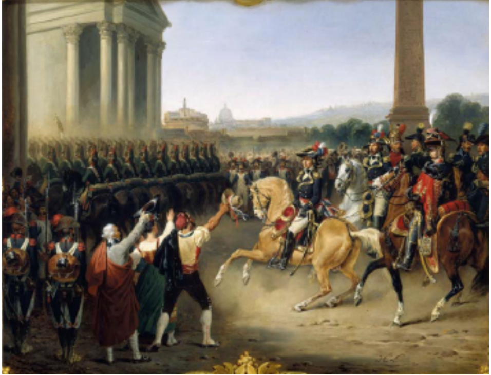
Resim 2. Fransız askerleri Roma'ya giriyor, 1798.

luş şekliyle ortaya konulmuştur. Figürlerin yüzlerinde acele ediş, korku ve kaygı ifadeleri dikkat çekmektedir. Resimde ele alınan telaş göçlerin sürükleneni olan çocuklara da yansıtılmıştır. Savaşlar göçleri tetikler ve kültürel değişimlere sebep olur. Yüzyılların tanığı olan sanat da her anı biriktiren bir arşiv gibidir. Fransız askerlerinin Roma'ya girişini anlatan Resim 2.'de bu kültürel değişime sahne olan anlık bir tarihi bir belge niteliğindedir denilebilir.