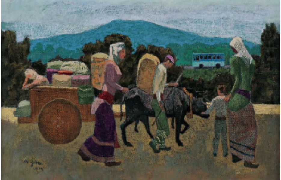
Resim 8. Nuri İyem "Göç",1975, 36x56cm. Duralit üzerine yağlıboya.

İyem, Göçler Serisi'yle (Resim 8.) bu temada birçok eser vermiştir. İyem' in resimlerinde hüznün ve umudun durgun hali göçün verdiği heyecanın önüne geçmiş gibidir. Uzaktaki otobüs umut ve geleceği, göçün taşıyıcısı kağnılarda var olan durumu anlatıyor gibidir.