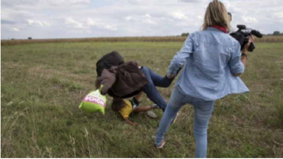
Resim 11. Kadın fotoğrafçı Petra Laszlo tarafından mülteci baba ve oğluna çelme takma anı.

Resim 11.' de göçmen baba ve çocuğunun, bir anne olan Macar kadın fotoğrafçı Petra Laszlo tarafından çelme takılarak düşürülme durumu fotoğraf karesine yansımıştır. Bu fotoğraf karesiyle “tarih tekerrürden ibarettir” sözü güncelliğini sağlamlaştırarak bizlere göstermektedir. Üstün ırk yani “beyaz” olan öteki olanı kabul etmiyor, aşağılıyor ve bunu yapan bir anne olmasına rağmen bir baba ve çocuğa acımasızca çelme takıp düşürüyor. Bu hareket medeni ve çağdaş Avrupa sınırları içerisinde yapılıyor.