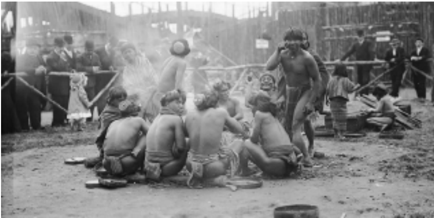
Resim 5. Batı'nın "İnsanat" Bahçelerinden Bir Kare.

Batı'nın hatırlamak ve hatırlatmak istemediği Amerika ve Avrupa'ya gemilerle çok farklı iklime sahip yerlerden, özellikle Afrika'dan getirilen toplumların zor ve baskıyla köleleştirildiği, para ödenerek görülebildiği hayvanat bahçesi gibi mekânlarda sergilenildiği, yıpratıldığı ve ırkçı tutumlara maruz kaldığı zorunlu göçler yaşanmıştır.