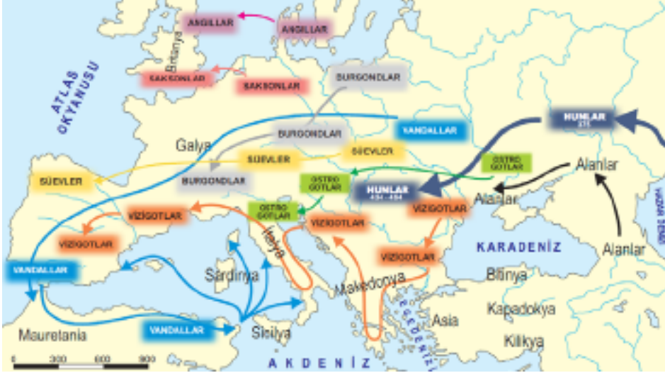
Resim 3. Kavimler Göçü, 375.

kaçan Hunların başlattığı Kavimler göçüdür. Bu göç Karadeniz'in kuzeyine, oradan da Avrupa'ya doğru devam edip bugünkü Avrupa devletlerinin temelini oluşturmuştur. (Aksoy, 2012, s.293) Sadece Kavimler göçünün hareket yönlerini betimleyen Resim 3.'ün kapsamını düşünürsek göçlerin sanat alanları ve diğer bilim dallarında bu kadar yer almış olması şaşırtıcı olmaz.