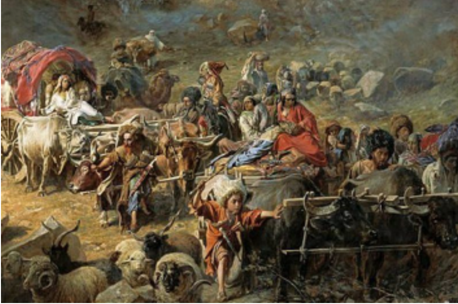
Resim 1. Kafkas sürgünü, 21 Mayıs 1864.

Diğer varlıklarda olduğu gibi insan da fiziksel ihtiyaçlarını karşılamak zorundadır. Bu ihtiyaçlar insanoğlunu hayatta kalma savaşının bir parçası yapmıştır. İnsan var olma savaşını verirken bu savaşın sebep ve şekilleri değişse de sonuçları hep aynı olmuştur; ölüm ve göç gibi. (Avara, 2019, s.16) İnsanların toplu bir şekilde bir yerden diğer bir yere yani çok da tanıdık olmayan mekânlara sürükleyen birçok sebep bulunmaktadır. Bunlardan birkaçını şöyle özetleyebiliriz: Aç kalma korkusu ve iklimsel etkiler ile (kuraklık, kıtlık) oluşan güdülenmişlik, öz vatanında yaşadığı trajedilerin verdiği bıkkınlık (savaş, kültürel zorbalık), irade baskısıyla oluşan istem dışı evinden ayrılıklar (mücadele, zorunlu göç ettirilme) (Ata ve Tamer, 2018, s.728).