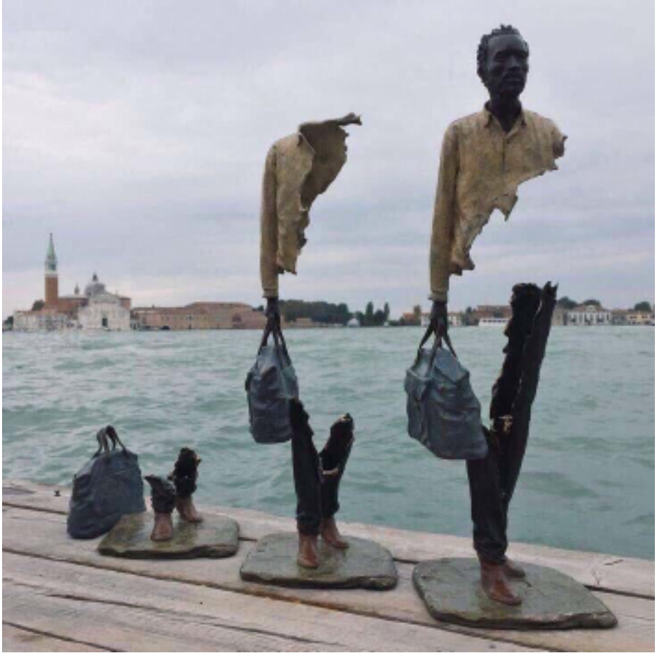
Resim 10. Fas asıllı sanatçı Bruno Catalano'nun göçmenleri ve mültecileri anlattığı eseri: "Gurbette Yok Olup Gitmek"

Ya da Macar gazetecinin çelme takarak hayatının çaresi ve çocuğunun geleceğinin peşinden giden babanın yuvarlanışındaki hissettiğimiz duygu. Bütün hepsinde aşağılanmışlık, benliğinden ve kimliğinden ötürü ötekileştirilmiş duygular ile insan olma erdeminden bir şeyler eksiltilmiş durumlar barındırmaktadır.