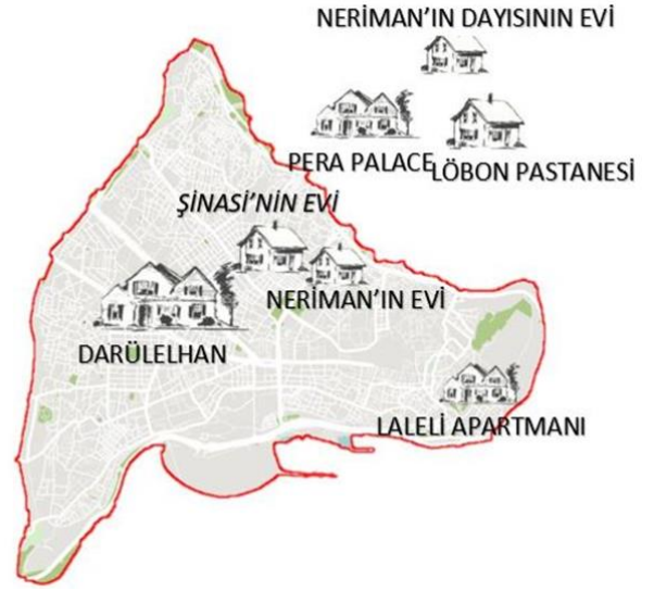
Fatih Harbiye Romanında Çevresel Mekânlar