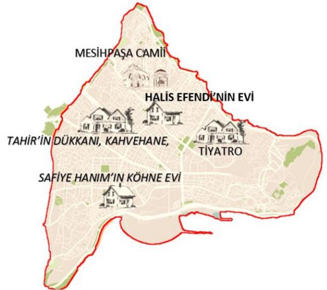
Mesihpaşa İmamı Romanında Çevresel Mekânlar