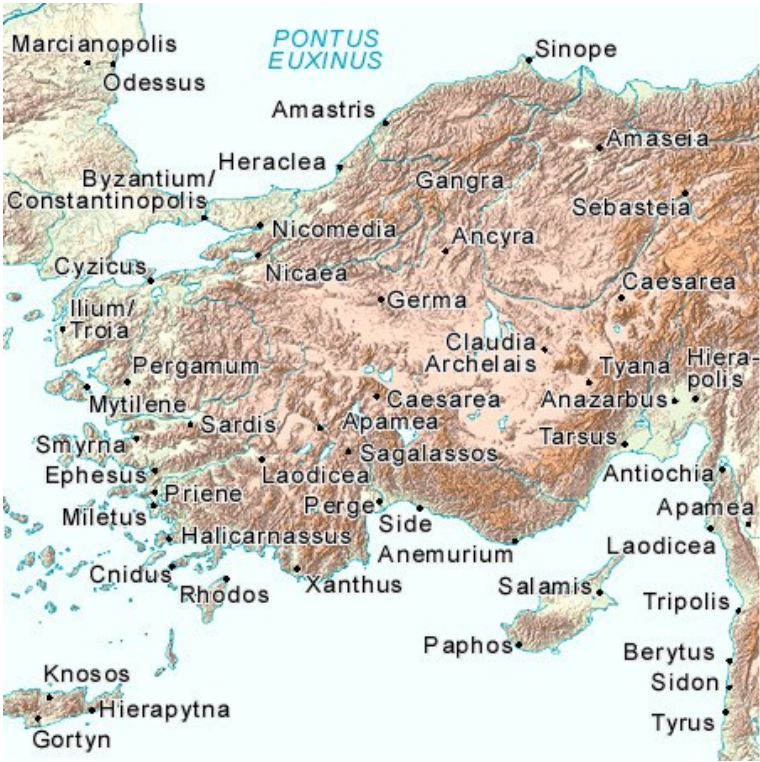
Görsel 2: Küçük Asya'da belli başlı Roma kentleri. (Barrington Atlas of the Greek and Roman World'dan alıntıdır.)