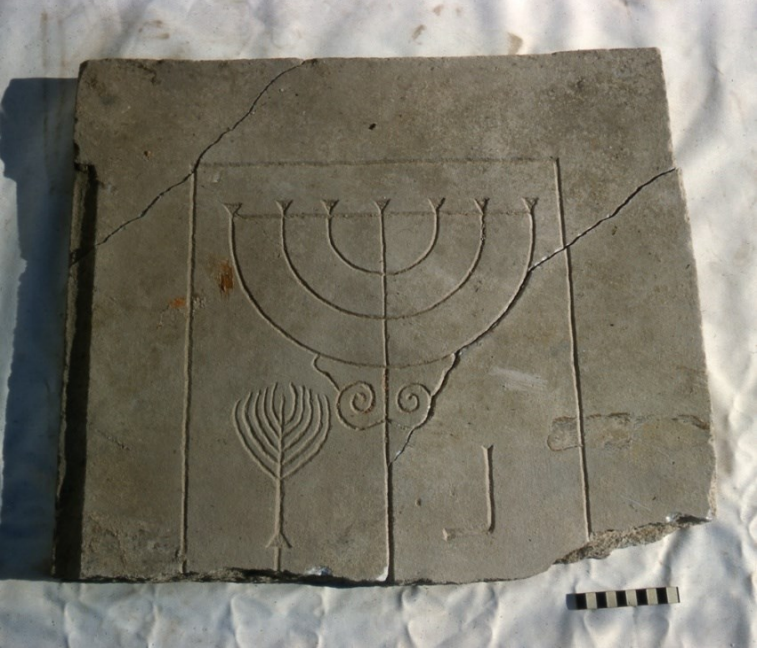
Görsel 4: Sardeis sinagog kazılarında bulunmuş menaro tasvirli levha.