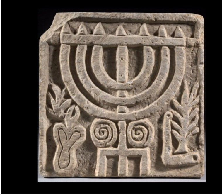
Görsel 5: Priene sinagog kazılarında bulunan menora kabartmalı levha.