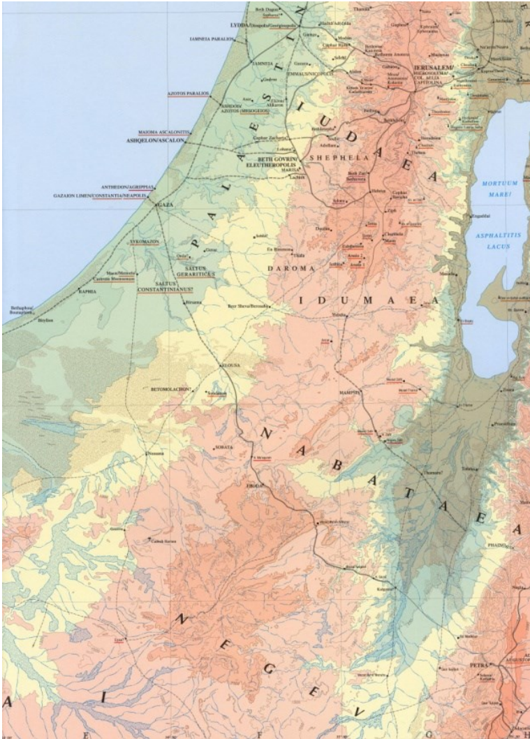
Görsel 1: Roma ve Geç Antik Çağ'da Yahuda çevresi