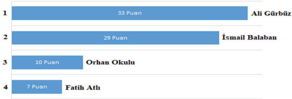
Şekil 4. Yağlı güreş seyircisi tarafından belirtilen ‘izlemekten keyif aldığınız başpehlivan’ sorusuna verilen cevapların puan sıralaması.

Şekil 4’te yağlı güreş seyircisi tarafından belirtilen izlemekten keyif aldığım başpehlivan sıralamasında (33 puan) Ali Gürbüz, (29 puan) ile İsmail Balaban, (10 puan) ile Orhan Okulu, (7 puan) ile Fatih Atlı yer almaktadır. Aşağıda aldıkları puanlara göre ilk dört içinde yer alan başpehlivanlara yer verilmiştir. Değerlendirme sadece 2019 Kırkpınar Yağlı Güreşlerine katılan başpehlivanları kapsamaktadır.