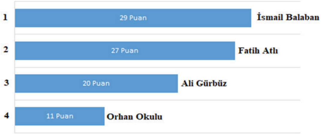
Şekil 3. Yağlı güreş seyircisi tarafından belirtilen en teknik başpehlivanların puan sıralaması.

Şekil 4’te yağlı güreş seyircisi tarafından belirtilen izlemekten keyif aldığım başpehlivan sıralamasında (33 puan) Ali Gürbüz, (29 puan) ile İsmail Balaban, (10 puan) ile Orhan Okulu, (7 puan) ile Fatih Atlı yer almaktadır. Aşağıda aldıkları puanlara göre ilk dört içinde yer alan başpehlivanlara yer verilmiştir. Değerlendirme sadece 2019 Kırkpınar Yağlı Güreşlerine katılan başpehlivanları kapsamaktadır.