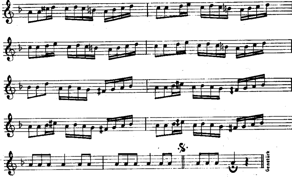
Nota 4 Gelin Alma Havası-2 (TRT-THM, No:287)