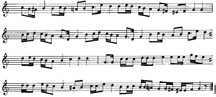
Nota 2 Gelin Alay Havası-2 (TRT-THM, No:104)