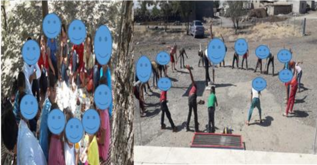
Resim 10. Öğrenci Etkinlikleri

(13) En güzel etkinlik çevre ile ilgili olandı (Ö 8 )