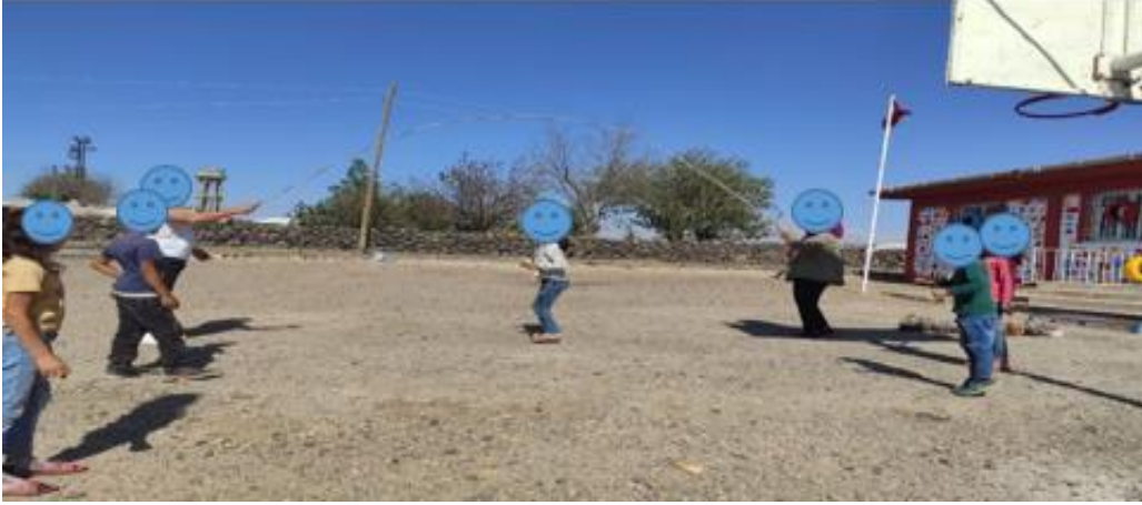
Resim 6. Öğrenci Etkinlikleri