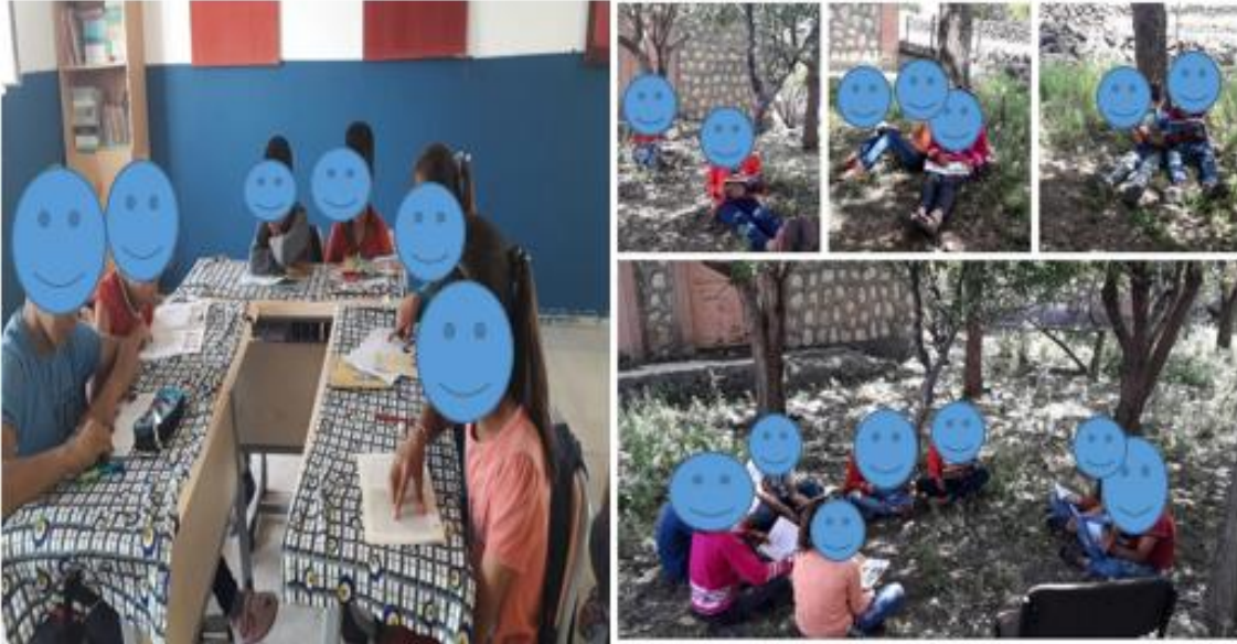
Resim 9. Öğrenci Etkinlikleri

(12) Arkadaşımdan memnundum. Çok güzel görevlerini yerine getirdiler. (Ö 7 )