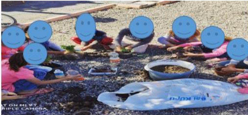
Resim 12. Öğrenci Etkinlikleri

(14) En güzel etkinlik çevre ile ilgili olandı. (Ö 9 )