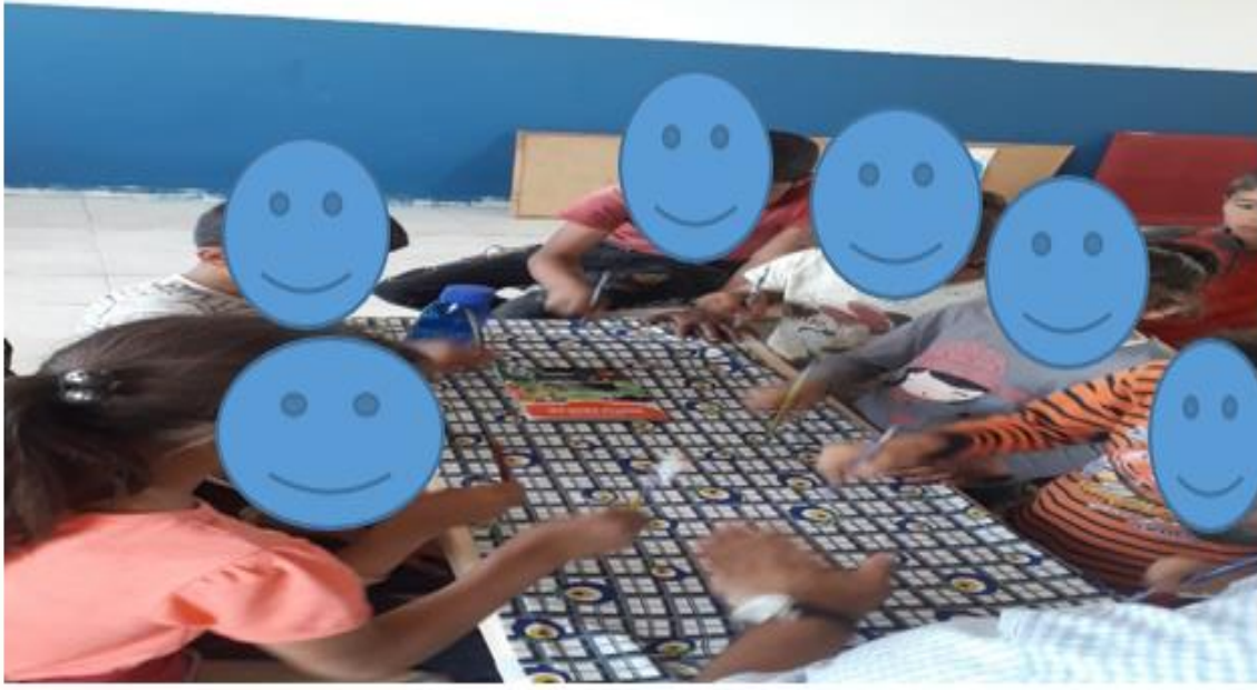
Resim 4. Öğrenci Etkinlikleri

(4) Bazen etkinliklerimizi yapacak malzememiz yoktu. (Ö 8 )