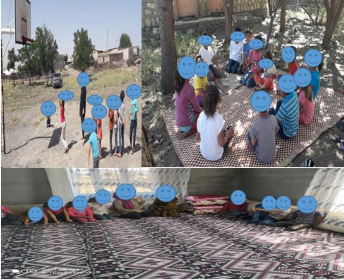
Resim 8. Öğrenci Etkinlikleri