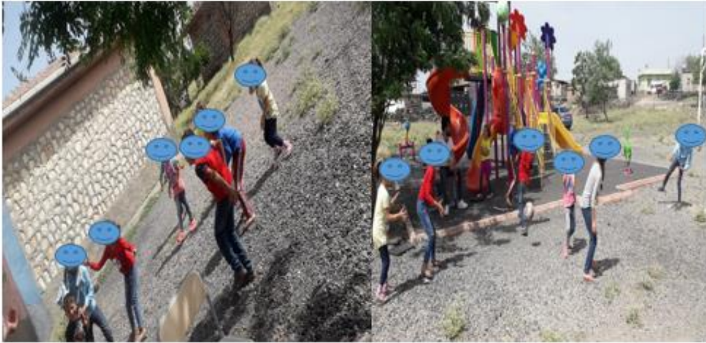
Resim 7. Öğrenci Etkinlikleri

(9) Grup halinde materyaller hazırladık. (Ö 4 )