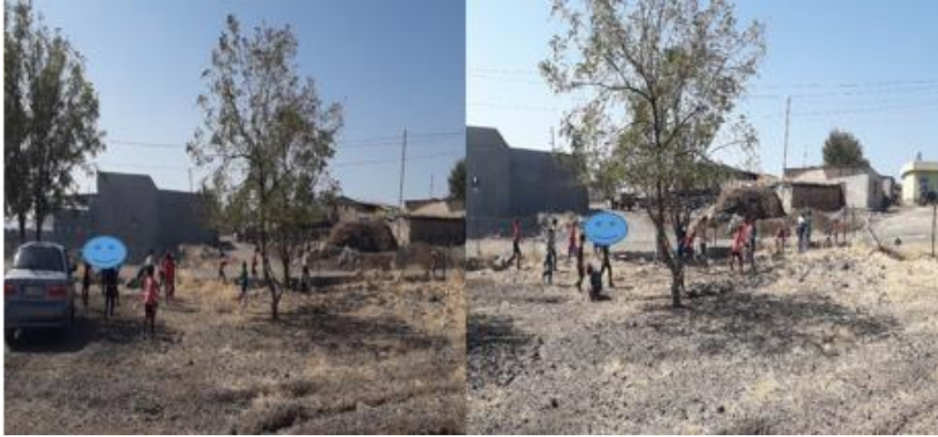
Resim 5. Öğrenci Etkinlikleri

(7) Hep beraber çevreyi temiz tutmak için çöp topladık. (Ö 2 )