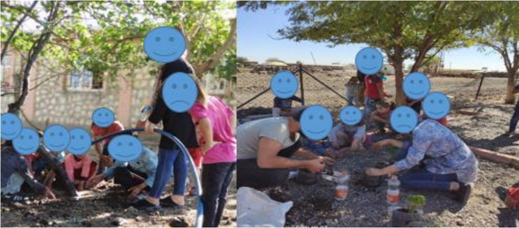
Resim 11. Öğrenci Etkinlikleri

(13) En güzel etkinlik çevre ile ilgili olandı (Ö 8 )