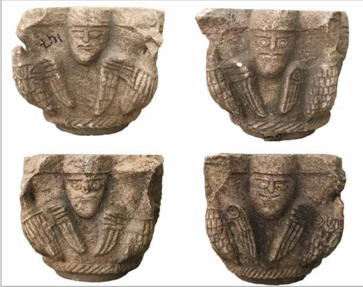
Fotoğraf 2. Tire Müzesi'nde bulunan sütun başlığı (147 Env.No.) / Capital from Tire Museum (Inv.No. 147).

örnekte de olduğu gibi, diğer eserlerde tarihlendirmeyi sağlayacak farklı özellikler var iken, Tire örneğinde başka herhangi bir motif bulunmamaktadır 15 . İstanbul Arkeoloji Müzesi'ndeki benzer başlığı da bu bağlamda Tire örneğine yakın bulmaktayız. Makalemizde incelediğimiz bu sütun başlıkları bir grup olarak düşünüldüğünde, bu grubun birbirine en yakın üyeleri İstanbul ve Tire örneğidir. Yine de bu iki yakın örnek İstanbul Arkeoloji Müzesi'nde bulunan sütun başlığındaki kartalların gövdesinin tüylerinin işlenmeden çıplak bırakılmış olması, Tire'dekinde ise kartal gövdelerinin tüylerle bezenmiş olması açısından birbirinden farklılaşır.