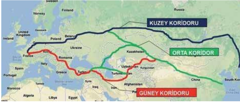
Harita 1: Modern İpek Yolu'nun Doğu-Batı Ulaşım Koridorları

yeniden kullanılabilir hale getirmişlerdir. Bu ve benzeri gelişmeler tarihin en iyi bilinen kara ve kentlerinin birer turizm markası olarak kullanılmasını gündeme getirmiştir. Bu nedenle Klasik Doğu İpek Yolundaki ticaret ve turizm alanındaki işbirlikleri günümüzde artarak devam etmektedir. İpek Yolu tarihi filmlerde ve seyahat medyalarında Orta Asya odaklı tasvirlerle Doğu İmajlı betimlenmiştir. Bu nedenle İpek Yolu turizmiyle ilgili bilgi ve faaliyetlerin odak noktasını, Çin'den başlayıp İstanbul'da sona eren 'Klasik İpek Yol' oluşturmuştur. Modern turizm pazarlamasının da Batı sınırı İstanbul olan Klasik İpek Yolu üzerinde yoğunlaştığı bilinmektedir (UNWTO, Greece, 2018: 12). Bu tanımlamadan Türkiye'nin İpek Yolu Turizminde ne kadar avantajlı bir konumda olduğu görülebilir.