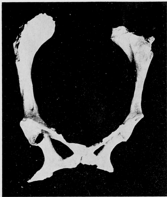
20 b (Ventral view)