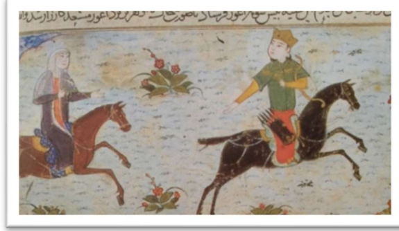
Resim 2: Oğuz’un hareminden bir kadınla avlanması, Câmîü’t-Tevârîh, 13. yy. Topkapı Sarayı Müzesi (Türkoğlu, 2002: 153).

Boylarda daha çok “ton”, “kaftan”, “gömlek”, “kürk”, “kepenek”, “cübbe”, “yamaklı don” görülen giyim kuşam isim ve terimleri tespit edilmiştir. Bu unsurların günlük giyim tarzını yansıttığı düşünülmektedir.