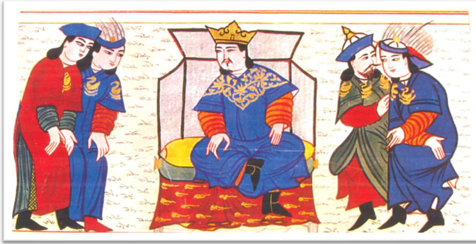
Resim 4: Türk Milletinin ilk ve büyük Hakamı, Oğuz Han (Görgünay, 2008: 125).

Kültürün en ayrıcalıklı alanları olan törenlerin, Oğuzların kültür hayatında önemli bir yeri vardır. Törenlerin ortaya çıkışında çeşitli unsurların rol oynadığı görülmektedir. Oğuzlarda törenlerin çeşitli sebeplerle yapıldığı görülmektedir. Bu törenlerde kullanılan giyim kuşam örneklerini Dede Korkut boylarında görmek mümkündür. Boylarda giyim kuşam açısından törenler; düğün, yas şeklinde geçiş dönemlerinden evlenme ve ölüm üzerine yapılan törenlere rastlanmaktadır. Düğün, birlik beraberliği sağlayan Oğuzları bir araya getiren törenlerden bir tanesidir. Dede Korkut boylarında kadın ve erkek düğün giyim kuşamıyla ilgili isim ve terimlerin olduğu anlaşılmaktadır.