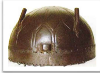
Resim 8: XI. yüzyıla ait yuvarlak miğfer Azerbaycan Milli Tarih Müzesi (Ahmedov, Ağayev, 2014: 31).

Tulga, savaşçının başını korumak için giydiği genellikle demirden yapılmış başlıktır (Pakalın, 1993: 5533). Dede Korkut Kitabı’nın Günbet nüshasında tulga kelimesi, “ tavulga ” 16 olarak yer almaktadır. Tulgaya “miğfer” de denilmektedir. Miğfer kelimesi, İslamiyet’i kabul ettikten sonra Türkler tarafından kullanılmaya başlanmıştır. İslamiyet’in kabulünden sonra da tulga, savaşçılar tarafından kullanılmıştır.