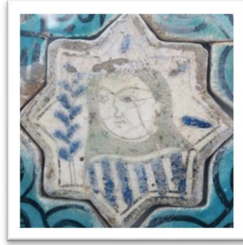
Resim 3: Yaşmak görünümlü kadın

Kadınların başlarını örten ve omuzlara kadar inen kumaşa yaşmak denirdi (Resim 3). Yaşmak sokağa çıkarken kullanılırdı.