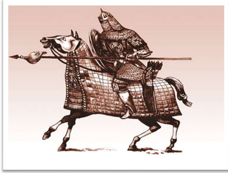
Resim 7: Zırhlı şövalye (Guliyeva, 2018: 139).

Başlık olarak “ kunt ıřuk ” 15 denilen başlık kullanılırdı: “ Yin yakalar dikdüreyim senün için; Başumda kunt ıřuklar saklar idim bu gün için günü geldi” (Ergin, 2014: 159).