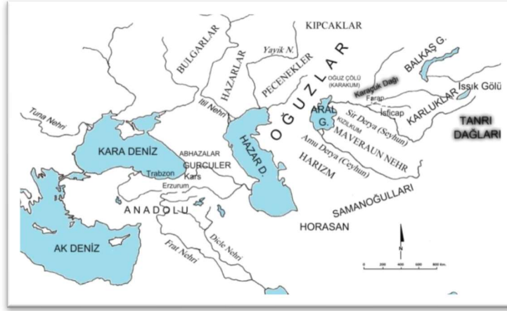
Resim 1: Oğuz coğrafyasında ve X. yüzyıl Dede Korkut boylarında geçen yer isimleri (Buldu; Meydan; Güngör, 2016: 932).

Denizi'ne ve Doğu Anadolu'ya kadar geniş bir bölgeyi içine alan coğrafi alan olarak karşımıza çıkmaktadır (Ergin, 2014: 52).