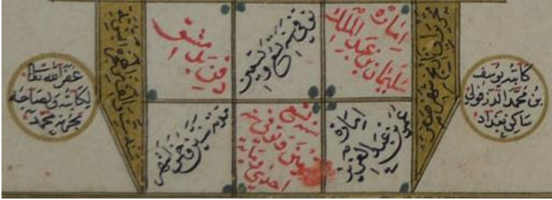
Resim 1. Silsilenâme, Ketebe kaydı, TSMK H. 1591, y. 14a.