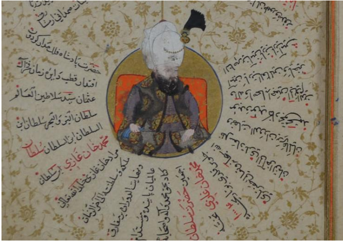
Kaynak: Ayğan, A. (2017).