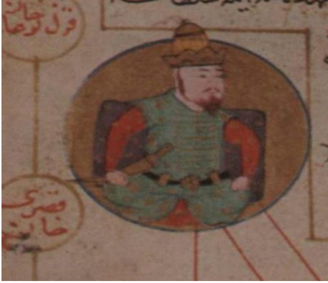
Kaynak: Bayram, S. (1994).