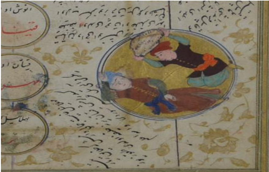
Resim 4. Silsilename, Kâbil'in Hâbil'i öldürmesi, TSMK H. 1624, y. 5b-y.6a.

Minyatür sayıları nüshalara göre değişmektedir. Eserlerde daha çok tarihte önemli yeri olan karakterlerin betimlendiğini söyleyebiliriz. Madalyonlar içerisinde çoğunlukla bir karakterin minyatürü yer alsa da bazı madalyonlarda iki karakterin birlikte betimlendiği görülür. TSMK H. 1624 numaralı nüshada Âdem ve Cebrail madalyonu, Hâbil ve Kâbil madalyonu buna örnek olarak gösterilebilir. Bunlardan Kâbil'in kardeşi Hâbili öldürme sahnesi silsilename nüshaları arasında dikkat çeker. Altın zeminli madalyonda Hâbil, bir eli başının altına almış, gözleri kapalı uyur vaziyettedir. Kâbil ise diz üstü oturmuş pozisyonunda büyükçe bir taş tutmaktadır. Taşın bir hayvan başı görünümü olması olayın kötülüğüne bir vurgu olarak düşünülebilir. ( Resim 4 ).