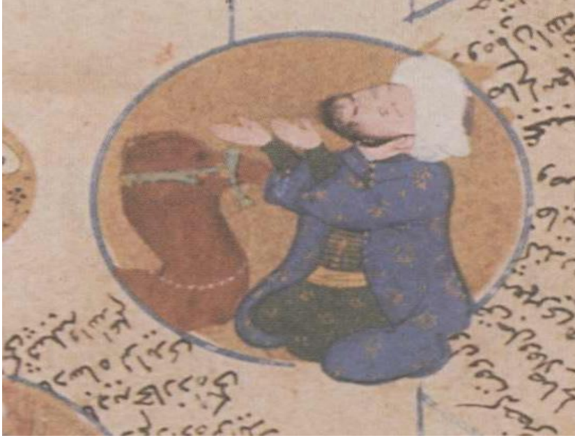
Resim 5. Silsilenâme, Sâlih Peygamber ve devesi , Dublin CBL T. 423, y. 18b.

anlatır hale dönüşmüştür. Örneğin Salih peygamber madalyonunda, ellerini göğe kaldıran Salih peygamberin yanında bir deve betimlenmiş, Salih peygamberin kendisinden mucize isteyen topluluk karşısında Allah'a dua etmesi ve mucizenin gerçekleşmesi canlandırılmıştır ( Resim 5 ).