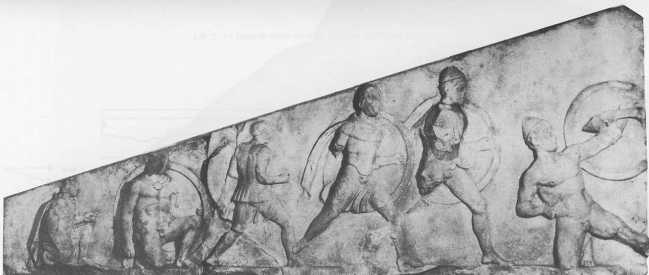
Fig. 1. L'aile gauche du fronton occidental.