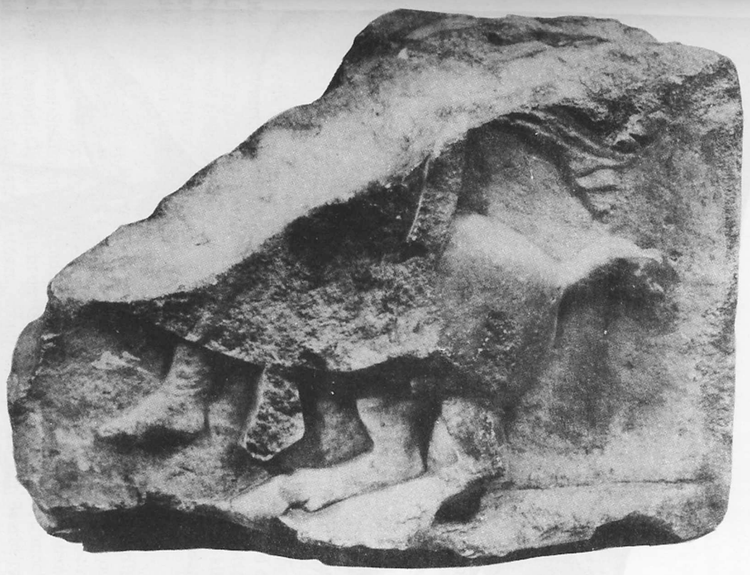
Fig. 3. Le fragment 943.