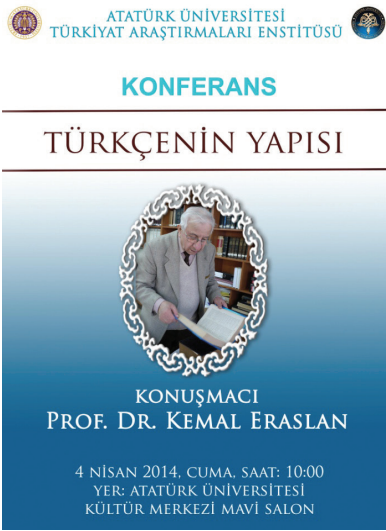
Fotoğraf 3-4: Atatürk Üniversitesi Türkiyat Araştırmaları Enstitüsü tarafından 2014 yılı içinde düzenlenen konferanslar.

Yapılan yayınların dışında Türkiyat Araştırmaları Enstitüsü Müdürlüğü tarafından seminer, sempozyum, panel ve konferanslar düzenlenmektedir. Bu kapsamda bugüne kadar toplam 36 konferans, 21 panel düzenlenmiştir.