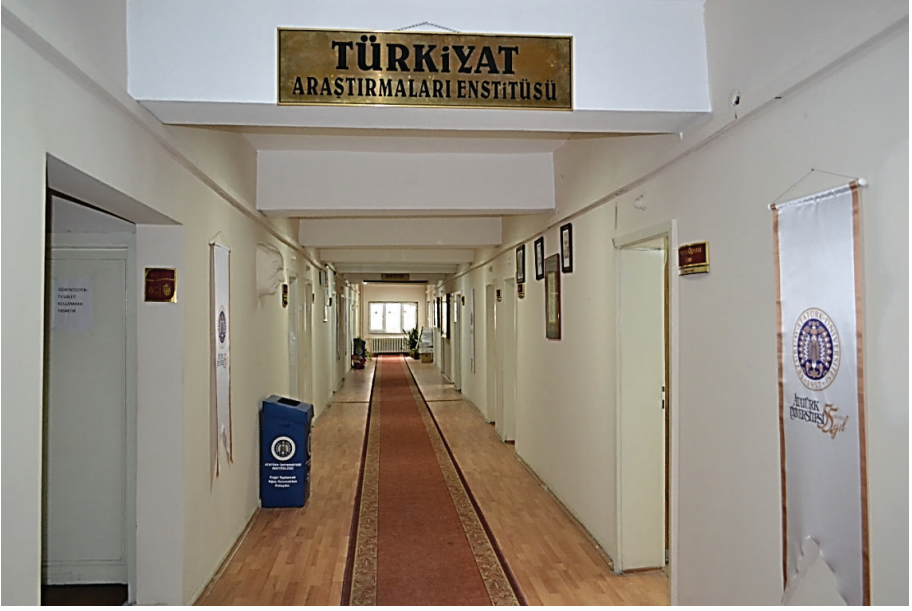
Fotoğraf 1: Türkiyat Araştırmaları Enstitüsünün hizmet verdiği mekân.

Kuruluşunun ardından Yüksek Öğretim Kurulu Başkanlığının 07.10.1993 tarih ve 36/759 sayılı kararıyla Enstitü bünyesinde Türk Dili ve Edebiyatı ile Türk Tarihi Ana Bilim Dalları açılmıştır. Hâlihazırda ise Türk Dünyası Edebiyatları, Türk Dili ve Lehçeleri, Türk Dünyası Halk Bilimi, Türk Tarihi Ana Bilim Dalları bulunmaktadır.