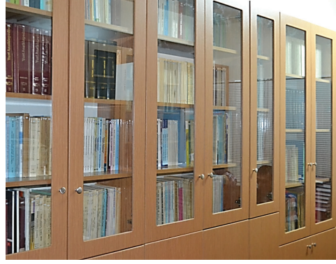
Fotoğraf 2: Türkiyat Araştırmaları Enstitüsü Kütüphanesinden görüntü.

Yapılan yayınların dışında Türkiyat Araştırmaları Enstitüsü Müdürlüğü tarafından seminer, sempozyum, panel ve konferanslar düzenlenmektedir. Bu kapsamda bugüne kadar toplam 36 konferans, 21 panel düzenlenmiştir.