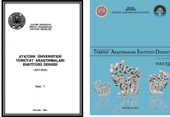
foto 6-7: Türkiyat Araştırmaları Enstitüsü Dergisi'nin ilk ve son sayısına ait kapak fotoğrafları

Dergi açısından önemli bir diğer değişiklik yayın süresi bağlamında bir standardın yakalanması olmuştur. Daha önce bir yıl içerisinde farklı sayılarda yayımlanan dergi, yılda iki kez yayımlanır hâle getirilmiştir. Yenilenen yazım ve yayın ilkeleri ile biçimsel açıdan da bir standart yakalanmıştır.