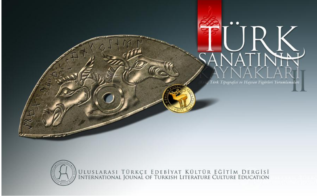
Türk Sanatının Kaynakları (Kök) Türk Tipografisi ve Hayvan Figürleri Yorumlamaları II