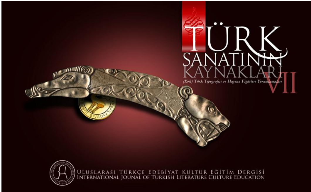
Türk Sanatının Kaynakları (Kök) Türk Tipografisi ve Hayvan Figürleri Yorumlamaları VII