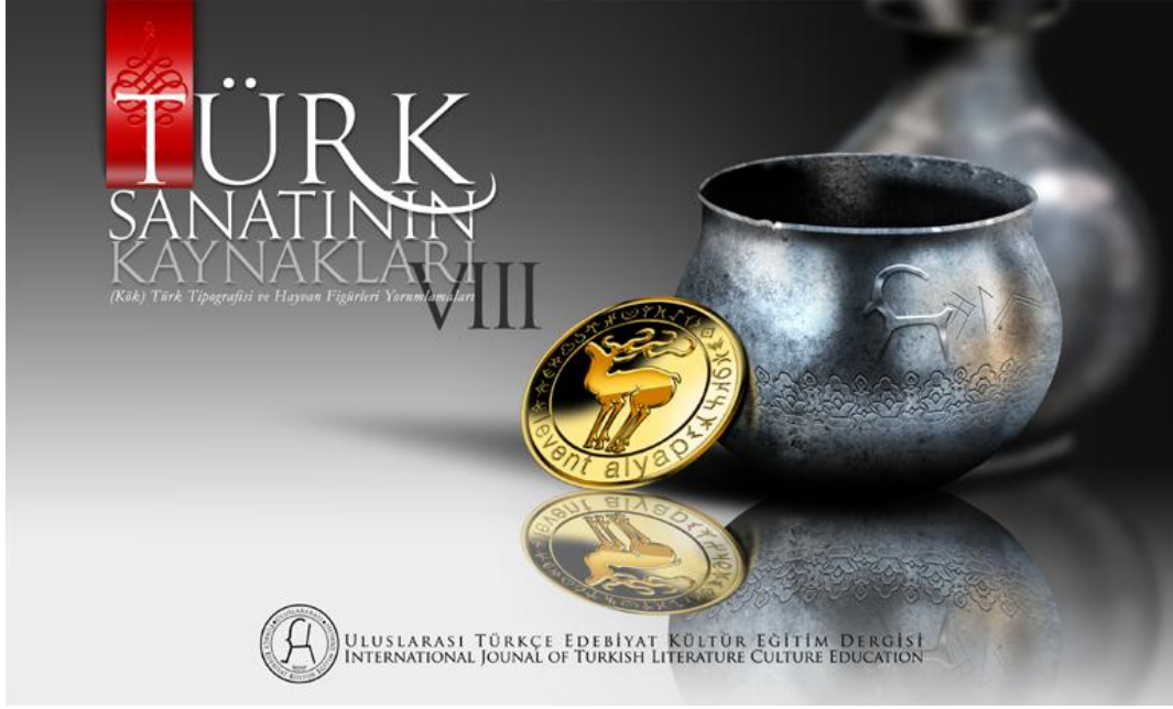
Türk Sanatının Kaynakları (Kök) Türk Tipografisi ve Hayvan Figürleri Yorumlamaları VIII