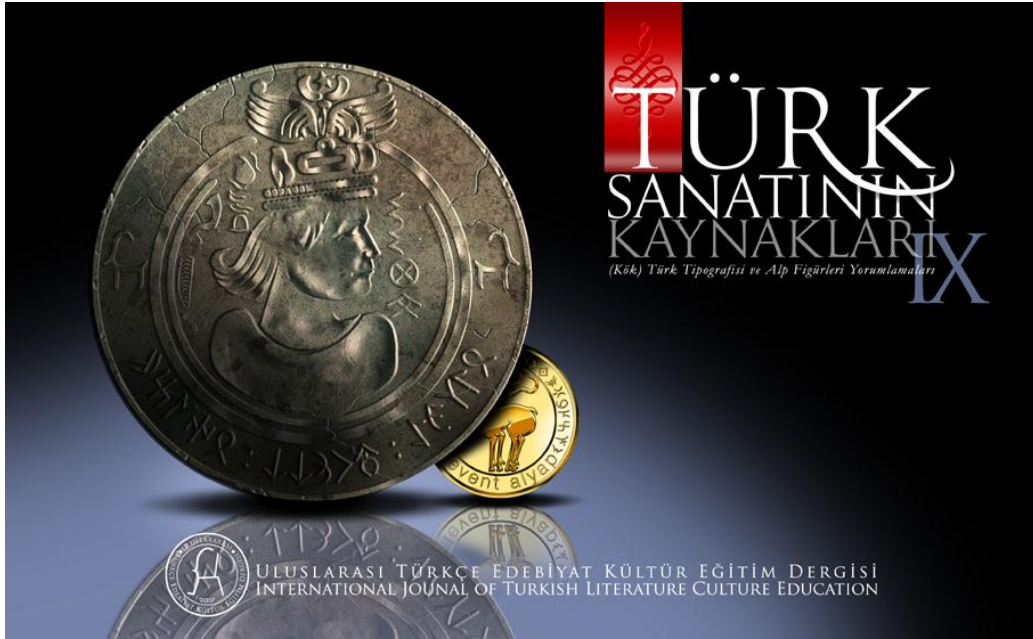
Türk Sanatının Kaynakları (Kök) Türk Tipografisi ve Alp Figürleri Yorumlamaları IX