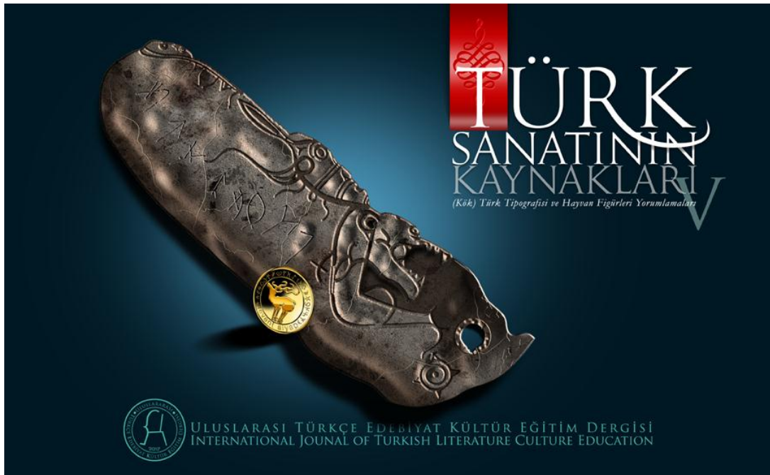
Türk Sanatının Kaynakları (Kök) Türk Tipografisi ve Hayvan Figürleri Yorumlamaları V