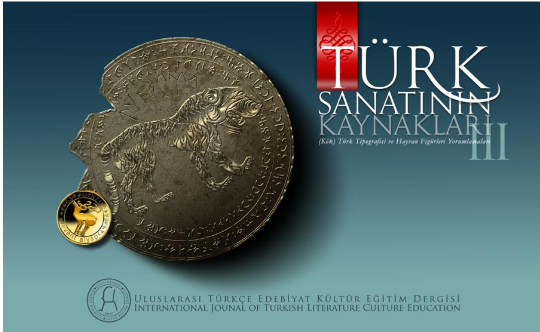
Türk Sanatının Kaynakları (Kök) Türk Tipografisi ve Hayvan Figürleri Yorumlamaları III