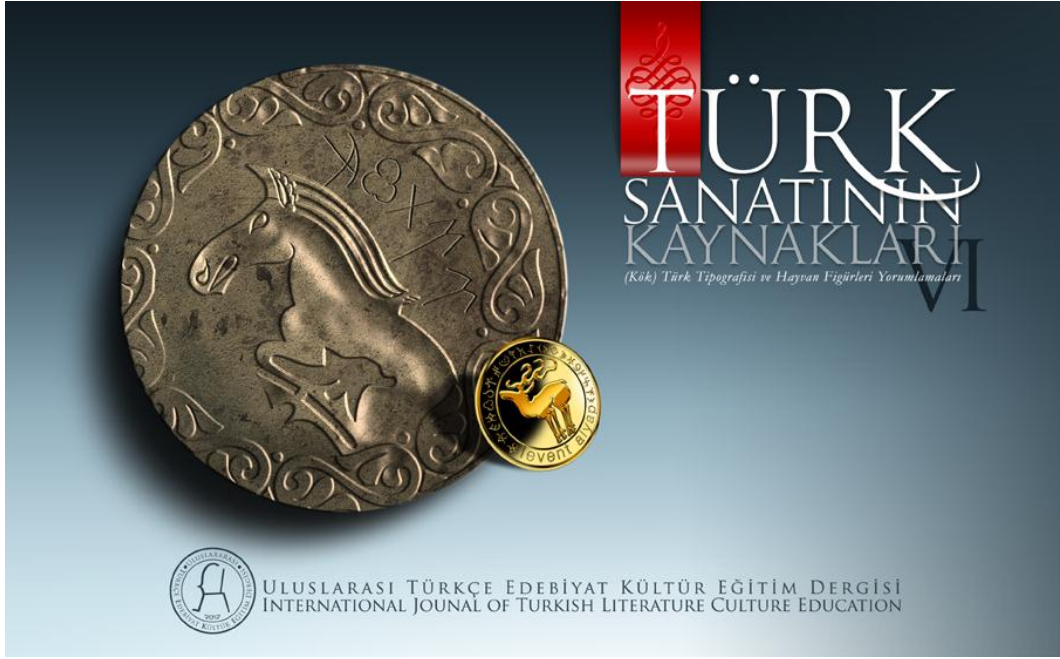
Türk Sanatının Kaynakları (Kök) Türk Tipografisi ve Hayvan Figürleri Yorumlamaları VI