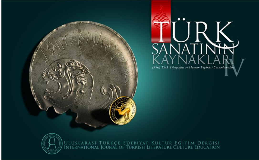
Türk Sanatının Kaynakları (Kök) Türk Tipografisi ve Hayvan Figürleri Yorumlamaları IV