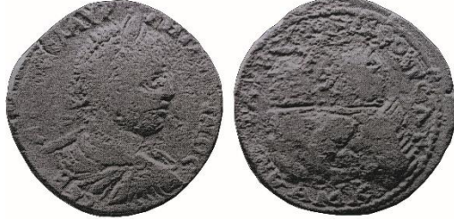
Şekil 7. Elagabalus Dönemi (M.S. 218-222) Anazarbos Sikkesi, (Levante, 1986, 1419).