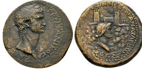
Şekil 4. Claudius Dönemi (M.S. 41-54) Anazarbos Sikkesi ( https:// www.acsearch.info /search.html?id =4248768 , 24.08.2020).