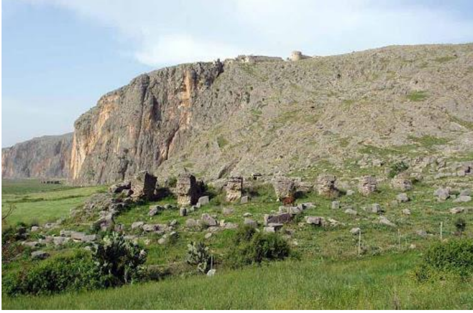
Şekil 5. Aşağı kentten Anazarbos kayalığı ve üzerindeki Ortaçağ Dönemi kalesi, güneyden görünüm.

sağındaki üç sütunun ise kalenin giriş kısmı olması gerektiğini düşünmekteyiz. Ancak, kayalık üzerinde Roma İmparatorluğu ve sonraki dönemlerde çok fazla değişiklik olduğu için bu yapılar hakkında hiçbir bilgiye sahip değiliz. Buna rağmen, oldukça kötü korunmuş iki Yunanca yazıt ve merdivenlerin yanında kayaya oyulmuş bir yarım kantharos bu erken kalenin tarihini doğrulamaktadır (Gough, 1952, s. 108).