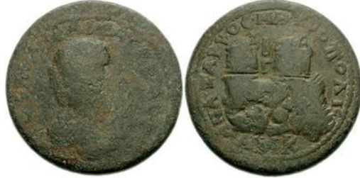
Şekil 8. Elagabalus Dönemi (M.S. 218-222) Iulia Maesa (Elagabalus'un büyük annesi, Augusta, M.S. 218-225) Tasvirli Anazarbos Sikkesi ( https://www.acsearch.info/search.html?id=208349 , 24.08.2020).