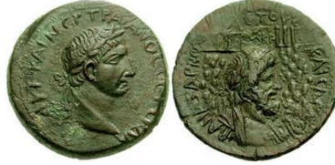
Şekil 6. Traianus Dönemi (M.S. 98-117) Anazarbos Sikkesi, ( https://www.acsearch.info/search.html?id=157442 , 24.08.2020).