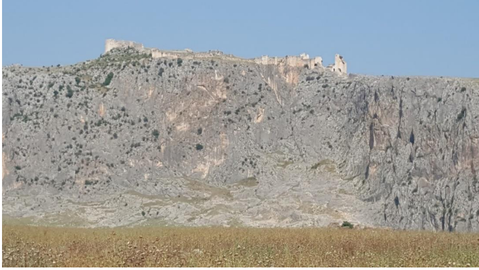
Şekil 9. Aşağı kentten Anazarbos kayalığı ve üzerindeki Ortaçağ Dönemi kalesi, batıdan görünüm

cepheleri dörtten on bire kadar olan birçok neokoros tapınağı tasviri ortaya çıkmıştır. Bu tapınakların muhtemelen tamamı, kutsallığından dolayı kayalık üzerinde yer almaktaydı. Ne yazık ki günümüze kadar yapılan araştırmalarda bu tapınaklara dair de herhangi bir kalıntıya rastlanılmamıştır.