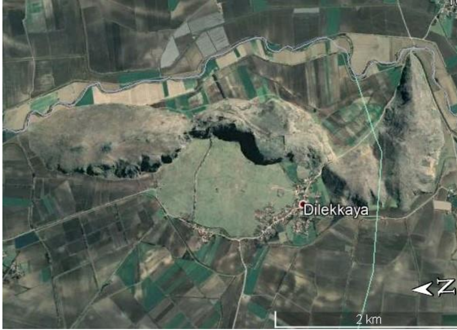
Şekil 3. Anazarbos Kenti'nin güncel uydu görüntüsü (Google Earth, 20 Eylül 2020).