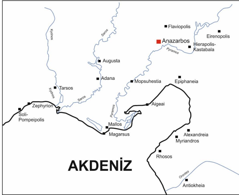
Şekil 1. Kilikia Pedias haritası ve Anazarbos'un konumu (Çiz. Musa Cem Fırat).

Adana İli'nin Kozan İlçesi'nin Dilekkaya Mahallesi sınırları içerisinde kalan Anazarbos, kayalık üzerindeki yukarı kent (=akropolis) ve düz alandaki aşağı kentten oluşmaktadır (Şekil 2). Kentin günümüze ulaşabilmiş kalıntıları; kayalık üzerindeki geç dönem kalesi, Kaya Kilisesi, Havariler Kilisesi ile ovalık kısımdaki su kemerleri, kent suru, zafer takı, sütunlu yol, hamam, gymnasion , tapınak, tiyatro, amfiteyatro, nekropolis , stadion ve işlevi henüz tespit edilememiş çeşitli yapılardan oluşmaktadır (Buyruk, 2016, s. 698 vd.; De Giorgi, 2012, s. 127; Özcan, 2001, s. 30 vd.; Gough, 1952, s. 99 vd.). Şu ana kadar yapılan araştırmalarda, Anazarbos isminin kaynağı ve anlamı tespit edilememiştir (Özcan, 2001, s. 29). Antik kaynaklar da bu konuda tutarsız bilgiler vermektedirler (Sayar, 2000, s. 9-10). Bütün öneriler içinde en tutarlı olan ise, kentteki kültürden dolayı Mithras'ın 'Nazarba' şeklindeki lakabına ithafen bu ismin kayalığa verilmiş olabileceği görüşüdür (Ergeç, 2001, s. 390; Gough, 1952, s. 92).