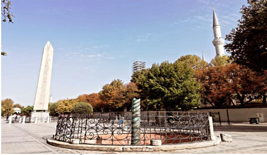
Resim 8: Dikilitaş ve Örgü Sütun

Öntuğ, M. M. ve Soysal, M. (2020, Ekim). Gezinlerin gözünden gravürlere yansıyan XVIII ve XIX. yüzyıl İstanbul şehir yapıları ve günümüz karşılařtırması. Karatay Sosyal Arařtırmalar Dergisi , (5), 85-112.