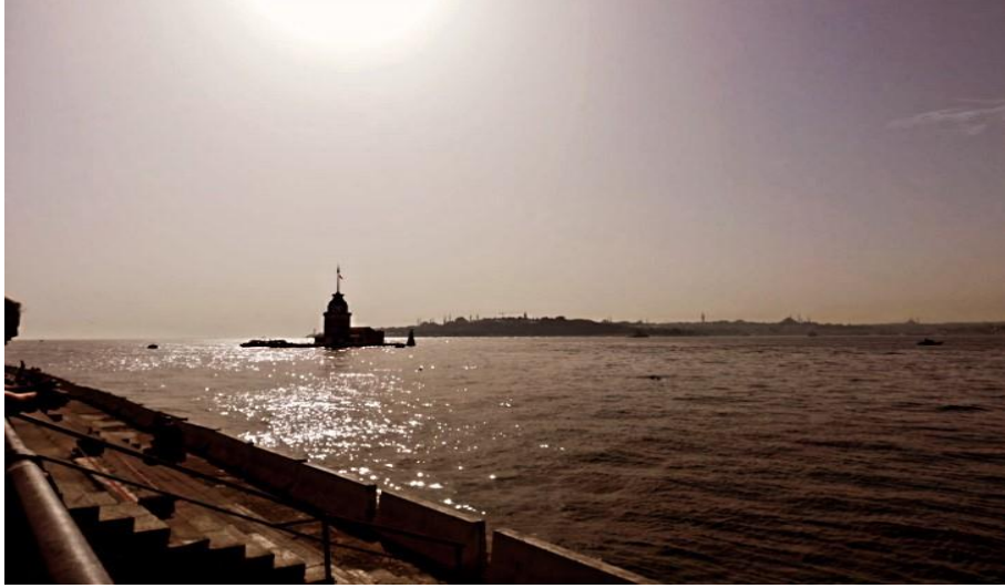
Resim 13: Üsküdar'dan görünen Kız Kulesi

Öntuđ, M. M. ve Soysal, M. (2020, Ekim). Gezinlerin gözünden gravürlere yansıyan XVIII ve XIX. yüzyıl İstanbul şehir yapıları ve günümüz karşılařtırması. Karatay Sosyal Arařtırmalar Dergisi , (5), 85-112.