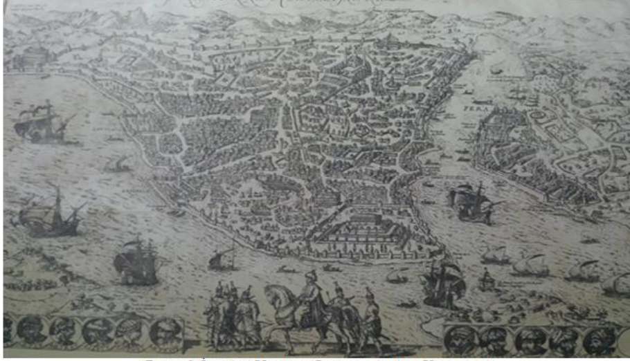
Resim 1: İstanbul haritası (Giovanni Andrea Vavassore)

istemeleri ve merakların giderilmesini sağlamak olduđu anlařılmaktadır (Kahraman ve Güllaçtı, 2015, s. 383).