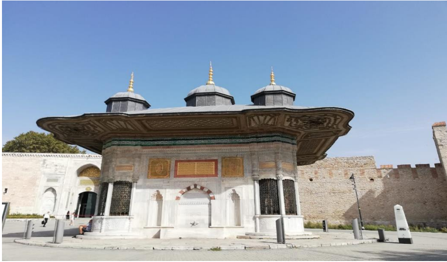
Resim 18: III. Ahmet Çeřmesi ve Topkapı Sarayı

Bu kubbelerin tam ortasında dört kubbeden büyük bir adet daha kubbe yer almaktadır. Bu kubbe ile toplamda beř adet kubbesi olan