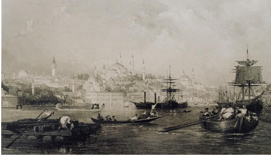
Resim 2: Haliç ađzından İstanbul (Thommas Allom XIX. yy.)

Öntuđ, M. M. ve Soysal, M. (2020, Ekim). Gezinlerin gözünden gravürlere yansıyan XVIII ve XIX. yüzyıl İstanbul şehir yapıları ve günümüz karşılařtırması. Karatay Sosyal Arařtırmalar Dergisi , (5), 85-112.