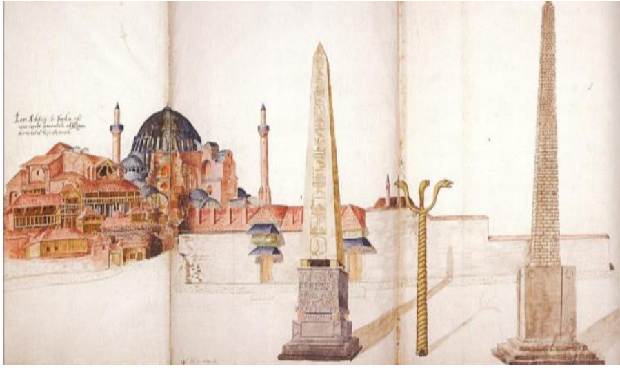
Resim 4: Hipodrom (Lambert de Vos'a atfedilen eser XVI. yy.)

İstanbul'un fethiyle Osmanlı yönetim merkezi hâline gelen İstanbul'u ziyarete gelen Tournefort, hipodromu řu sözlerle anlatır: İmparator Severus zamanında yapımının başlatıldığı ancak Constantinus döneminde tamamlanabilen, boyu dört yüz genişliği yüz adımdan oluşan bir alan olduğunu, gösterilerin ve at yarışlarının burada yapıldığını Türklerin ismini kendi dillerine çevirdiğini dile getirmiştir (Tournefort, 2013, s. 40).