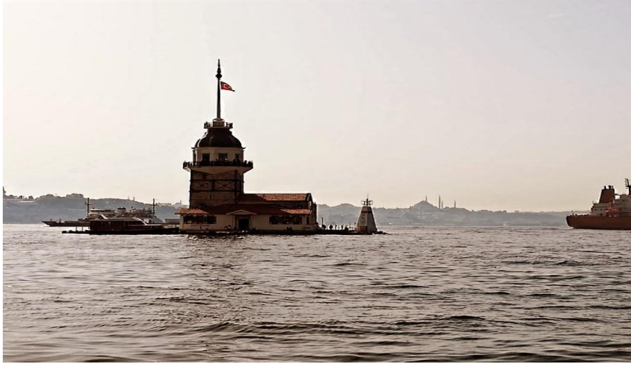
Resim 12: Kız Kulesi

Öntuđ, M. M. ve Soysal, M. (2020, Ekim). Gezinlerin gözünden gravürlere yansıyan XVIII ve XIX. yüzyıl İstanbul şehir yapıları ve günümüz karşılařtırması. Karatay Sosyal Arařtırmalar Dergisi , (5), 85-112.