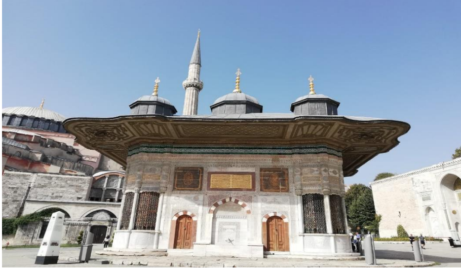
Resim 16: III. Ahmet Çeşmesi, Ayasofya ve Topkapı Sarayı

Sarayı'ndan hareket hâlinde çıkan at figürleri oldukça gerçekçidir ve gravüre canlılık katmıştır. Gravürlerde çeşme üzerinde bulunan çok sayıda motif ve işleme aktarılmaya çalışılmıştır.