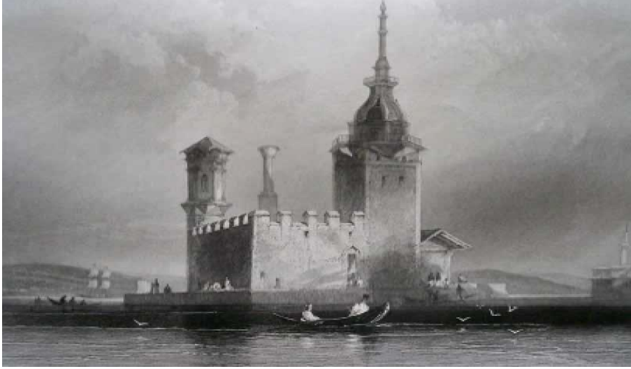
Resim 11: Kız Kulesi (Bartnett XIX. yy.)

Bartnett'e ait (Resim 11) kompozisyonun sađ kısmında bulunan yapı ve minarenin görüntüsüyle sanki karadan birbirine bađlanmış gibi görünmektedir. Kıyıda denize dođru bir çıkıntı gibi görünen kız kulesi birbirine çapraz konumda inşa edilmiş biri büyük biri küçük iki kulenin varlığı göze çarpmaktadır. İki sanatçının da kendi tasvir ve üslup anlayışlarını gravürlerine aktardıkları anlaşılmaktadır.