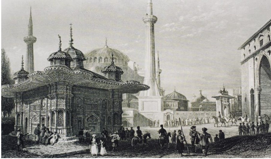
Resim 14: Bâb-ı Hümâyün, Ayasofya ve III. Ahmet Çeřmesi (William H. Bartlett)

Bartlett'e ait resimde (Resim 14) Topkapı sarayı giriři, Ayasofya ve III. Ahmet Çeřmesi bir arada görölmektedir. Kompozisyonun ana unsurunu oluřturan III. Ahmet Çeřmesi üzerinde bulunan kubbelerde, diđer gravürlerde olmayan bir detay göze çarpmaktadır (Resim 15). Bu detayda diđer gravürlerde kubbe üzerindeki âlemde hilal sembolü varken Bartlett'e ait gravürde hac iřareti resmedilmiřtir. Gravürde çeřmenin hemen arkasında beliren Ayasofya'nın camiye çevrilmesi batıda büyük bir hayal kırıklığı oluřturmuřtur. Howard Ayasofya'nın Türklerin eline çekmesinin verdiđi rahatsızlıđı řu sözlerle dile getirmiřtir: İnsan düşünüyor, Ayasofya kaç farklı name ile yankılandı, Latoida'ya rahmet, Meryem Ana'ya rahmet ve minareden yükselen ezan sesi, o ezan sesi daha ne kadar sürecektir. Ayasofya ilelebet Türklerde mi kalacak? Batı bu duruma göz mü yumacak (Howard, 1978, s. 31). XIX. yüzyılda yapılmıř olan bu gravürde de aslında batı halkının hâlâ İstanbul'un İslam sancaktarlıđını yapmasının kabul edilmediđi ve deđiřtirmek istedikleri gösterilmiřtir. Günümüzdeki (Resim 18) kubbe üzerindeki âlem geçmiřin aksine daha farklı bir dizayna sahiptir. Bartlett çeřmeyi o kadar geniř bir açıdan çizmiřtir ki normal řartlarda bakıldıđında sadece üç kubbenin göröldüđü yapıda, üç köře ve ortada bulunan büyük kubbeyi de görüp gravüre aktarmıřtır.