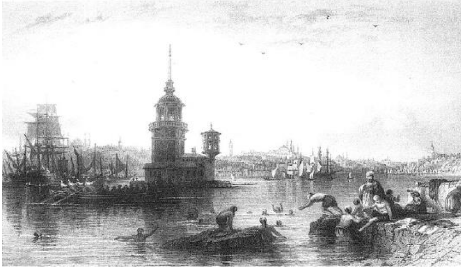
Resim 10: Kız Kulesi (Thomas Allom XIX. yy.)

Allom'a ait (Resim 10), Üsküdar tarafından çizilmiř olan gravürde Osmanlı tebaasının serinlemek için kayalık aktarılan alandan bođazın sularına girdiđi görülmektedir. Oldukça hareketli figürlere yer verilen gravürde yoğun bir deniz trafiđi göze çarpmaktadır. Deniz üzerinden resmedilen ve hemen hemen her gravürde rastladığımız cami silüetlerine bu gravürde de yan unsur olarak rastlıyoruz.