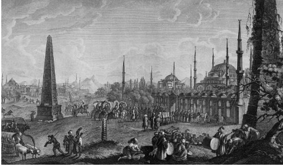
Resim 5: Hipodrom (Gavrila Sergejev')

Öntüđ, M. M. ve Soysal, M. (2020, Ekim). Gezinlerin gözünden gravürlere yansıyan XVIII ve XIX. yüzyıl İstanbul şehir yapıları ve günümüz karşılařtırması. Karatay Sosyal Arařtırmalar Dergisi , (5), 85-112.