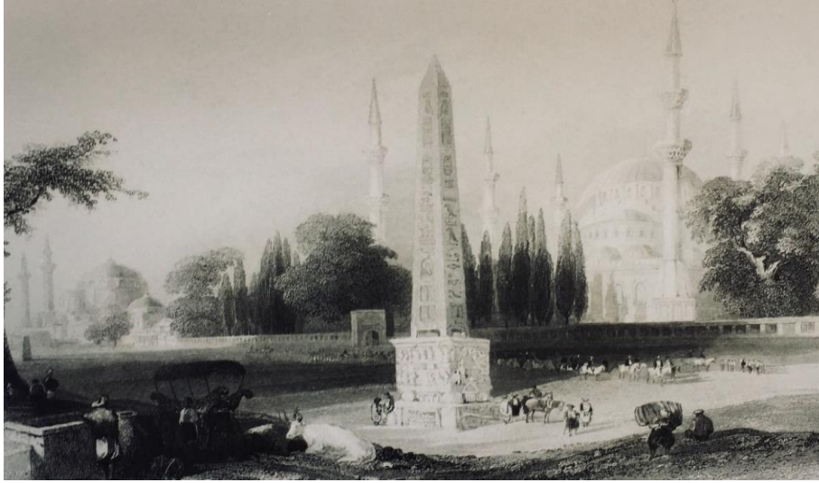
Resim 6: At meydanı (William Henry Bartlett XIX. yy.)

Gavrila'nın gravürünün aksine (Resim 5) Bartlett'e ait (Resim 6) gravür daha sakin ve hareketsiz bir günde resmedilmiřtir. Osmanlı halkının gündelik yařantısı hakkında izler taşıyan kompozisyonda gündelik iřleriyle uğrařan ve yine yük taşıyacak bir hayvanı olmadıđı için yükünü sırtında taşıyan bir figür yer almıřtır. Dikilitaşın etrafında yorgunluđunu gideren ve sohbet eden figürlere yer verilmiřtir.