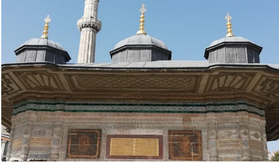
Resim 17: III. Ahmet Çeřme Kubbesi

Öntuđ, M. M. ve Soysal, M. (2020, Ekim). Gezinlerin gözünden gravürlere yansıyan XVIII ve XIX. yüzyıl İstanbul Őehir yapıları ve günümüz karşılařtırması. Karatay Sosyal Arařtırmalar Dergisi , (5), 85-112.