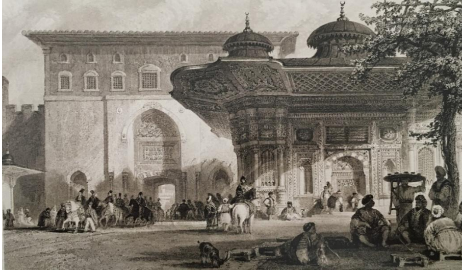
Resim 15: Bâb-ı Hümâyûn önündeki III. Ahmet Çeşmesi (Thomas ALLOM XIX. yy.)

Kompozisyonun diğeri öğelerine bakılacak olursa sağı tarafta Topkapı sarayı kapısı resmedilmiştir. At üzerinde saraydan çıkışın resmedildiğı bu gravürde (Resim 14) geçişi izleyen figürlerin başlarının öne eğik bir şekilde olduğı ve saray erkânına geçiş töreninde halkın sayğı duyduğı gösterilmeye çalışılmıştır. Diğeri taraftan çeşme etrafında toplanan insanların gündelik yaşam şekilleri ve giysileri hakkında da bilgiler aktarılmıştır. Çeşmenin üzerinde hatla yazılmış olan kasidede gravürlerde okunmasa da belirgin bir şekilde görülmektedir.