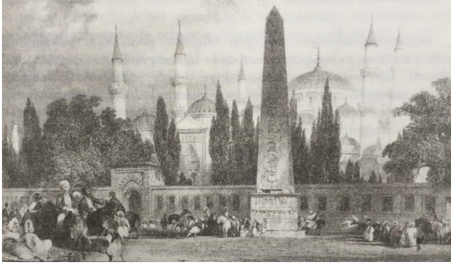
Resim 7: Sultan Ahmet Camii meydanı ve Dikilitaş