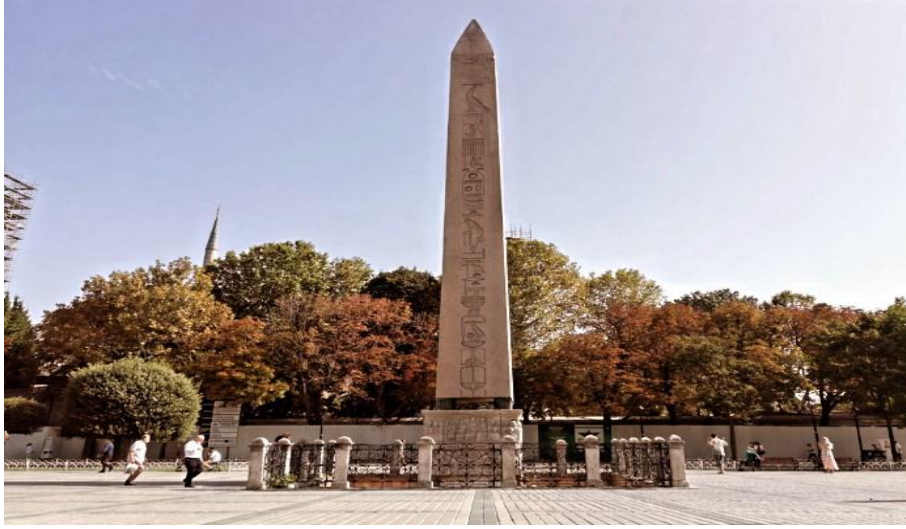
Resim 9: Dikilitaş

Öntuğ, M. M. ve Soysal, M. (2020, Ekim). Gezinlerin gözünden gravürlere yansıyan XVIII ve XIX. yüzyıl İstanbul şehir yapıları ve günümüz karşılařtırması. Karatay Sosyal Arařtırmalar Dergisi , (5), 85-112.