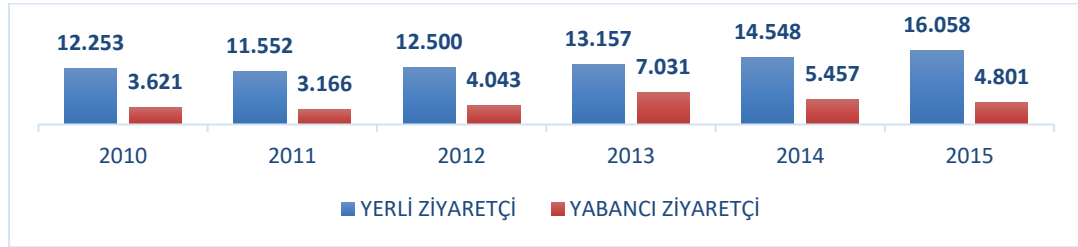
Tablo 1: 2010- 2015 Yılları Arasında Yerli ve Yabancı Ziyaretçi Dağılımı

Kaynak: http://www.catalhoyuk.com/sites/default/files/media/pdf/RAPOR_2016.pdf