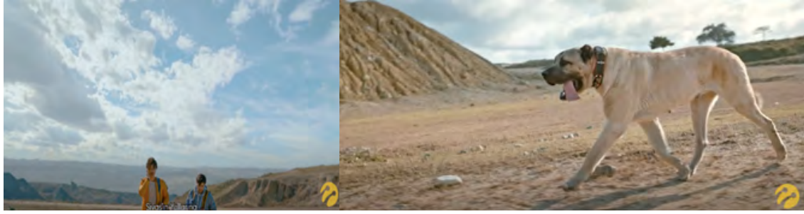
Tablo 1: Görsel 1’de Yer Alan Göstergeler