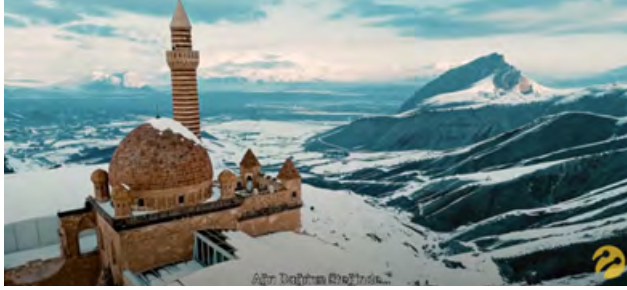
Tablo 3: Görsel 3'te Yer Alan Göstergeler