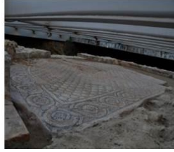
Şekil 8. Z binası girişinin mozaik zemi, MS 5. yy ortası (URL-2, 2020)

Antakya Müze Oteli, Roma İmparatorluğu döneminde dünyanın dördüncü gelişmiş şehri olarak bilinen Antakya'da yer almaktadır. Otel, Hıristiyanlar için önemli yeri olan St. Pierre Kilisesi'ne çok yakın bir yerde bulunmaktadır. 2009 yılında, bir otel inşa etmek isteyen bir yatırımcı, otel projesi için bu alanda kazıya başlamıştır. Kazıya başlandığında alanda önemli arkeolojik kalıntılar bulunmuştur. Kültür ve Tabiat Varlıklarını Koruma Kurulu yatırımcıdan arkeolojik kazı başlatmasını istemiştir. Kazı sürecinde çalışmak üzere arkeologlar, sanat tarihçileri, restoratörler ve mimarlardan oluşan bir uzman grubu oluşturulmuştur. Uzman grup tarafından ortaya çıkarılan arkeolojik kalıntılar, alanda otel inşasını imkânsız hale getirmiştir (Şekil 9). Bu durum, geleneksel otel tipolojisini bozarak, arkeolojik eserlerin sergileneceği bir kamu müzesinin otele entegre edilme fikrini ortaya koymuştur (URL-3, 2020).