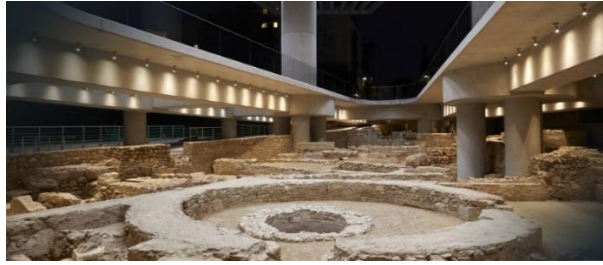
Şekil 4. Akropolis Müzesi'nin altındaki arkeolojik buluntular (URL-2, 2020)

Arkeolojik buluntular, MÖ 4. yy'dan 12. yy'a kadar yaşanmışlıkları göz önüne sermektedir. Arkeolojik kalıntılar içerisinde sokaklar, konutlar, hamamlar, atölyeler ve mezarlar bulunmaktadır (Şekil 5-8). Kalıntıların arasında en iyi korunanlar geç antik döneme ait olanlardır (URL-2, 2020).