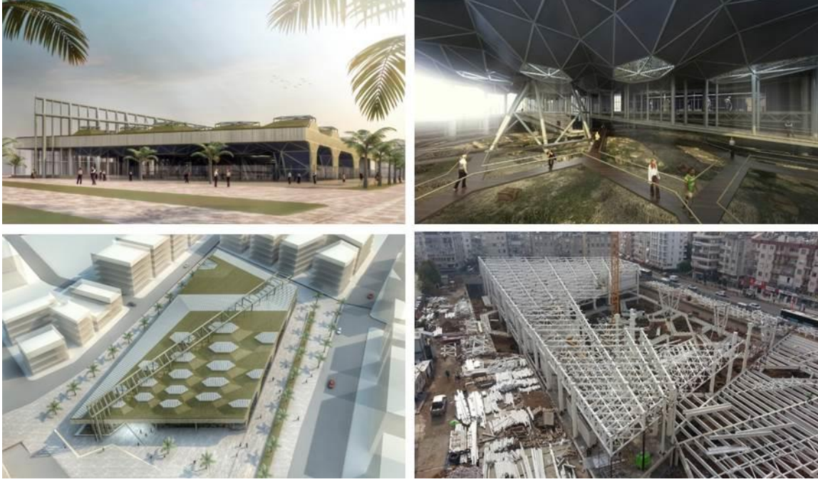
Şekil 12. Antalya Nekropol Alanı Kültür ve Ticaret Merkezi Projesi (URL-6, 2020)

Antalya Nekropol Alanı Kültür ve Ticaret Merkezi, Tarihi ve Kültürel Mirası Koruma Proje ve Uygulamalarını Özendirme Yarışması'nda 2018 Yılı Metin Sözen Koruma Büyük Ödülü'nü hak etmiştir. Proje, arkeolojik mirasın çağdaş çözümlerle kent hayatı içine entegre edilen tasarım anlayışı ve kent içindeki koruma-gelişim anlayışının dengeli bir biçimde kurulduğu için bu ödüle değer bulunmuştur (URL-7, 2020). Bu projeye birlikte