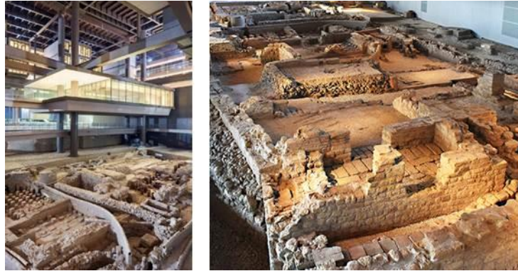
Şekil 11. Roma Hamamları (URL-5, 2020)

2008 yılında, Antalya Büyükşehir Belediyesi tarafından 2005 yılında düzenlenen Doğu Garajı ve Halk Pazarı yarışmasının inşaat kazıları başlandığında, alanda Roma dönemine ait Nekropol keşfedilmiştir. Sürpriz olarak ortaya çıkan nekropol, projeyi tamamen değiştirmiştir. Bunun üzerine koruma prensipleriyle bir Nekropol Müzesi tasarlanmıştır. Müze, arkeolojik kalıntıları doğal etmenlerden koruyan bir örtü olarak tasarlanmıştır (Şekil 12). Ayrıca, müze Nekropol boyunca gezinmeyi sağlayan yürüyüş yollarına ve galeri mekanlarına sahip olacak şekilde kurgulanmıştır (URL-6, 2020). Müzenin üst örtüsüne ait taşıyıcılar alanda bulunan kalıntılara zarar vermeyecek şekilde yerleştirilmiştir. Nekropol alanının çelik konstrüksiyon görüntüsü yerine yeşil bir çatı görüntüsü oluşması için çatısı bitki ile kaplanmıştır (URL-8, 2020). Kentsel bellekte önemli bir yere sahip olan Doğu Garajı