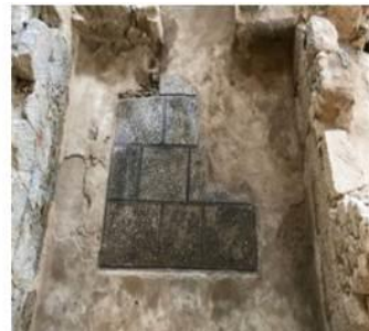
Şekil 6. Evin andronu, MÖ 5. yy (URL-2, 2020)