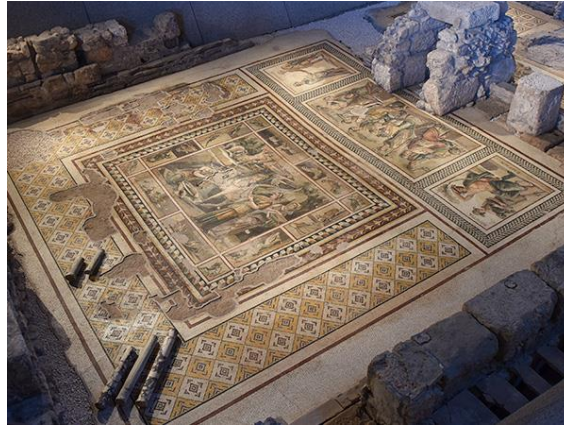
Şekil 10. Pegasus Mozaïği (URL-5,2020)

mekanlarındandır. Hamam sakinleri ılık ve soğuk su odalarında (Tepidarium ve Frigidarium) bir araya gelerek sosyalleşiyorlardı (URL-5,2020).