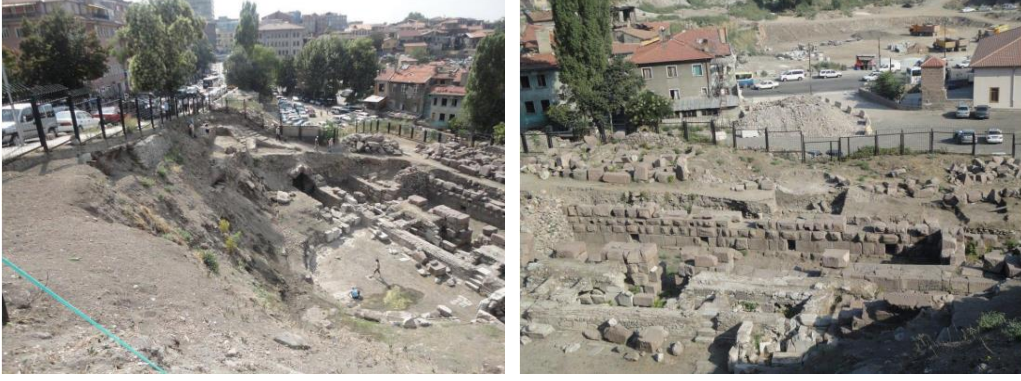
Şekil 1. Antik roma tiyatrosu ve çevreyle ilişkisi (Demirdağ, 2017)

Kentsel arkeolojik alanların korunmasında birçok sorunla karşılaşıldığı gözlemlenmektedir. Kent içinde yapılaşma tehdidi ile karşı karşıya kalan arkeolojik alanlar ortaya çıkmaktadır. Kentsel arkeolojik alanlar, zamanla kentten kopuk niteliksiz alanlara dönüşmektedir. Bu arkeolojik alanların kent içindeki varlıklarına devam etmesi gerekmektedir. Bu anlamda dünyadan Atina Yeni Akropol Müzesi; ülkemizden Antakya Müze Otelii ile Antalya Nekropol Alanı Kültür ve Ticaret Merkezi bu sorunlara yeni bir yaklaşımla çözüm aradığı için incelenmiştir.