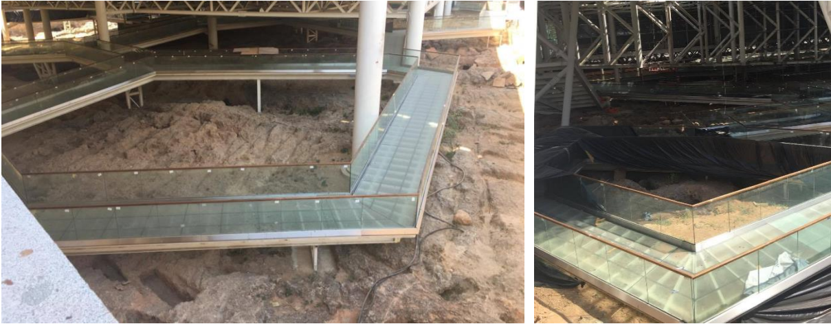
Şekil 13. Nekropol Alanı (Göküz, 2020)

hem kentte yaşayanlar hem de turizm açısından bir çekim noktası oluşturulmuştur. Nekropol alanında ortaya çıkarılan mezarlar 3 tipte gruplandırılmıştır (Şekil 13). Bu mezar tipleri; sandık mezarlar, khamosorion mezarlar ve dromoslu oda mezarlardır (Tosun ve Akman, 2011).