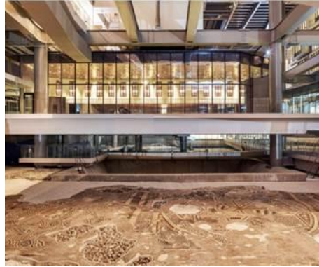
Şekil 9. Antakya Müze Oteli (URL-3, 2020)

Geleneksel otel tasarımında çoğunlukla zemin katta yer alan restoran, gece kulübü, spor salonu ve yüzme havuzu gibi ortak alanlar çatı katına yerleştirilmiştir. Alt katta, buluntuların yaklaşık 15 m yukarısında, çelik kirişlerle bir ızgara yapısı inşa edilmiştir. Prefabrik otel odası modülleri, bu sistemin üzerine aralıklarla yerleştirilmiştir. Odaların hemen altında, arkeolojik kalıntıların yaklaşık 10 m yukarısında, otel lobisi tasarlanmıştır. Her katta devam eden mekanlar arası akışkanlık ve geçirgenlik ile arkeolojik sit alanına çeşitli görsel bağlantılar sağlamıştır (URL-3, 2020). Kalıntıların birkaç metre üzerinde, yapıyı şehir merkezine bağlayan bir arkeoloji müzesi tasarlanmıştır. Müzede asma köprü ve rampalardan oluşan sirkülasyon ağı kalıntılara göre düzenlenmiştir. Müzede ziyaretçiler tarafından herhangi bir fiziksel temas olmaksızın kalıntıların yakın mesafeden izlenebilmesi sağlanmıştır (URL-3, 2020).