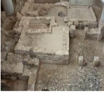
Şekil 7. Küçük bir özel hamam kalıntısı, MS 2. yy (URL-2, 2020)