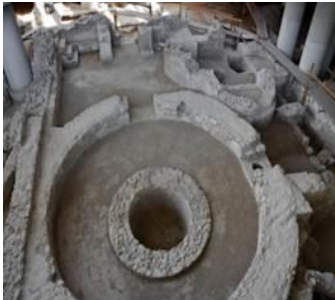
Şekil 5. Üç nişli oda ve E yapısının dairesel kule holü, MS 6. yy başı (URL-2, 2020)