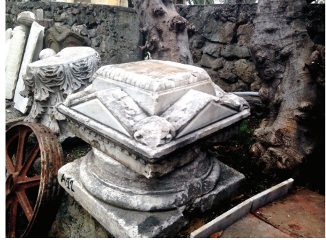
Fot. 9: Anıtın tepelik bölümünün bezemesiz diğer yüzleri

Ülkemizde bulunan az sayıdaki örnekten biri olan mezar anıtı üzerindeki çocuk kabartmaları küçük yaşta ölen bir çocuk için yaptırılmış olduğunu akla getirmektedir. Genellikle genç yaşta ölen kişilerin mezar anıtlarında kullanılan çocuk figürlerinde Hristiyan inancının yerleşik sembollerinden arındırılmış ya da gündelik yaşamları içinde oyun oynarken betimlendiği bir biçim dili sıkça tercih edilmiştir. Ele aldığımız kabartmalarda sadece bir yüzde kız çocuğu, diğer üç yüzde ise erkek çocuğu figürleri betimlenmiştir. Bu durum anıtın birden çok çocuk için mi yapıldığını yoksa çocuk mezarlarının bulunduğu bir alan için yerleştirilmiş bir anıt olduğunu düşündürse de ne yazık ki elimizde bunları doğrulayacak bir kanıt bulunmamaktadır. Ama bu yüzyılda yapılmış her mezar anıtında bir sembolizm aramanın da çok doğru olmadığı söylenebilir.