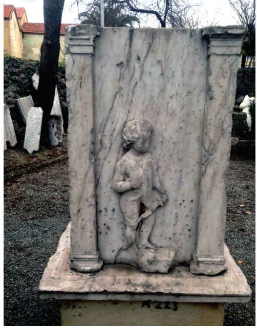
Fot. 7: Elinde sapan tutan çocuk kabartması