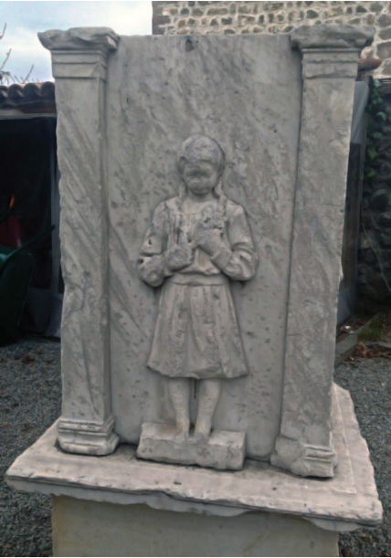
Fot. 4: Kız çocuğu kabartması