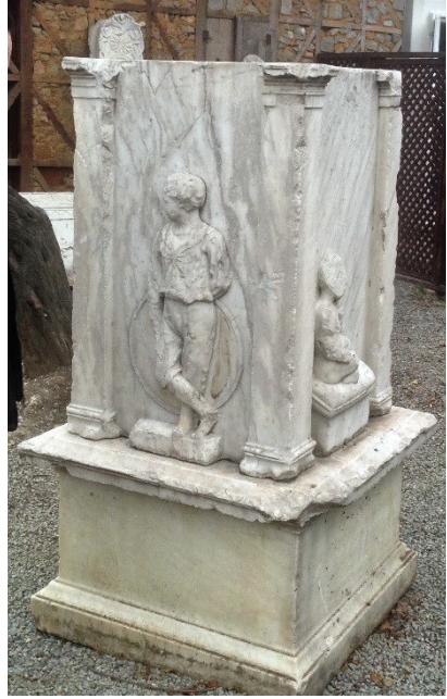
Fot. 3: Mezar anıtının genel görünümü.