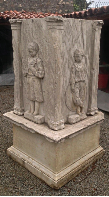
Fot. 2: Trabzon Aya Sofya Kilisesi bahçesindeki mezar anıtının genel görünümü.