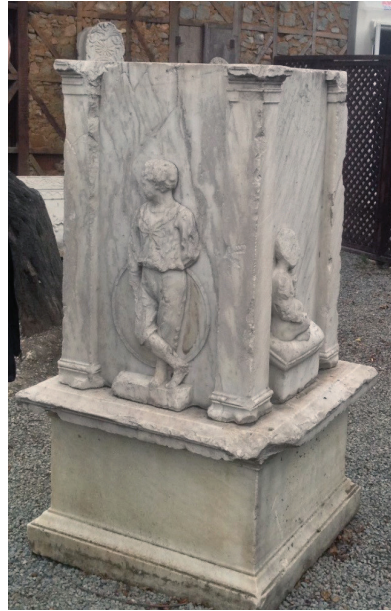
Fot. 5: Holahup tutan erkek çocuğu kabartması