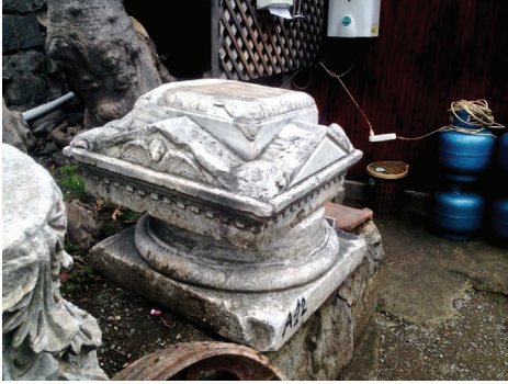
Fot. 8: Anıtın tepelik bölümünün melek kabartmalı ön yüzü

19. yüzyılın ikinci yarısında yapılmış olmalıdır. Üzerinde herhangi bir sanatçı imzası ve aile adının bulunmaması ithal edildiğini düşündürmektedir. 19. yüzyılın ikinci yarısında İstanbul'a Avrupa ve Amerika'dan çok sayıda mezar anıtı getirilmiştir. İthal edilen anıtlar üzerine yerel mezar ustalarının zaman zaman sadece kitabe ekledikleri ya da kitabelik kısmının boş bırakıldığını daha önce yaptığımız araştırmalarımıza dayanarak söyleyebiliriz 19 . Anıtın işçiliği, çocuk kabartmalarının stili ve Carrara mermeri kullanılması da bize İtalya'dan getirilmiş olduğunu düşündürmektedir 20 . Beyaz zemin üzerine açık gri damarlı Carrara mermeri Toskana bölgesinde Antik dönemden beri kullanılan günümüzde de oldukça az çıkarılan pahalı bir malzemedir. Bu nedenle yapıldığı dönemde de anıtın maliyetinin yüksekliği gelir durumu iyi bir kişi veya aile tarafından sipariş edildiğini akla getirmektedir.