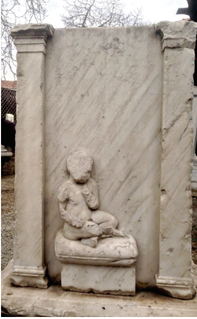
Fot. 6: Oturan çocuk kabartması