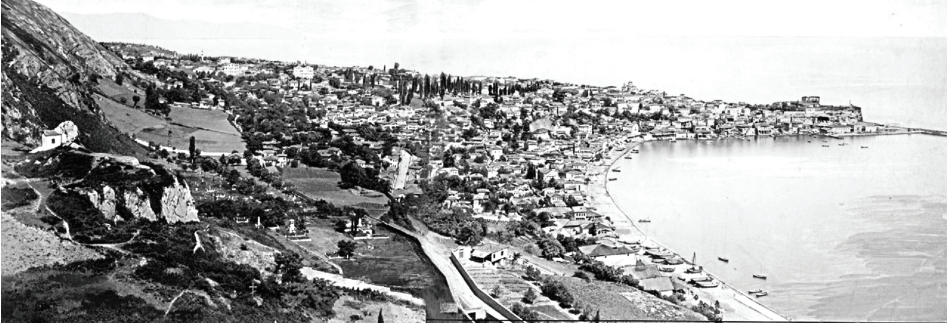
Fot. 1: Minthron Tepesi'nden (Boztepe) Trabzon manzarası. (Millet, 1893.)