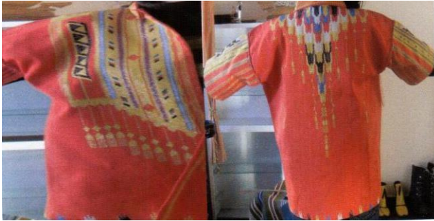
Şekil 5. Kırmızı aba