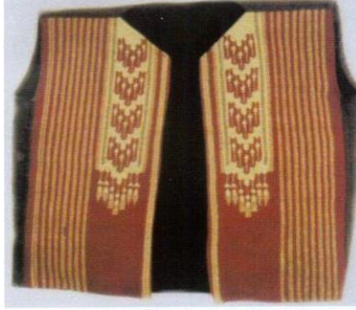
Şekil 10. Aba kumaştan yapılan yelek