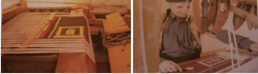
Şekil 1. İlikli kilim dokuma tekniği ile üretilen aba dokuma

Günümüzde ise aba dokuma iki gücülü tezgahta Bezayağı dokuma tekniği ve düz tahar kullanılarak yapılmaktadır. Desenler dokuma esnasında ilikli kilim dokuma tekniği kullanılarak oluşturulmaktadır. İlikli kilim dokuma tekniği kullanılarak üretilen aba dokumalara örnek Şekil 1’de verilmiştir