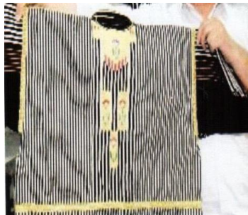
Şekil 7. Taşçı abası

Kısa boylu abalar olup beyaz, çizgili, motifli olarak dokunurlar. Geçmişte tamamıyla yünden dokunan bu abalar günümüzde yün ve pamuktan dokunmaktadır. Taş ustaları geçmişte abayı sağlamlığından dolayı taş taşırken kullanmışlardır.