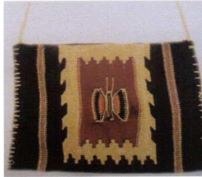
Şekil 9. Tütün kesesi

Ayrıca aba dokumadan tütün kesesi de yapılmaktadır. Tütün kesesi yapımında aba dokumanın kenarları tığ işi ile birleştirilir. Tütün kesesi dokunurken kelebek motifi kullanılmıştır. Günümüzde aba dokumalar siparişe göre yelek yapılarak da değerlendirilmektedir