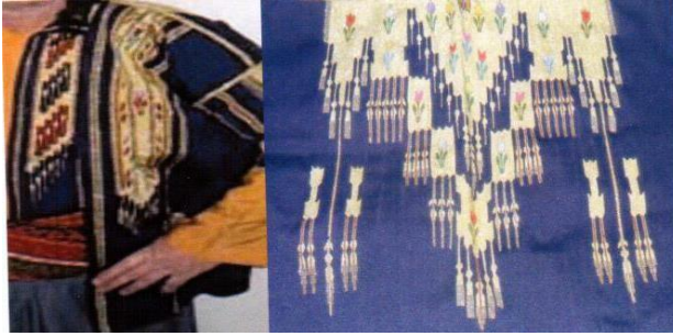
Şekil 4. Lacivert aba