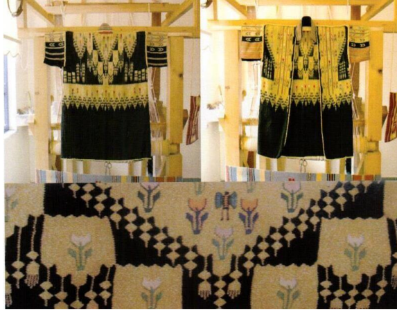
Şekil 8. Humus abası

Siyah renkte olup ön ve arka bedene kadar bol motifli, belden aşağı kısmı ise düz olarak dokunan ve boyu diz hizasına kadar uzanan bir aba çeşididir. Üzerindeki her desene “sandıklı” denilmektedir. Bir abada dokuz tane veya daha fazla sandıklı varsa bu abayı zengin ağalar giymektedir. Fakat sandıklı sayısı dokuzdan az ise köylü halk düğün ve merasim gibi özel günlerde giymektedir. Humus abası giyildiğinde bele beyaz ya da siyah yün kuşak bağlanır (Künç,2012).