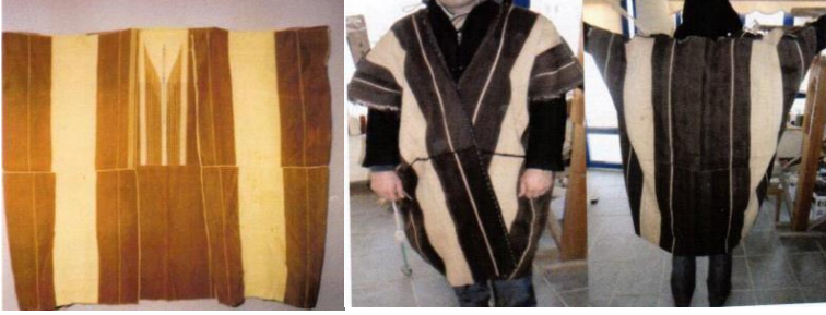
Şekil 3. Yün aba (boz aba)