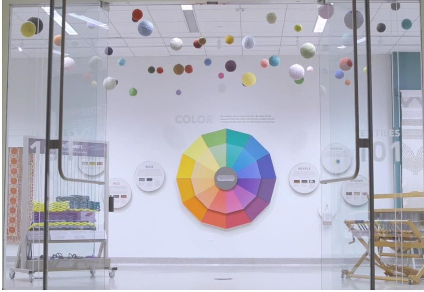
Resim 7. Amerika’da The George Washington University Textile Museum’da uygulama atölyesi (URL-5)

İpekçilik geleneğimiz, tarihi, malzemesi, iplikçileri, boyacıları, meslek örgütlerini, yasalarını, geleneksel dokumacıları özelliklerini kısaca konuyu sadece tarih açısından değil bilim, sanat ve toplum boyutlarını içeren ipek müzesi olarak düzenlenecek bir han ile geleceğe daha sağlıklı aktarılır.