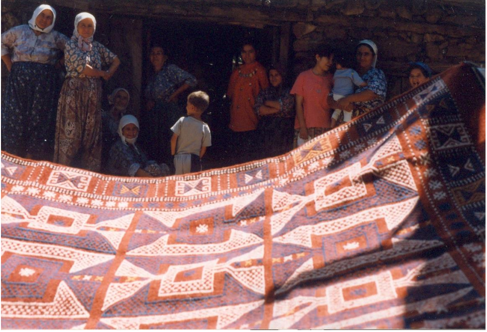
Resim 1. Çanakkale Ayvacık Baharlar Köyünde dokunmuş “Ayı Kulağı Sili (Zili)” örneği ve köy halkı

Türk toplumunda eskiden aile sanatı olan geleneksel el dokumacılığı, kültürel ve görsel kimliklerinin baş yapıtları oldukları için yerel, ulusal ve evrensel değerler ile incelenmeleri gerekmektedir. Kısıtlı malzeme ve teknik olanakları ile sonsuz çeşitlilikte dokumanın oluşturulması, yaratıcılık yönünden değerli bir ölçüttür.