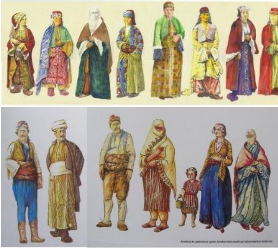
Resim 6. Osmanlı döneminde Anadolu insanının giyimi (Çizimler Aydın Uğurlu, 1990)

Saray giysilerinin sergilendiği Topkapı Sarayı Müzesinde Yörük ve Türkmen giyiminden bahsedilmemiştir. Bir dönem Topkapı Sarayı Müdürlüğü Gülhane Parkı Alay Köşkü'nde sergilenen Kenan Özbel'in Anadolu'dan derlediği "Halk Sanatları Koleksiyonu" günümüzde kaldırılmıştır. Halbuki sarayda çalışanların tüm giysileri de ipekli olanlar hariç halkın giydiğinden farklı olmamıştır.