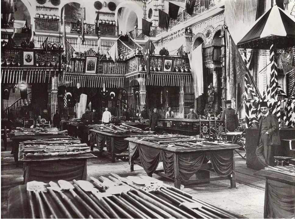
Resim 2. Aya İrini Eski Silah Müzesi (URL-2)

Konuyla ilgili olarak bazı ülkelerde isim yapmış tekstil müzeleri yazılırsa, listenin uzayıp gittiği görülmektedir. The George Washington University Museum and The Textile Museum, Textile Museum of Canada-Toronto, Textile Museum-Tilburg, Fashion and Textile Museum-London, Carpet and Kilim Museum Textile Museum-Jakarta, Mississippi Valley Textile Museum, Newtown Textile Museum, Amano Pre-Columbian and Textile Museum, Historic Costume and Textile Museum Kansas University, Shetland Textile Museum, Southeastern Quilt and Textile Museum, Textilmuseet (The Textile Museum) Herning, Kurdish Textile Museum-Erbil, Kawashima Textile Museum-Kyoto, National Textile Museum, Kuala Lumpur-Malaysia, Helmshore Mills Textile Museum, The Textile Museum-Blönduos-İzlanda, Textile Museum-Thimphu-Butan, Calilo Textile Museum, Krefeld Textile Museum gibi müzeler, tekstil müzesi olarak hizmet vermektedirler. Ulusal müzenin olmadığı ender ülkelerden biri olan Türkiye’de, ulus kimliğini oluşturmuş dokuma geleneğimiz, alanındaki