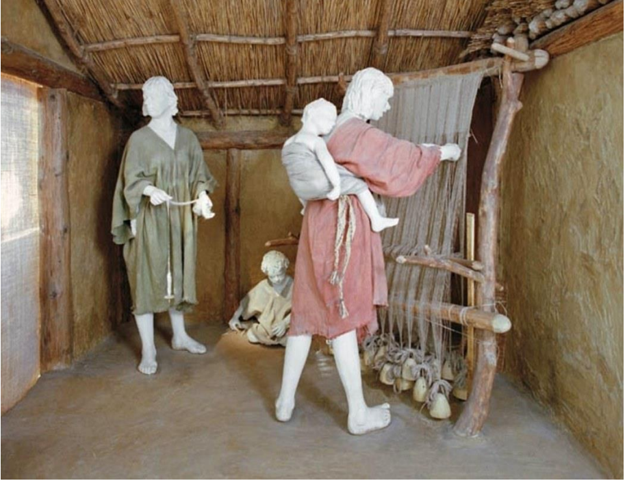
Resim 3. Penelope tezgahının rekonstrüksiyonu, Deutsches Museum Textil Bölümü, Münih, Almanya (URL-3)

Kültürel yaşantımızda önemli yer kaplayan geleneksel el dokumacılığı, manufakturacı, butik, tekstil eğitimi veren okullar ve ileri tekstil sanayimiz olmasına karşın, bu kuruluşlara kaynaklık etmesi gereken teknik ve sanat yönü ile bütünleşmiş eğitici bir tekstil müzesine gereksinim duyulmaktadır.