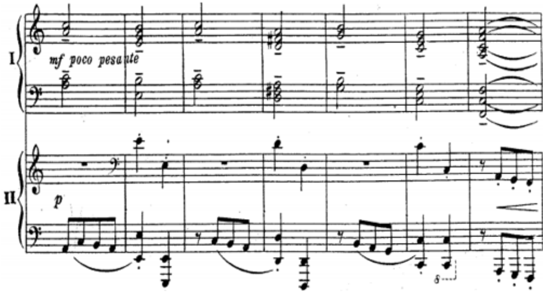
Şekil 11. S. Rahmaninov – Paganini'nin Bir Teması Üzerine Rapsodi Op.43 7. Varyasyon (1.-7. Ölçüler arası)

Eserin yedinci varyasyonunda Dies Irae teması, Paganini temasıyla birleşmiş olarak duyulur (Woodard: 1984, s. 58). Tema sakin bir koral stilde armonize edilerek yazılmıştır. Orkestra ise eserin ana temasını hafifçe duyurarak yatay çoksesli bir yapı oluşturur. Şekil 11'de incelenebilecek olan bu motif, yedinci varyasyon boyunca devam eder: