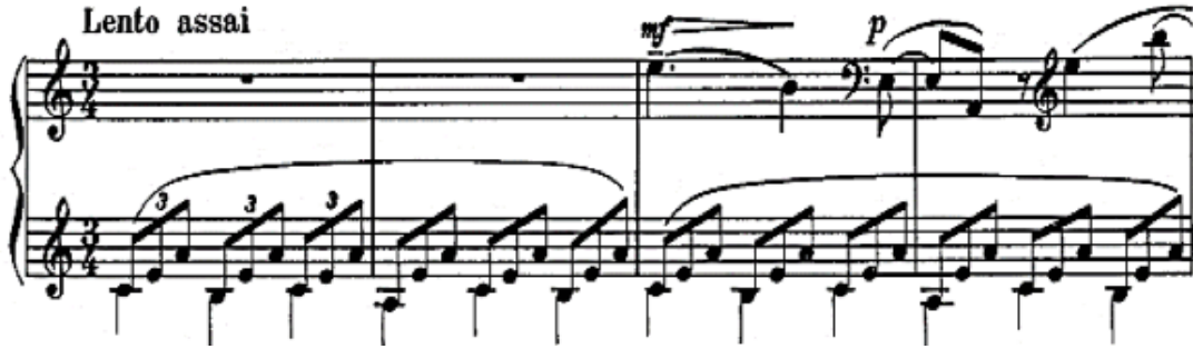
Şekil 5. S. Rahmaninov – Etude-Tableau Op.39 no.2 (1.-4. Ölçüler arası)

2 numaralı la minör etüt, dizinin en uzun parçasıdır. İtalyan besteci Ottorino Respighi tarafından orkestrasyonu yapılmış olan bu etüde besteci, "Deniz ve Martılar" adını vermiştir (Radiushina: 2008, s. 7). Şekil 5'te de incelenebileceği gibi Dies Irae motifi sol eldeki eşlik partisinde, uzun ve bağlı çalınması istenen cümlede çok belirgin şekilde öne çıkmaktadır.