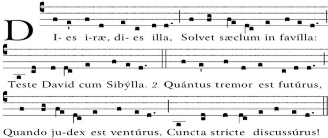
Şekil 1. “Dies Irae” teması

15. ve 16. yy’da yaşamış Engarandus Juvenis, Antoine Brumel ve daha sonra birçok Rönesans bestecisi bu geleneksel temayı missalarında çoksesli olarak alıntılanmışlardır. Romantik Dönem’de ise Hector Berlioz, Franz Liszt, Johannes Brahms, Pyotr İlyiç Çaykovski, Modest Musorgski ve Sergey Rahmaninov başta olmak üzere birçok besteci bu temadan alıntıları dini olmayan eserlerinde kullanmışlardır. Temanın anlamı ve mistik yapısı düşünüldüğü zaman bestecilerin bu motifi, karanlık ve gizemli bir etki yaratmak için kullandıkları düşünülebilir. 20. yy’da ise George Crumb, Krzysztof Penderecki gibi besteciler Dies Irae temasını kullanmıştır. Dies Irae teması The Shining filminin müziklerinde ve Sweeney Todd adlı müzikalde de kullanılarak, Klasik Batı Müziği alanının dışındaki türlerde de kendisine yer edinmiştir.