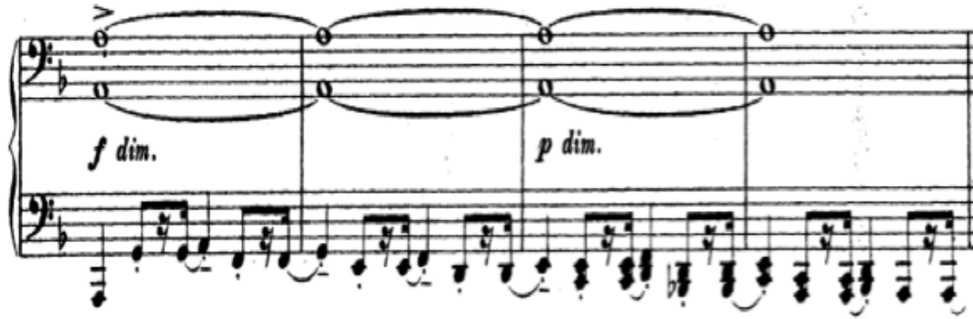
Şekil 2. S. Rahmaninov – 1. Piyano Sonatı 3. Bölüm (81.-84. Ölçüler arası)

Daha sonra tema çoksesli olarak, daha kararlı ve ısrarlı bir yapıda duyularak müzikal anlamda daha baskın bir karaktere dönüşür. Bununla beraber karmaşık polifonik bir yapıda ve kanon olarak duyulan tema , dört sesli yoğun bir piyano yazısıyla işlenir. Şekil 3'te bu yoğun çoksesli yapıyı incelemek mümkündür.