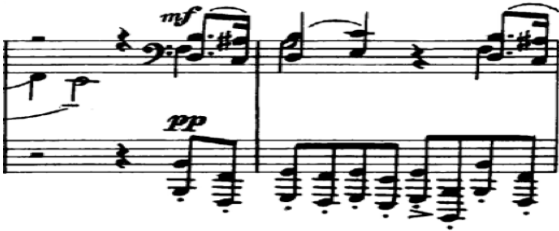
Şekil 10. S. Rahmaninov Moment Musical Op.16 no.3 (32. ve 33. Ölçüler)

Dies Irae teması, Moments Musicaux serisinin üçüncü parçasında bas partisinde, kalın seslerde ve staccato olarak yazılmıştır. Bu özellik eserin temasında geçmemekle beraber eşlik partisinde çok net bir şekilde ayırt edilebilmektedir. Pianissimo ve sekizlik, kısa notalardan oluşan bir yürüyüşte kullanılan motifin soğuk ve karanlık müzikal yapısı Şekil 10'daki 32. ölçüde incelenebilir.