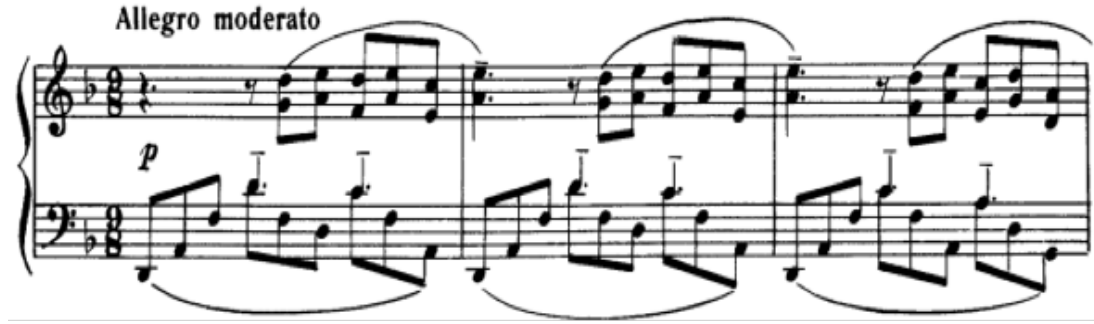
Şekil 7. S. Rahmaninov – Etude- Tableau Op.39 no.8 (1.-3. Ölçüler arası)

Bestecinin Dies Irae motifini temanın içine gizlenmiş olarak kullandığı örneklerden biri ise, Op.39 no.8 Etude-Tableau'sudur. Re minör tonda olan bu etüdün birinci temasındaki motif, ilk dinleyişte veya eserin notasına ilk bakışta göze çarpmayabilir. Sol eldeki eşlik partisinde ise Dies Irae motifinin yalnızca ilk iki notası alıntılanmıştır. Şekil 7'de, sağ el partisinde ikinci notadan itibaren, sol elde ise ikinci vuruştan itibaren bu motifin izleri incelenebilir. Sağ eldeki beşli ve altılı aralıklardan oluşan legato ve hafif piyano yazısı sayesinde tema yumuşak ve melodik olarak işlenmiştir.