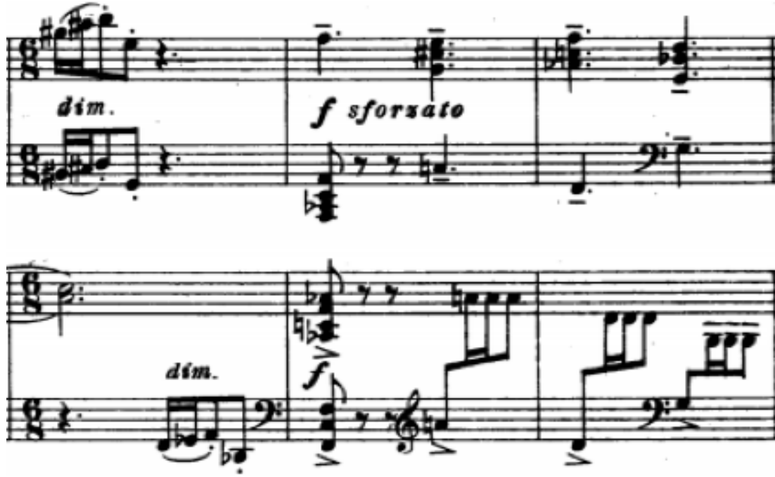
Şekil 15. S. Rahmaninov – İki Piyano İçin Senfonik Danslar Op.45, 3. Bölüm (265.-267. Ölçüler arası)

kullanılmıştır. İsviçreli ressam Arnold Böcklin'in "Ölümler Adası" isimli tablosu üzerine bestelemiş olduğu ve tabloyla aynı adı taşıyan Op.29 senfonik şiiri başta olmak üzere üç senfonisi "Çanlar" adlı korolu senfonik şiiri bestecinin Dies Irae temasını kullandığı senfonik örneklerin başlıcaları olarak gösterilebilir.