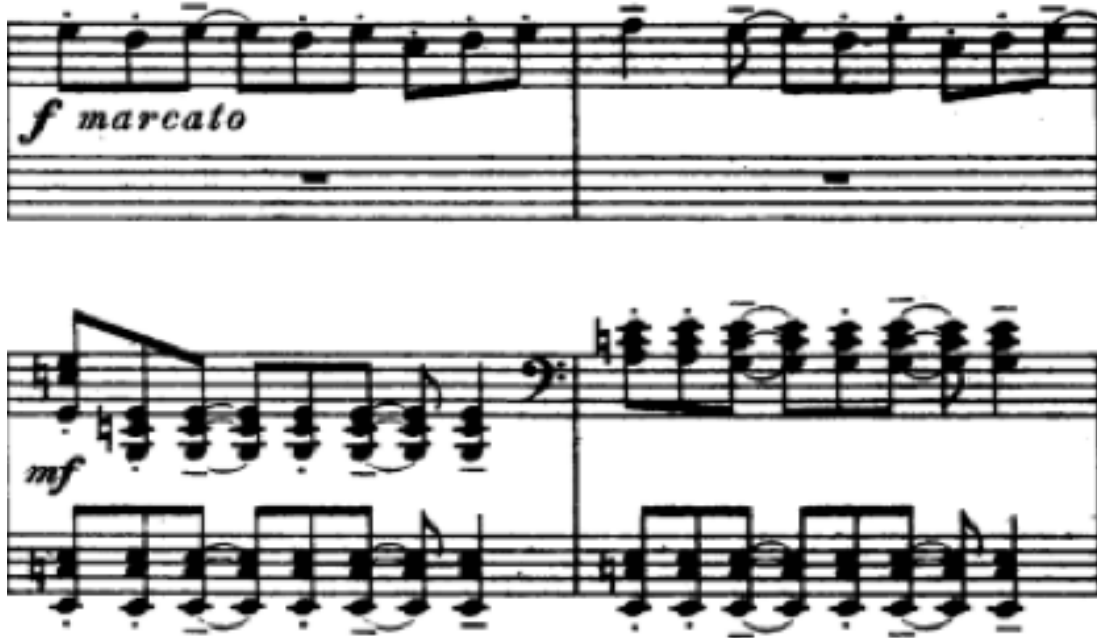
Şekil 14. S. Rahmaninov – İki Piyano İçin Senfonik Danslar Op.45, 3. Bölüm (93.-94. Ölçüler)

Senfonik Danslar'ın son bölümünde Dies Irae teması 93. ölçüde başlayan ve birinci piyanonun seslendirdiği ritmik temanın içerisine gizlenmiş olarak belirir. Aşağıdaki örnekte, birbirine bağlı olan üçüncü ve dördüncü sekizlik notalardan itibaren Dies Irae motifini incelemek mümkündür. Şekil 14'te görülebileceği gibi temanın içinde Dies Irae motifinin başlangıcı aynı zamanda tenuto işaretiyle belirtilmiştir yani özellikle tutarak ve belirterek çalınması istenmiştir: