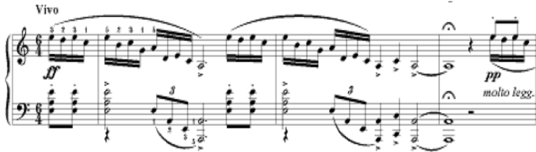
Şekil 8. S. Rahmaninov Prelüd Op.32 no.8 (1. ve 2. Ölçüler)

13 parçadan oluşan Op.32 eser sayılı prelüdlere Rahmaninov 1910 yılında tamamlamıştır. Bu prelüdlere sekizincisi la minör tonunda bestelenmiştir. Sergey Rahmaninov'un Dies Irae teması ile olan bir tezi bulunan Susan Jeanne Woodard'a göre bu prelüd, Franz Liszt'in Niccolo Paganini'nin solo keman için kaprisleri üzerine bestelemiş olduğu transkripsiyonların bir anımsatıcısıdır (Woodard: 1984, s. 72). La minör prelüdün tüm esere hâkim olan ana teması Dies Irae motifine üzerine kurgulanmıştır ancak hızlı onaltılık nota geçişlerinden oluşmakta ve ilk dinleyişte/bakışta net bir şekilde anlaşılabilir. Prelüdün ilk iki ölçüsünde onaltılık ve legato notalarla yazılmış olan motifi aşağıdaki örnekte incelemek mümkündür. Sol elde ilse, motifin tekrarlayan notalarını vurgulayan üç akor yer almaktadır. Bu üç akorun prelüdün ana temasının ilk motifini oluşturduğu, Şekil 8'de incelenebilir.