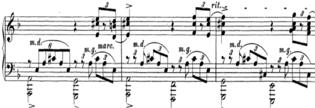
Şekil 4. S. Rahmaninov – 1. Piyano Sonatı 3. Bölüm (263.-265. Ölçüler arası)

Dies Irae motifi daha sonraki ölçülerde, bölümün doruk noktasını hazırlamak için kullanılmıştır. Şekil 4'te incelenebileceği gibi üçüncü bölümün gelişim bölmesini röpriz bölmesine bağlayan bu ölçülerde sağ elde Dies Irae motifinin yalnızca iki notasından oluşan bir armoni yürüyüşü yer alırken bas seslerde, motifin tamamı ikilik notalarla ve aksanlı olarak yer almaktadır.