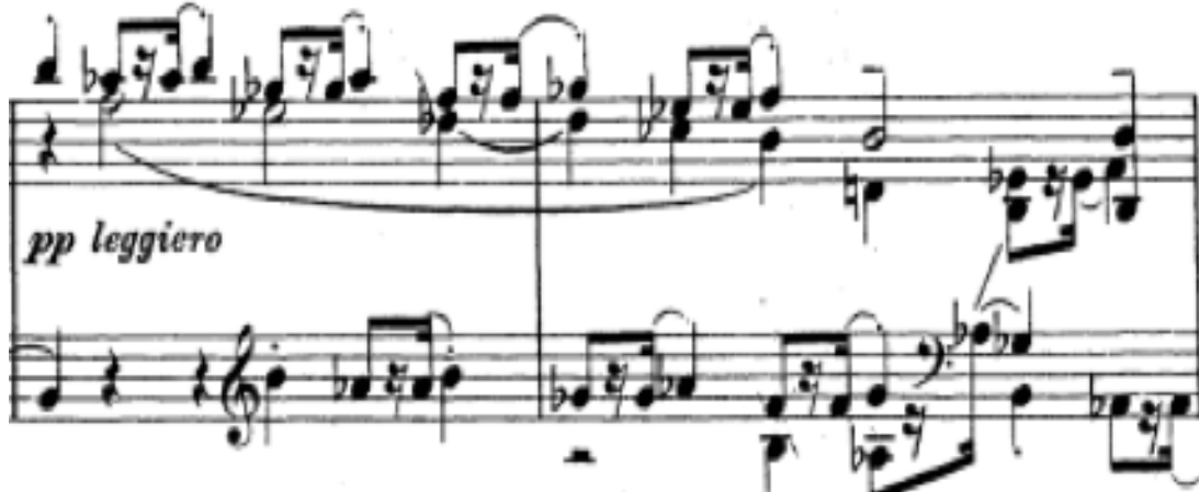
Şekil 3. S. Rahmaninov – 1. Piyano Sonatı 3. Bölüm (95.-96 Ölçüler)

Daha sonra tema çoksesli olarak, daha kararlı ve ısrarlı bir yapıda duyularak müzikal anlamda daha baskın bir karaktere dönüşür. Bununla beraber karmaşık polifonik bir yapıda ve kanon olarak duyulan tema , dört sesli yoğun bir piyano yazısıyla işlenir. Şekil 3'te bu yoğun çoksesli yapıyı incelemek mümkündür.