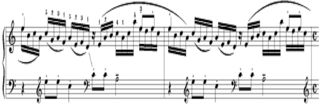
Şekil 9. S. Rahmaninov – Prelud Op.32 no.8 (4.-5. Ölçüler)

Prelüdün devamında ise, ilk iki ölçüdeki artikülasyon değiştirilmiş ve temanın tekrarlayan notaları (mi) staccato yazılarak özellikle belirtilerek çalınması istenmiş ve bu notalarla farklı bir tematik yapı kurulmuştur. Böylelikle Dies Irae motifi artık geri planda bırakılmıştır. Şekil 9'da sekizlik, staccato ve tekrar eden notalardan oluşan yeni cümle yapısı incelenebilir.