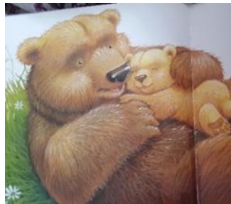
Resim 5. Resimlemede Yer Alan Kabul Görme Duygusuna Ait Jest ve Mimikler (Howarth, 2011)

Karakterlerin birbirlerine sarılması, şefkat ile bakması, birbirlerini öpmesi, herhangi bir şeyin kabul görmesi, birine/bir varlığa hayranlık duyulması Sevgi duygu kümesine ait jest ve mimikler olarak kabul edilmiştir. Sevgi duygu kümesini yansıtan resimler aşağıda verilmiştir.