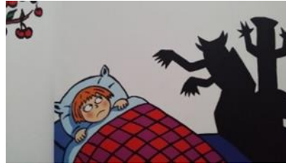
Resim 3. Resimlemede Yer Alan Huzursuzluk Duygusuna Ait Jest ve Mimikler (Satrapi, 2009)

Resimli öykü kitaplarında karakterlerin çeşitli durumlardan huzursuzluk duymaları, huzursuz, tedirgin, kaygılı ve korku dolu halleri Korku duygu kümesine ait jest ve mimikler olarak kabul edilmiştir. Aşağıda Korku duygu kümesini yansıtan resimlere yer verilmiştir.