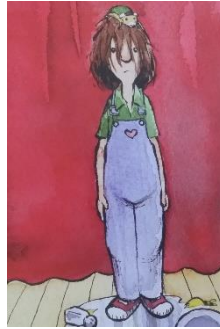
Resim 8. Resimlemede Yer Alan Hayal Kırıklığı Duygusuna Ait Jest ve Mimikler (Pett&Rubinstein, 2012)

Karakterlerin yapılan bir eyleme bağlı olarak pişman oldukları, kendilerini mahcup/utanmış hissettikleri ve özür diledikleri durumlar Utanç duygu kümesine ait jest ve mimikler olarak kabul edilmiştir. Utanç duygu kümesini yansıtan resimler aşağıda örneklendirilmiştir: