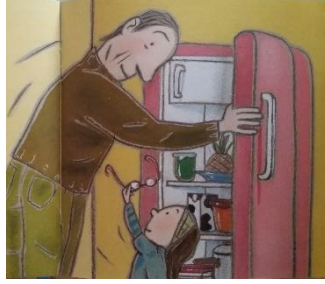
Resim 6. Resimlemede Yer Alan İyilik Duygusuna Ait Jest ve Mimikler (Norac, 2010)

Resim 6. (Norac, 2010, s. 17-18)'deki kız çocuk karakterinin gözlüğü uzatarak dedesine yardımcı olduğu ve bir iyilik yaptığı söylenebilir. Resimde İyilik duygusu alt kümesi yansıtılmaktadır.