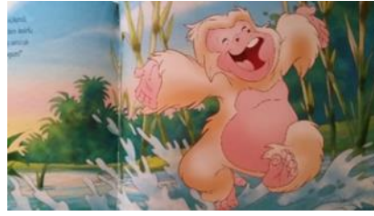
Resim 4. Resimlemede Yer Alan Sevinç Duygusuna Ait Jest ve Mimikler (Maldonado, 2011)

Resim 4. (Maldonado, 2011, s. 33)'deki maymun karakterinin suda dans ettiği ve neşe içinde güldüğü söylenebilir. Maymun karakterin jest ve mimikleriyle Sevinç duygu alt kümesini yansıtır niteliktedir.