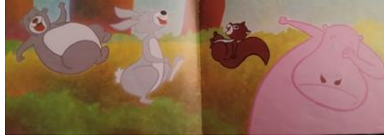
Resim 9. Resimlemede Yer Alan Küçümseme Duygusuna Ait Jest ve Mimikler (Oğuzkan, 2007)

Karakterlerin birbirleri ile alay ettikleri, küçümsedikleri, birinden/bir şeyden hoşlanmadıkları ya da tiksindiklerini gösteren jest ve mimikleri İğrenme duygusuna sahip oldukları şeklinde kabul edilmiştir. Aşağıda İğrenme duygusuna ait resimler verilmiştir: