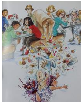
Resim 7. Resimlemelerde Yer Alan Hayret Duygusuna Ait Jest ve Mimikler (O'connor, 2008)

Karakterlerin ani ve beklenmedik durumlar, olaylar karşısında sergiledikleri jest ve mimikler ile hayret ve merak duygularını yansıtan hareketleri Şaşkınlık duygusu olarak tanımlanmıştır. Şaşkınlık duygu kümesini yansıtan resimler aşağıda örneklendirilmiştir: