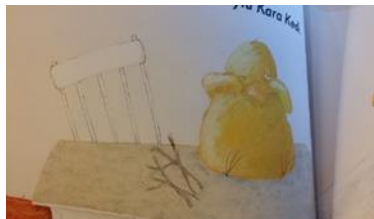
Resim 2. Resimlemede Yer Alan Acı Duygusuna Ait Jest ve Mimikler (Nünez, 2014)

Karakterlerin neşesiz hissettikleri, ağladıkları ya da çaresiz hissettiklerini gösteren jest ve mimiklerin Üzüntü duygu kümesini yansıttığı kabul edilmiştir.