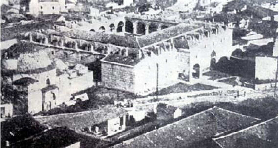
Resim 2. Kurşunlu Han ve Şengül Hamamı (Eski Hali)