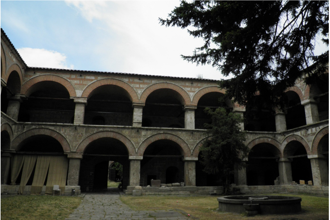
Resim 4. Kurşunlu Hanın Günümüzdeki Hali