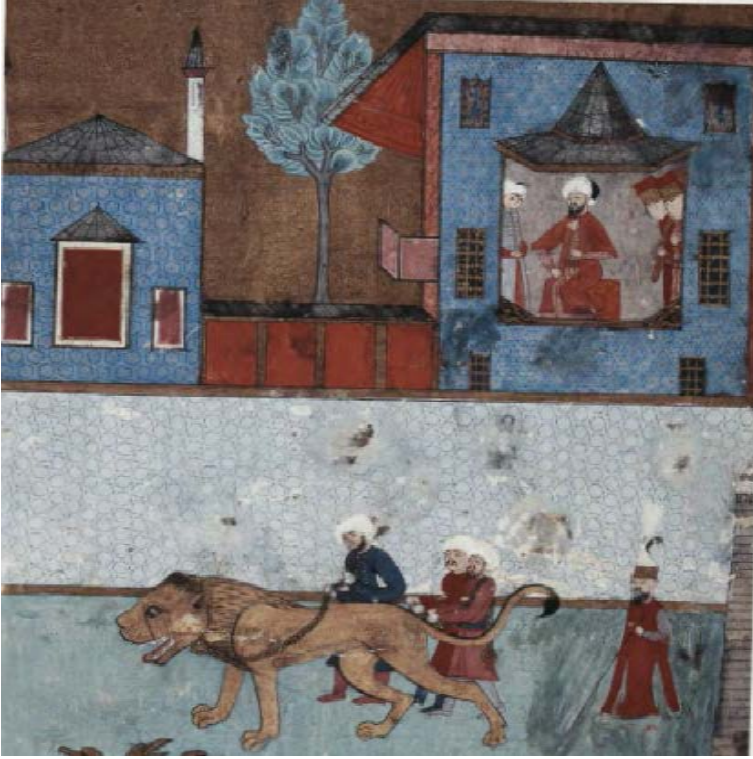
Resim-2 1582 yılına ait şenliklerde gösteriye çıkan arslanın, arslancılar tarafından III. Murat'ın huzurundan geçirilmeleri 18 .

Devletlerarası ilişkilerde siyasi otoriteler karşılıklı olarak birbirlerine çeşitli hediyeler suna gelmişlerdir. Hediyeleşmeler ilişkilerin gidişatında önemli etkenlerden biridir. Elbette ki hediyeğin mahiyeti de önemlidir. Çalışmayı ilgilendirdiği boyutuyla kaplanlar, panterler ve aslanlar gibi büyük kedileri hediye vermenin uzun bir geleneğin parçası olduğu gözlemlenmiştir 19 . Bu gelenekten Osmanlı Devleti de etkilenmiş ve bazı dönemlerde Osmanlı padişahı tarafından komşu devletlere gönderilen hediyeler arasında arslanlar yerini almıştır. III. Ahmet muhtemelen Arslanhane'de bulunan arslanı Nemçe (Avusturya) Kayzer'i VI. Karl'a hediye olarak göndermiştir 20 . Bu durum sultanın Arslanhane'deki hayvanları aracılığıyla yalnızca kendi halkına yönelik güç mesajı vermiyor