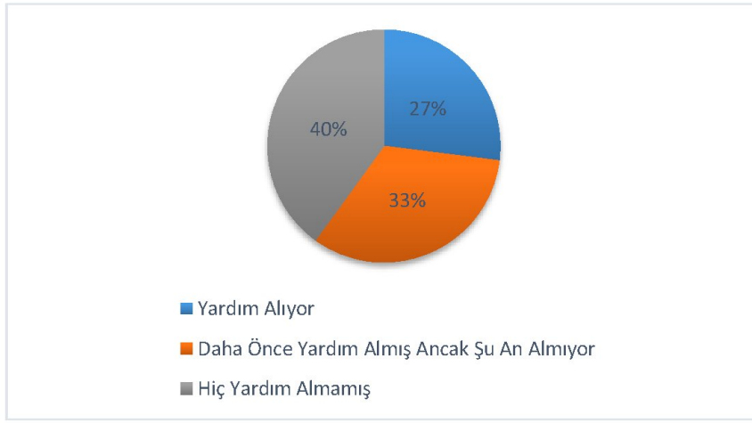
Grafik 4: Katılımcıların Sosyal Yardım almalarına Dair Bulgular

Yardım almak isteyip de yardım alamayan katılımcıların yardım alamamalarının sebepleri incelendiğinde sosyal güvenceye sahip olmalarından dolayı sosyal yardım alamadıkları görülmüştür. Bir müddet yardım almış olan katılımcıların ise aldıkları yardımların başka bir kurumdan yardım alınması veya kendi üzerine kayıtlı bir mal varlığının hasıl olması sebebiyle kesilmiş olduğu görülmüştür. Görüşülen kadınlardan yalnızca bir tanesi, herhangi bir sosyal yardım almayı istemediğini, yardım almanın kendisini küçük düşüreceğini ifade etmiştir. Yardım almakta olan katılımcıların aldıkları yardım türleri incelendiğinde bunların; ısınma yardımları, çocuklar için eğitim ve kıyafet yardımı, boşandığı eşinden aldığı nafaka, şartlı nakit transferleri ve şartsız/karşılıksız nakit yardımları şeklinde olduğu görülmüştür.