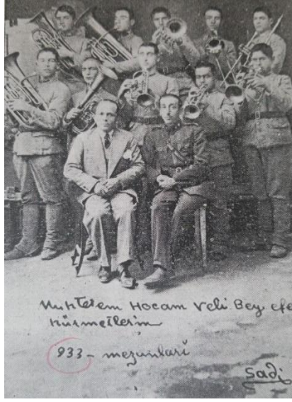
Şekil 5. 1933 Ankara İhvari Küçük Zabitler Mektebi mezunları