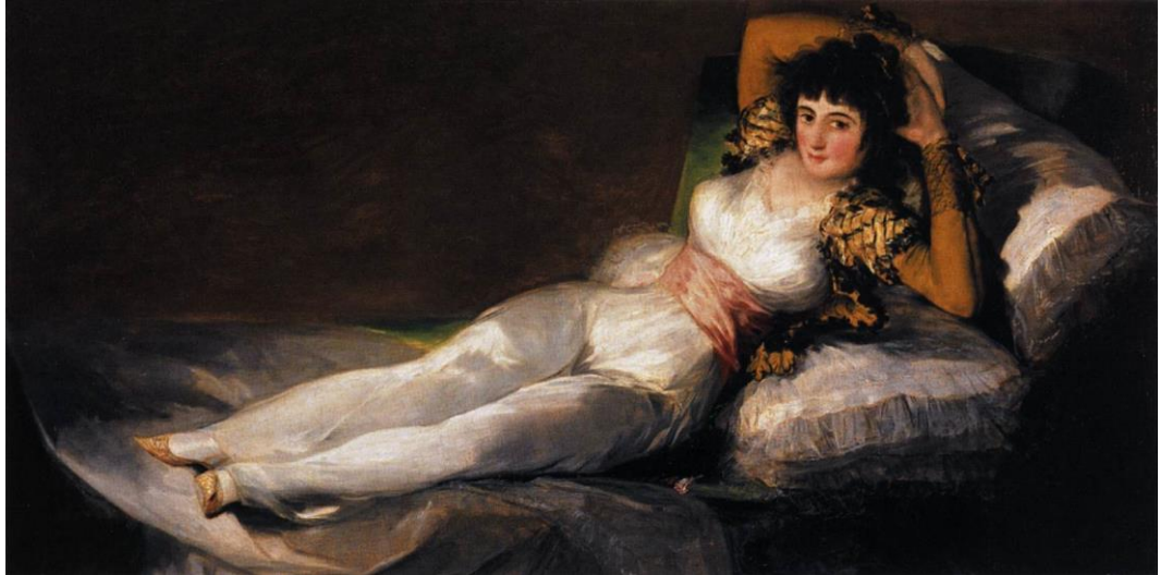
Goya, "Giyinik Maya", 97x190 cm TÜYB, 1802-1805