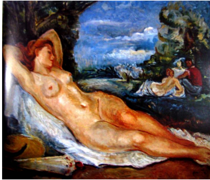
Zeki Faik İzer, “Nü'lü Kompozisyon”, 99,5 x 120 cm, TÜYB

Zeki Faik İzer bazen farklı konularda batılı ustaların işlerinden yorum eserler üretmektedir. Bu yorumlardan biride “Nü'lü kompozisyon” dur. Resim kompozisyon olarak hemen her şeyiyle bize Giorgione'nun “Uyuyan Venüs”ünü hatırlatmaktadır. İzer neredeyse aynı armonide bir doğa içerisinde resmettiği çıplağının kollarını başının altına koymuş, figürün rengini daha sıcak bir armonide boyamıştır. Arkadaki görünüşü ve figüre yaklaşımı daha izlenimci bir tavır sergiler. Bunun dışında resim bildik Venüslere çok yakındır.