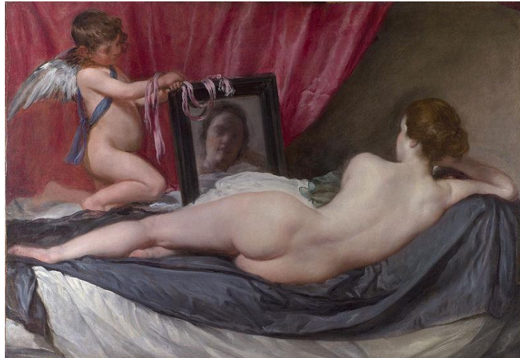
Velazquez, “Aynadaki Venüs”, 122x177 cm, TÜYB,

Resme biraz dikkatli bakacak olursak aslında ayakta duran çocuğun dikey hareketi ve resim içindeki yeri, ayaklarından başlayarak figürün başına doğru diyagonal hareketi ve üst üste yatay hareketler aslında kompozisyonun önceki Venüslere ne kadar yakın olduğunu göstermektedir. Elbette ki Velazquez gibi bir usta bu yakın bağı kendine has yenilikçi tavrıyla kırmış aynı kompozisyonu bize bambaşka bir resim olarak göstermiştir.