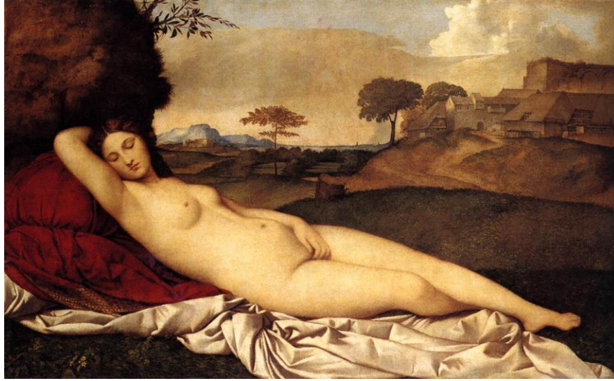
Giorgione, "Uyuyan Venüs", 108,5x175 cm, TÜYB, 1509

Vasari'nin iddiasına göre, Giorgione öldüğünde resim yarım kalmıştır. Sonrasında Titian resmi tamamlamıştır. Bu Titian'ın "Urbino Venüsü" adlı resmi düşünüldüğünde doğru olarak kabul edilebilir. Ancak bir kesinliği yoktur.