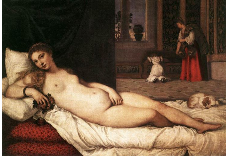
Tiziano, "Urbino Venüsü", 119x165 cm, TÜYB, 1538

Sadakati simgeleyen köpek sanki sadakatsizliğe dikkat çekercesine uyumaktadır. Arkada bir sandığı karıştıran hizmetçiler ortamdaki erotik çağrışımı arttırıcı niteliktedir. Venüs'ün ifadesi var olan bir kişinin yüzü gibidir. Bir heykel ya da var olan bir resme bakarak değil sanki yaşayan bir modelden yapılmıştır. Ancak bütün bu dünyasal duruma karşı sanatçı mahremiyet içinde erotizmi saklayan tanrıçasını idealleştirmiştir.