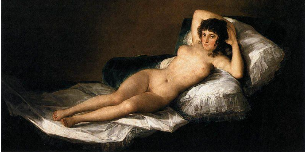
Goya, "Çıplak Maya", 97x190 cm TÜYB, 1789-1805

Çıplak resim yapmanın yasaklandığı bir dönemde İspanyada yapılan bu resimlerde ki karakter mitolojik bir kimlik taşımaktan uzaktır. Goya'nın döneminde yaşayan gerçek biri olduğu aşıkârdır. Karanlık bir atmosferde rengin ve ışığın bilinçli olarak gayet erotik bir pozda duran Maya'yı ilgi odağı haline getirmesi istenilen dünyevi cinsel çağrışımı güçlendirir niteliktedir.