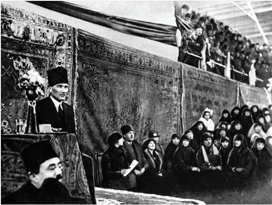
Fotoğraf 13: Atatürk İzmir İktisat Kongresindeki açılış konuşması, 17 Şubat 1923, İzmir

“Halkımızın çoğunluğu çiftçidir, çobandır. Bundan dolayı en büyük kuvveti, kudreti bu alanda gösterebiliriz ve bu alanda önemli yarış meydanlarına atılabiliriz. Fakat aynı zamanda sanatımızı da artırmak ve genişletmek zorundayız. Eğer sanat konusunda yine hoşgörülü olursak o halde sanayi eserlerinde yine dışarıya haraç verici oluruz.” 14 (Fotoğraf 13)