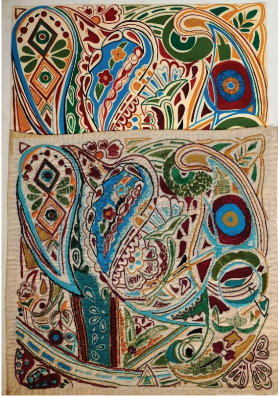
Fotoğraf 5: İşleme tasarım ve uygulaması, Yasemin ACAR KARA Öğrenci Çalışması

Anasanat dalında halı, kilim gibi kirkitli dokumaların yanı sıra halk ve saray mekikli el dokumacılığı ilginç örnekleri ile geleneksel tekstillerin çeşitli tekniklerinin belgeleme ve uygulama çalışmaları yapılmış, öğrenciler alan araştırmasına yönlendirilmiş, ayrıca geleneksel örneklerden ilham alınarak günümüze uyarlanması yapılmıştır. (Fotoğraf 5, Fotoğraf 6, Fotoğraf 7, Fotoğraf 8, Fotoğraf 9) Ödev kapsamında yapılan öğrenci işlerinden seçim yapılarak eğitim yanında ilgililerin değerlendirmesine sunulmak üzere yurtiçi ve yurtdışında bir çok karma öğrenci sergileri ile sergilenmiştir. Bu anasanat dalı, ülkemizde yeni hizmete başlayan üniversitelerin güzel sanatlar fakültelerinde çeşitli isimler altında açılmasına örnek olmuştur. Bunun peşi sıra güzel sanatlar fakültelerinin tekstil ve moda bölümlerinde de geleneksel dokumalara ilgi artmıştır.