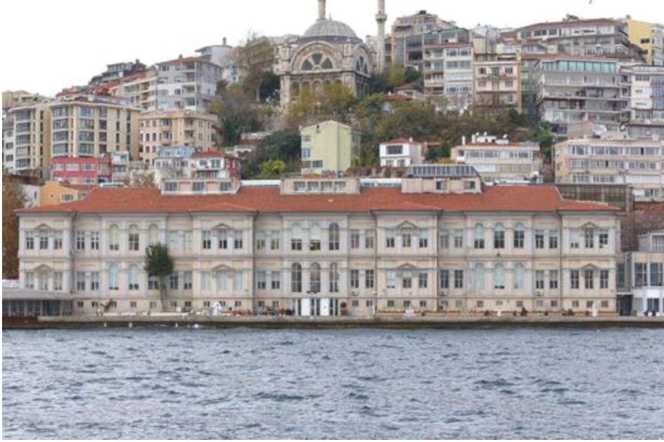
Fotoğraf 3: Mimar Sinan Güzel Sanatlar Üniversitesi / İstanbul Devlet Güzel Sanatlar Akademisi