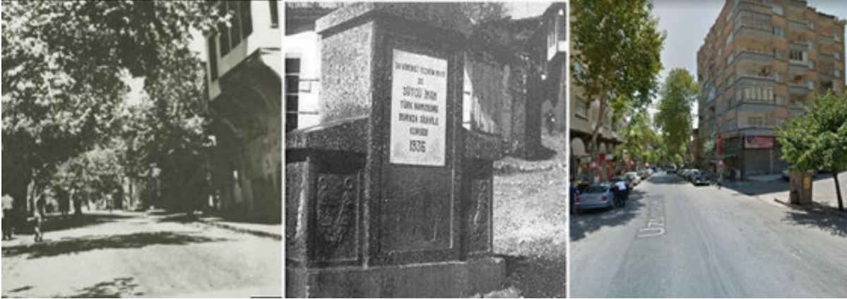
Şekil 3. 9. 1967 & 2019 yıllarından Uzunoluk Caddesi ve Sütçü İmam çeşmesi

“... Gençliğimizin çocukluğumuzun geçtiği yerlerden biri Uzunoluk. Kapalıçarşı belediye hepsinde anılarımız var tabi. 5 ”