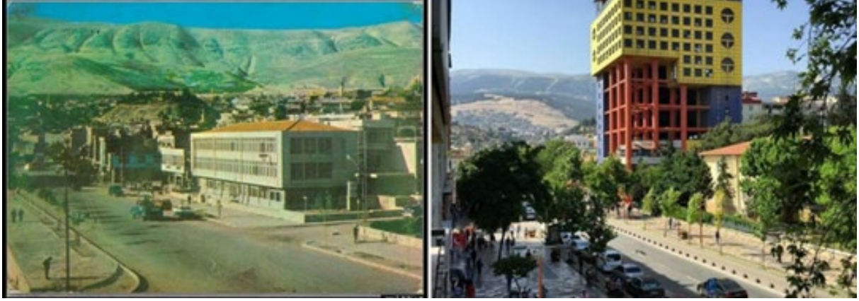
Şekil 3. 10. 1968 & 2019 yıllarından İl Özel İdare İşhanı

“...18 katlı özel idare binası (hayalet veya ucube bina) aklıma ilk gelen yer, internet tarayıcısında dünyada en saçma binalar deyince ilk çıkan görsel oluyor. ...kent için hiçbir özelliği olmadığı, boş kullanım alanı olarak anılması. ...işlevsel olarak düşünülüyor ama maliyetli olduğu için bir bir terkedilerek hayalet görünümünde şehrin merkezinde atıl bir yapı olarak görsel kirlilikten başka bir işlevi kalmamıştır.” 8