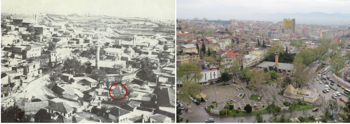
Şekil 3. 8 1920s & 2019 yıllarından Taş Medrese

“...Çocuklukta o Taş Medreseyi görüyorduk ama tarihi değerini bilmiyorduk, şuurunda değildik bilmiyorduk ama bizi bayağı bir maziye bağlıyormuş. Geçmişten günümüze güzel bir esermiş. Bunun farkında değildik çocukluğumuzda, büyüyünce anlıyorsun bunun kıymetini, ne kadar kıymetli taş, tek taş olduğunu orada. ... Ve her bir geçmiş mimari bize çocukluğumuzu, gençliğimizi hatırlatıyor.” 5