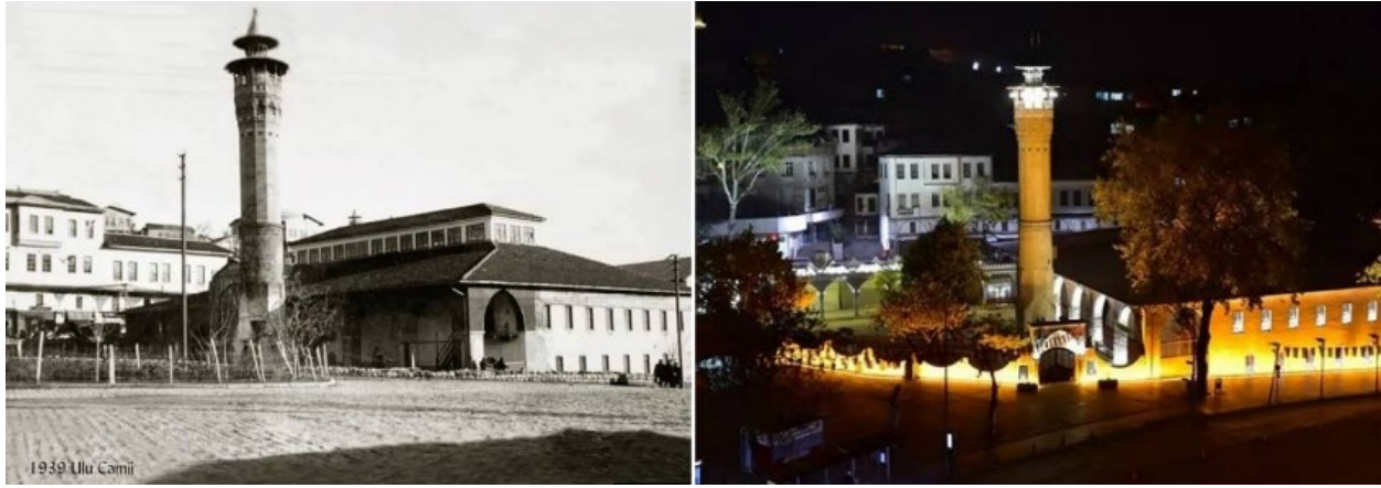
Şekil 3. 6. 1939 & 2019 yıllarından Ulu Camii