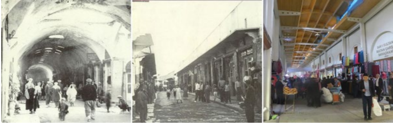
Şekil 3. 3. 1930 & 1940 & 2019 yıllarından kapalı çarşı