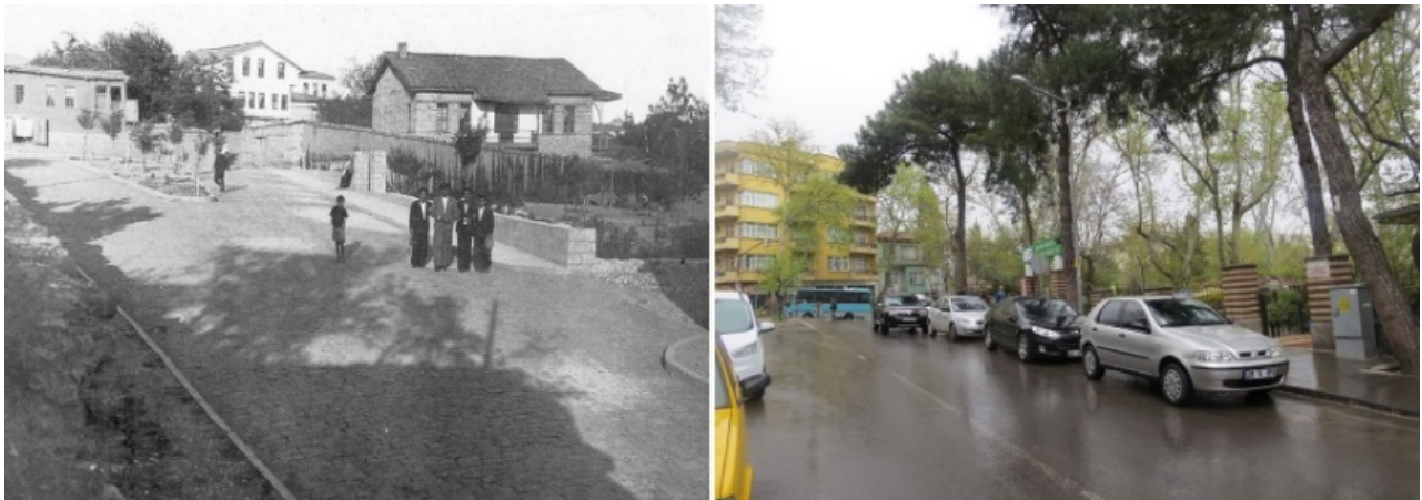
Şekil 3. 4. 1940s & 2019 yıllarından Çocuk Bahçesi

Kahramanmaraş'ın ilk parkı olma özelliğini taşıyan Çocuk Bahçesi, 1934 yılında açılmıştır. Kentin kimliğinde yer etmiş mekânlardan olan Çocuk Bahçesi, zamanla bulunduğu bölgeye de adını vermiştir ve bu isimle günümüzde de devam etmektedir. Çocuk Bahçesi kentin önemli nirengi noktası ve merkezlerinden biri olmaktadır. Günümüzde bahçenin içerisindeki çocuk parkı hala bulunsa da mekân daha çok büyüklere hizmet ederek çay bahçesi olarak kullanılmakta ve belleklerde izini sürdürmektedir (Şekil 3.4).