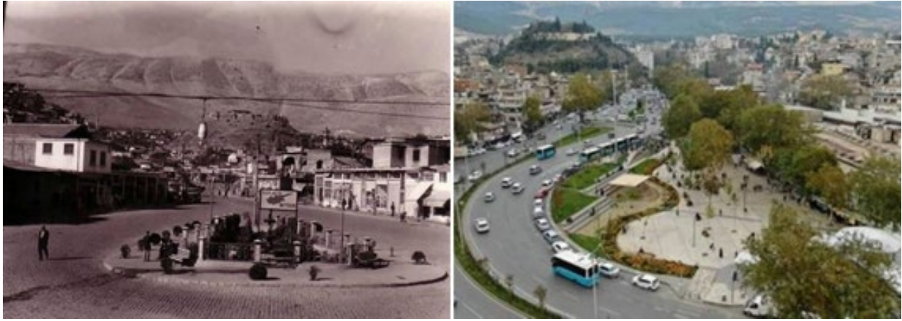
Şekil 3. 7. 1966 & 2019 yıllarından Kıbrıs Meydanı

“...Kıbrıs Meydanı çocukluk anılarımın geçtiği yerler. ...ortaokulda trampet takımındaydım, meydan da okul olarak gösteriler yapardık. ...ilkokulda birinci sınıfta arkadaşım ile Kıbrıs meydanından geçip o zamanlar yeni yeni yapılan apartmanlardan Milcan apartmanına gitmiştim, hiç unutmam. 19 ”