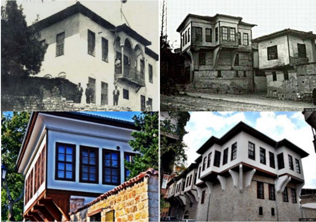
Şekil 3. 5. Tarihi Konaklar ve restorasyon çalışmaları sonrası

Kentin geleneksel evleri 19. yüzyıl sonları ve 20. yüzyıl başlarında, Cumhuriyet Döneminde yapılmış konutlara rastlamak mümkündür. Tepeler üzerine kurulu kent planından dolayı konaklar merkeze dönük ve yamaçlardan aşağıya bakmaktadır. Kentin konakları, dar sokaklar içinde, genellikle iki katlı ve bahçe içerisinde avlu planlı konaklardır (Anonim, 2015). Günümüzde tarihi konaklardan bazıları restorasyon çalışmaları ile kentin kimlik ve belleğini devam ettirmektedir (Şekil 3.5).