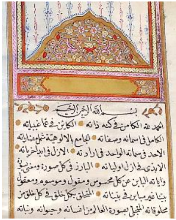
DV/352 İç Sayfa

24. DV/352 demirbař numarada kayıtlı; řerhu ve Havâssu Besmele-i