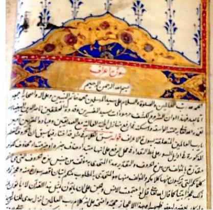
DV/478 İç Sayfa