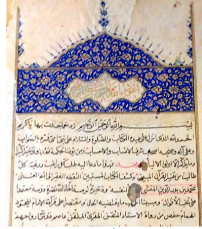
DV/488 İç Sayfa

20. DV/492 demirbaş numarada kayıtlı; el-Muktadab mine't-Temyîz limâ fi'l-Keşşâf mine'l-İ'tizâl fi'l-Kitâbi'l-Azîz 25 , Ebû Ali Ömer b. Muhammed b. Kamd b. Halîl es-Sekûnî el-Mağribî el-Mâlikî 26 (ö. 717/1317). 997/1588 tarihinde Abdülkâdir tarafından Arapça nesih hatla istinsah edilmiştir. 21 satırlı 172 varaktır. Kiraz renk deri cildi, şirazesı ve miklebi sağlamdır.