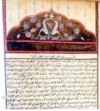
DV/012 İç Sayfa

edilmiştir. İstinsah tarihi yoktur. 23 satırlı 172 varaktır. Cildi harap durumdadır. 15 sûrenin tefsirini içermektedir. Sebe' sûresi ile başlar, Hucurât sûresi ile biter.