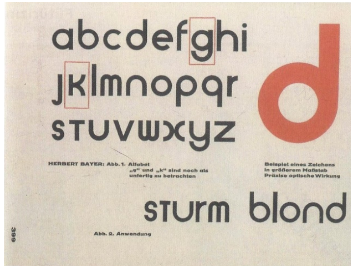
Görüntü 9: Herbert Bayer tarafından 1925 yılında Bauhaus'ta geometrik ve yalnızca küçük harflerden oluşan tipografi olan Universal harf tipi.

Kaynak: Bektaş, D. (1992). Çağdaş Grafik Tasarımın Gelişimi , Yapı Kredi Yayınları, İstanbul.