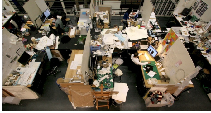
Görüntü 12: Görsel Tasarım Atölyesi