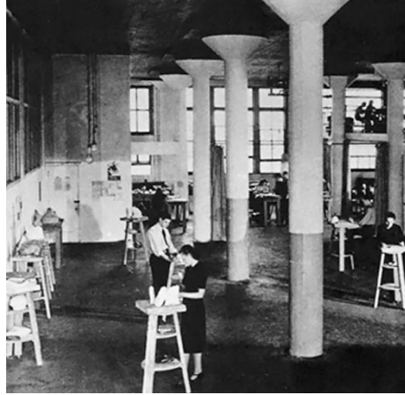
Görüntü 3: Bauhaus atölyelerinden bir fotoğraf.

için değil, bütün halkın eğitimden geçmesi gerektiğine inanıyorlardı. Bu nedenle ilk ve orta öğretimde sanat eğitimi önemli bir yer alıyordu” (Tonguç'tan aktaran Ülkü, 2008: 40).