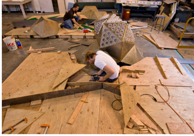
Görüntü 10: Günümüz Tasarım Atölyesi