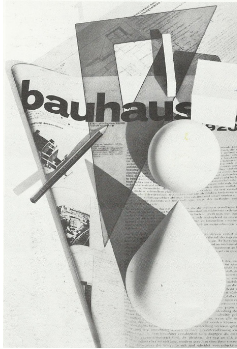
Görüntü 8: L. Moholy-Nagy, Fotomontaj, Fotogram gibi yeni teknikleri harmanlamıştır.

oluşturulmuştur. Hatta bu dönemde tipografi tasarımında Bayer tarafından evrensel harf tipi tasarımı ile net, basit bir biçim oluşturulmuştur (Görüntü 9).