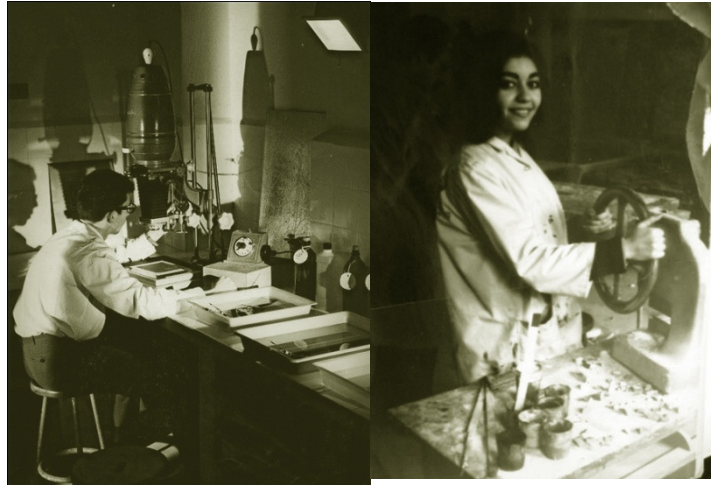
Görüntü 7: Fotoğraf ve Dekor Atölyesi.

Genel olarak okulun yapısı ve kurulan atölyelerin fiziki durumu Almanya'nın ünlü mimarlık ve tasarım okulu olan Bauhaus'un eğitim anlayışı örnek olarak oluşturulduğu gayet açıktır (Ertosun, 2006). Okulun eğitim yılı 4 yıl olarak belirlenmiştir. Boduroğlu (2010)'nun aktardığına göre; eğitimin ilk yılında Temel Sanat Eğitimi Dersi tüm bölüm öğrencilerine ortak olarak okutulmuştur. İkinci yıldan itibaren ise; öğrencilerin dâhil oldukları bölüm dersleri öğrencilere aktarılmaya başlanmıştır. Bölümün uzmanlık alanına bağlı olarak oluşturulan uygulama atölyelerinde eğitime devam edilmiştir. Öğrencinin el-kol koordinasyonunun geliştirilmesi için çeşitli teknik bilgiler ve farklı malzeme kullanımı serbest bırakılmıştır (Görüntü 7).