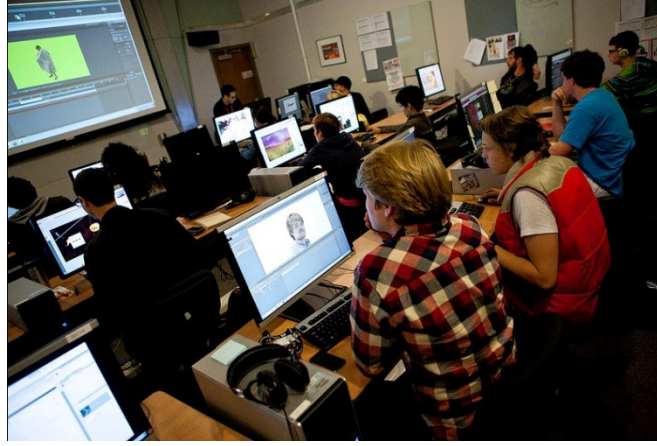
Görüntü 11: Animasyon Atölyesi