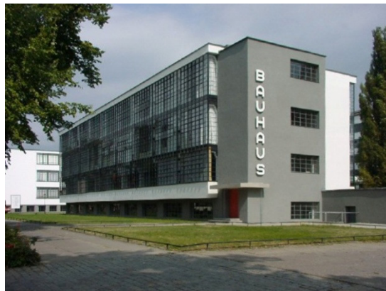
Görüntü 1: Bauhaus'un Weimar'daki binası.

Bauhaus, mimar Walter Gropius tarafından Almanya'nın Weimar kentinde 1919 yılında kurulmuştur (Görüntü 1). “Yapı Evi” anlamına gelen Bauhaus okulu, Nazilerin baskısı sonucu, eğitime sık sık ara vererek, 1925 ve 1932 yılları arasında 3 kez yer değiştirmek zorunda kalmıştır. Bauhaus dönemin koşullarına bağlı olarak şekillendiği bilindiği gibi, Sanayi Devrimi sonrasında gündeme gelen Arts and Crafts hareketine bağlı olarak ortaya çıktığı düşüncesi de Meşhur (2011), tarafından ifade edilmiştir.