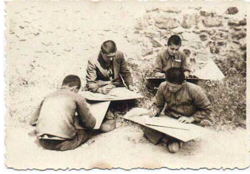
Görüntü 5: Açık havada resim çalışması yapan öğrenciler.