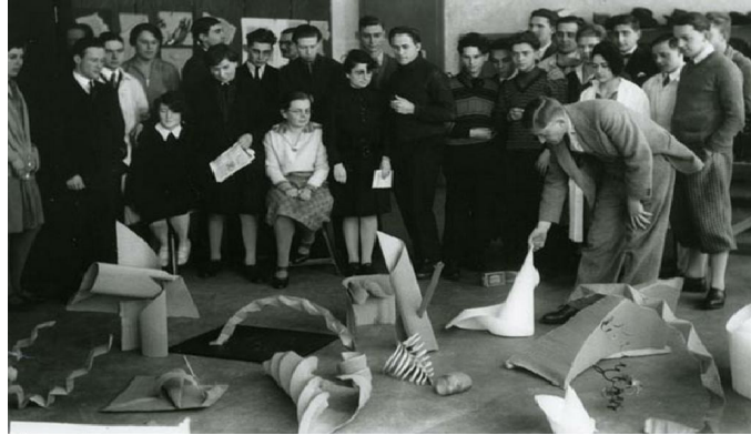
Görüntü 2: J. Albers, öğrenciler ile beraber çalışmaların kritiğini yaparken.

Walter Gropius, okulun açılış konuşmasını yaparken, tüm sanat dallarının okul yapısı içerisinde bölüm bazında öğretilebileceğini, renk ve biçim bilgisinin bilimsellik, kuramsallığı kapsadığı düşüncesini dile getirmiş ve Tanilli (2002), de araştırmasında bu konuya vurgu yapmıştır. Aynı doğrultuda; eğitim öğretisi açısından insanın görme duyuları, forma ilişkin bilinci ve el becerisi geliştirilerek ve serbest bir biçimde uygulanabilen teknik bilgiler öğrenciye kavratılabilecek (Görüntü 2), böylece kişinin deneyler yapmasına imkân tanıyan bilinçli iş üretimini sağlayan bir sanat algısı oluşturulabilecektir (San'dan aktaran Oruç, 2009).