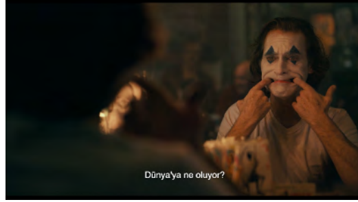
Görsel 2: Arthur'un Aynadan Yansıması (Joker, 2019).

kendi bedenini algılayarak anneden ayrı bir varlık olduğunu görmüştür. Arthur'un da filmin açılış sekansında aynada kendini görmesi, özne ve arzu nesnesi mücadelesi ekseninde imgesel ile simgesel arasında yaşanacak bir maceraya işaret etmektedir. Dolayısıyla Joker filmi daha ilk sahnesiyle; anti-kahraman, toplumsal şiddet ve postmodernizm gibi kavramların ötesinde anlatısının derinlikli ve psikolojik bir zemine yerleştiğini göstermektedir.