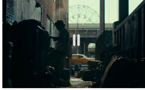
Görsel 3: İlk Şiddet Sahnesi (Joker, 2019)

İkinci kırılma sürecinde sık sık merdiven sahneleri görürüz. Arthur, Joker'e dönüşme sürecinde genellikle yorgun argın merdivenlerden çıkar. Bu, öznenin gerçeğe ulaşma çabası olarak görülebilir ancak özne, gerçeğe ulaşmaya çalıştıkça gerçek onu kendinden uzak tutmaktadır. Arthur'un metroda üç genci öldürmesi filmin en önemli olaylarından biridir. Metroda bir kadını taciz eden gençlerin dikkatini, Arthur'un gülmesi çeker ve Arthur'a saldırırlar. Arthur da bu noktada iş arkadaşının verdiği silahla bu üç genci öldürür. Arthur, artık tam anlamıyla imgesel evrede sıkışıp kaldığını ortaya koyar. Eşyalarını toplamak için geldiği iş yerinde her zamankinden farklı olarak herkese haddini bildirerek merdivenlerden iner. Bilinçaltına iniş başlamıştır. Filmin sonunda Arthur, Joker'e dönüştüğünde ise, bu kez gayet canlı bir şekilde dans ederek merdivenlerden inmektedir. Bu imgesel evreye yani bilinçdışına inişin tamamlandığının işaretidir. Freud'a göre merdiven cinsel dürtülere işaretir. Lacan için de arzu, imgesel evrenin merkezinde yer almaktadır (Freud, 2014a; Lacan, 2012) (Görsel 4).