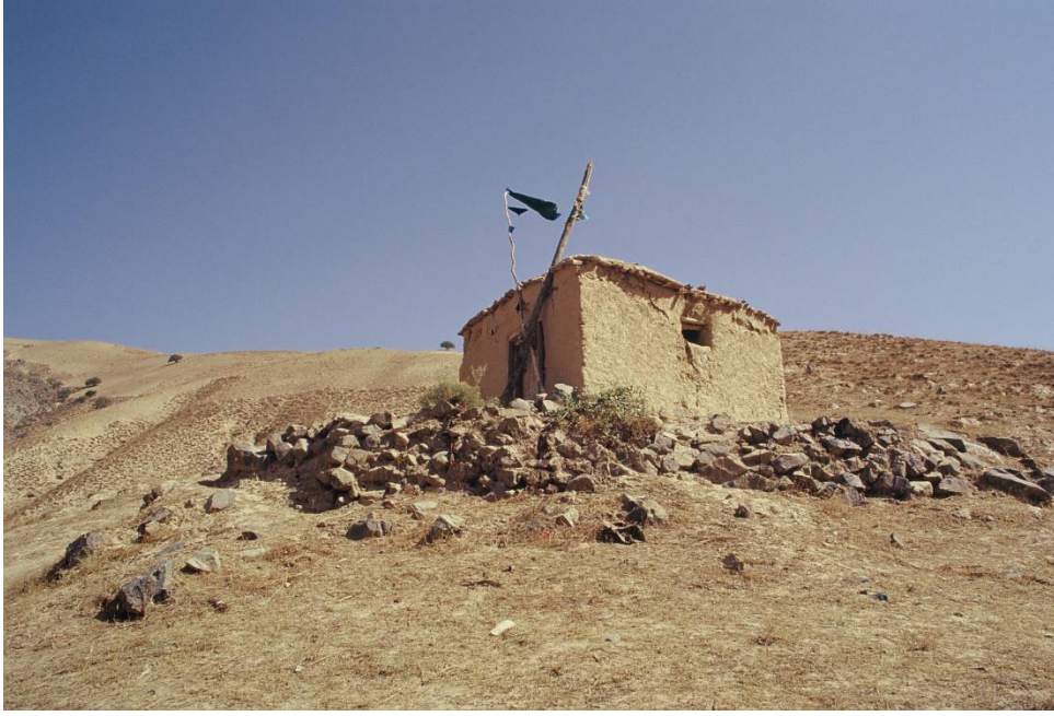
Resim 1: Seyyit Turab neslinden olduğu kabul edilen Pir Abdal isimli bir dervişin türbesi. (Zaruga, Uruzgan)