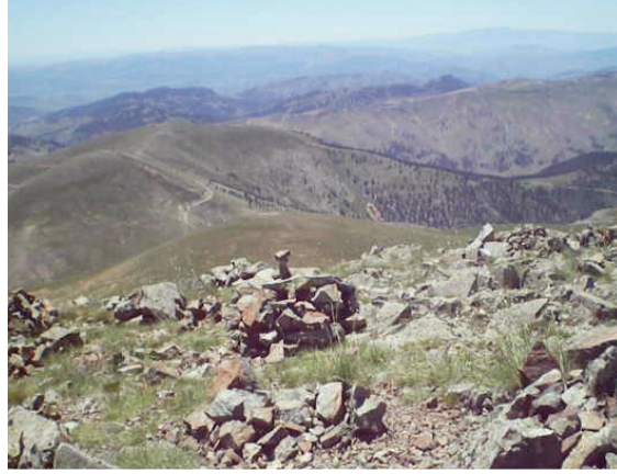
Resim 3 Halbaba dilek taşlarından bir görünüm 12

yakalama ritüelini gerçekleştirirler hem de dağınık haldeki taşları bir araya toplayarak dileklerini Hakk'a arz ederler.