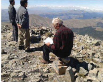
Resim 7. Kur'an okuyan bir ziyaretçi.