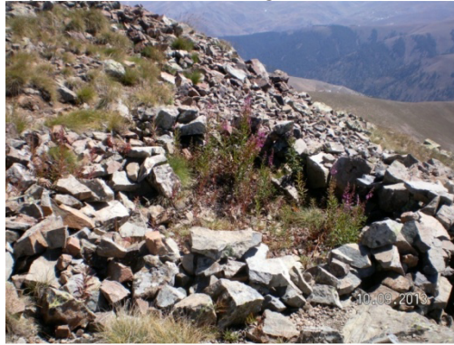
Resim 1. Halbaba dilek kuyusu

Başka bir kaynak kişi, çocukluk anılarını anlatarak başladığı sohbette “ çocuk sahibi olamayan kadınların buradaki yatır aracılığıyla dua ettiklerini ve kısa sürede çocuk sahibi olduklarını belirtmiştir. Aynı kaynak kişi “çocukluk yıllarında koyun otlatırken Halbaba’da uyduğunu ve rüyasında aksakallı bir dervişini namaz kılarken gördüğünü söylemiştir ” (Tös, 2013). Tüm bunların dışında 2007 yılında gerçekleştirdiğimiz alan araştırması sırasında Halbaba’da pek çok kişiyle konuşma fırsatı bulduk. Bu konuşmalarda kesin olan Halbaba’da dilenen dileklerin kabul olduğudur.