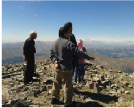
Resim 9. Halbaba ve civar obalar hakkında sohbet.