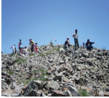
Resim 5. Halbaba ziyaretçilerinden bir görünüş.