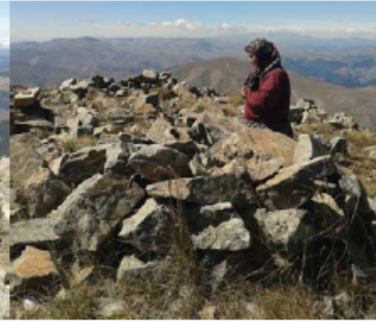
Resim 8. Namaz kılan bir ziyaretçi