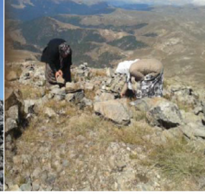
Resim 6. Taş yığarak dilek dileyen ziyaretçiler