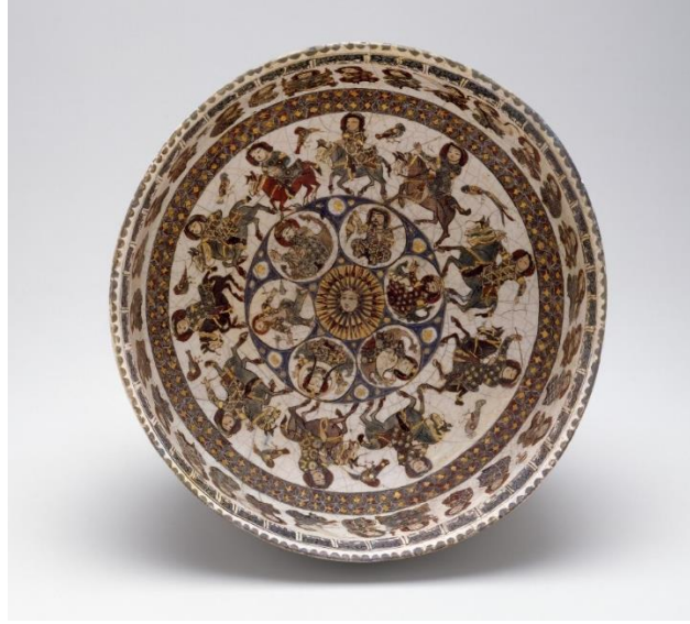
Fotoğraf 161: Minai teknikli astrolojik temalı kase, Metropolitan Museum, (Canby, Beyazıt, Rugiadi, & Peacock, 2016, s. 206, cat. 123).

Canby tarafından Venüs olarak tanımlanan Zühre, bağdaş kurup kahverengi bir tahta oturmuş ve ud çalar vaziyette tasvir edilmiştir. Üzerine açık-koyu yeşil, bordo ve altın yıldız tonlarında geometrik desenli bir kıyafet giymektedir. Ayağında kırmızı ayakkabıları vardır. Siyah, küt saçları olan figürün başında ortasında altı kollu yıldız biçiminde altın renginde bir taşı olan diadem takılıdır. Başının etrafı, bordo bir hale ile çevrilidir. Figür, sağ eli çalgının gövdesi üzerinde, sol eli de çalgının sapı üzerinde, udu çalar vaziyette tasvir edilmiştir. Ud, armudi gövdeli; ancak sapı gövdeden yukarı doğru kıvrılan biçimde tasarlanmış bir forma sahiptir. Figür, sağ elinin baş ve işaret parmaklarıyla bir mızrap tutarak udu çalmaktadır. Sol elinin dört parmağı da çalgının sapı üzerinde notalara basmaktadır. Çalgının uç kısmında da burguluk bölümü basitçe tasvir edilmiştir.