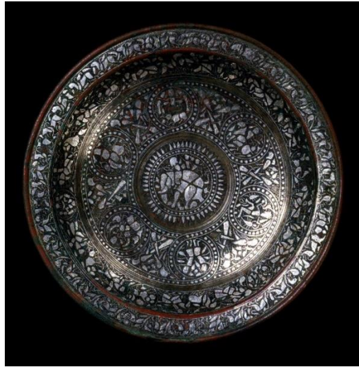
Fotoğraf 12: Gümüş ve savat benzeri bir madde kakmalı tunç tabak, David Collection

Müzedede yer alan bilgilerde eser, gümüş kakmalarından ötürü Horasan Selçukluları ile ilişkilendirilse de eserin merkezinde yer alan fil tasvirinden dolayı, sanatlarında Hint etkisi görülen, Gurlular'a ait olabileceği belirtilmiştir. Ancak Selçuklu döneminde yapılmış seramik eserler üzerinde de buradaki tasvire çok benzeyen fil tasvirleriyle karşılaşmaktayız. Figür üslubu, malzeme özellikleri ve kompozisyonu ile bir bütün olarak değerlendirildiğinde eserin Selçuklulara ait olabileceğini söylemek mümkündür.