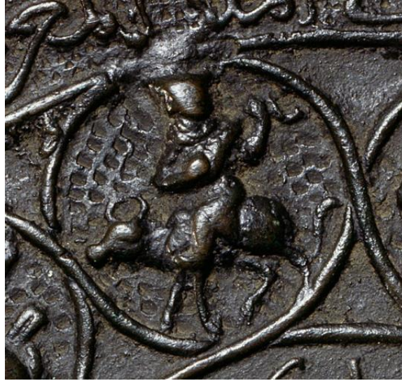
Fotoğraf 15: 12 burç tasvirli tunç aynada boğa tasviri, David Collection, Fotoğraf: Pernille Klemp

Seramik malzemede tespit edilebilen tek örnek 57.36.4 envanter numarasıyla Metropolitan Museum'da yer alan Zühre tasvirli bir tabaktır. Eser, opak beyaz sır üzerine minai tekniği ile süslenmiş, saraylılar, atlı figürler ve gezegen tasvirlerinden oluşmaktadır. Tabağı ağız kenarında koyu yeşil, dilimli bir hat çevrelemektedir. Onun altında koyu yeşil üzerine siyah bitkisel desenli bir fona sahip beyaz kufi yazı kuşağı dolaşmaktadır. Yazı kuşağının içinde beyaz zemin üzerine yan yana dizilmiş, ikisi taht üzerinde olmak üzere bağdaş kurup oturan toplam yirmi sekiz figür yer almaktadır. Bu figürlerden taht üzerine oturanlar birbirleri ile karşılıklı yerleştirilmişlerdir. Tahta oturan figürlerin sağ taraflarına müzisyenler ve onları dinleyen muhtemelen saray mensubu kişiler oturtulmuştur. Her iki tahtın da sağ tarafına, birinde ikinci ve üçüncü; diğerinde üçüncü ve dördüncü sıraya önce birer çeng çalan figür,