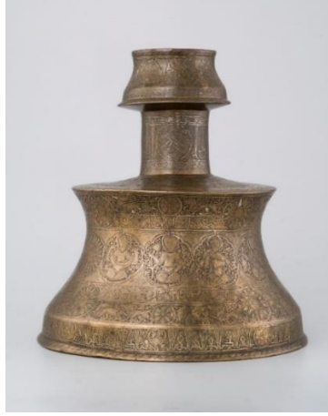
Fotoğraf 1: Bakır alaşımli gümüş kakmalı şamdan, Pergamon Museum, ( http://www.smb-digital.de/eMuseumPlus?service=ExternalInterface&module=collection&objectId=1525433&viewType=detailView). Erişim tarihi: 09.02.2020.)

Gövdenin ortası, kalın bir kuşak halinde ayrılmış ve içine yan yana birbiri ile geçmeler yaparak birleşen gülçeler içerisinde on iki gezegen tasviri yapılmıştır. Bu tasvirlerden biri güneş olup diğer on bir tanesi birer figür ile temsil edilmişlerdir. Figürlerden kimisi otururken kimisi de ayakta dururken ve ellerinde ilgili gezegeni sembolize eden nesnelere tutarak tasvir edilmiştir.