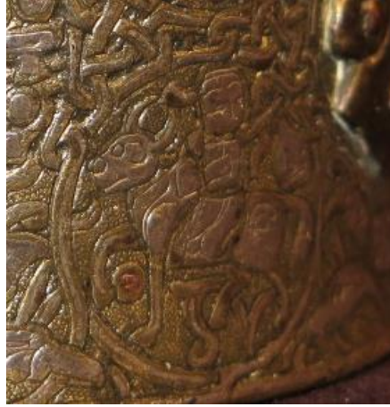
Fotoğraf 7: Gümüş ve bakır kakmalı tunc hokka üzerinde Zühre-Boğa tasviri, David Collection

Maden eserler arasında müzik ve dans tasvirli Zühre gezegeninin yer aldığı bir diğer eser üzerinde aynı zamanda boğa ve terazi burçlarının da müzikli olarak tasvir edildiği görülmektedir. British Museum'da 1950, 0725.1 envanter numarasıyla sergilenen ve "Vescovali Vase" olarak tanınan eser, gümüş kakma ve kazıma ile süslenmiş tunc döküm bir kasedir. Kase, yüksek kaideli, yarım küre biçiminde gövdeli ve kapaklıdır. Kasenin ve kapağının dış yüzeyi oldukça zengin kompozisyonlara sahip süslemelerle doldurulmuştur. Kasenin kaidesini iyi dilekler içeren (Erginsoy, 1978, s. 219) insan başlı nesih yazı kuşağı çevrelemektedir. Eserin iç yüzünde etrafı daire biçiminde stilize bitkisel, sivri yapraklı, bir süsleme ile çevrelenmiş, içi geçmeli örgü motifi ile doldurulmuş altı kollu yıldız yer almaktadır. Altı kollu yıldızın kolları arasında birer küçük daire ve onların da altında kavisli duran birer balık figürü yer almaktadır (Pinder-Wilson, 1951, s. 85; Erginsoy, 1978, s. 219, Çizim 42).