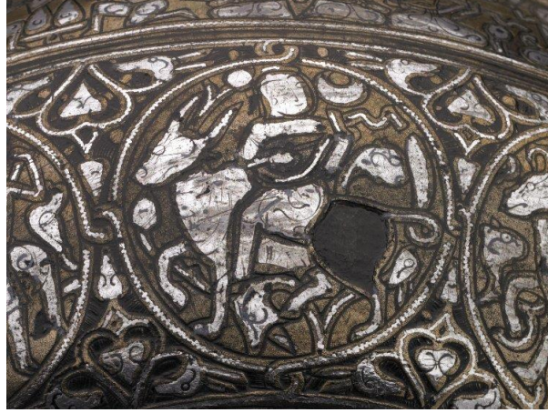
Fotoğraf 9: Gümüş kakmalı ve kazımalı kapaklı tunç kasede boğa burcu (Vescovali Kasesi), British Museum, (Canby, Beyazıt, Rugiadi, & Peacock, 2016, s. 208, cat. 124, fig. 83).