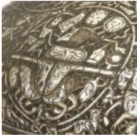
Fotoğraf 11: Gümüş kakmalı ve kazımalı kapaklı tunç kasede Zühre tasviri (Vescovali Kasesi), British Museum, (Canby, Beyazıt, Rugiadi, & Peacock, 2016, s. 207, cat. 124).