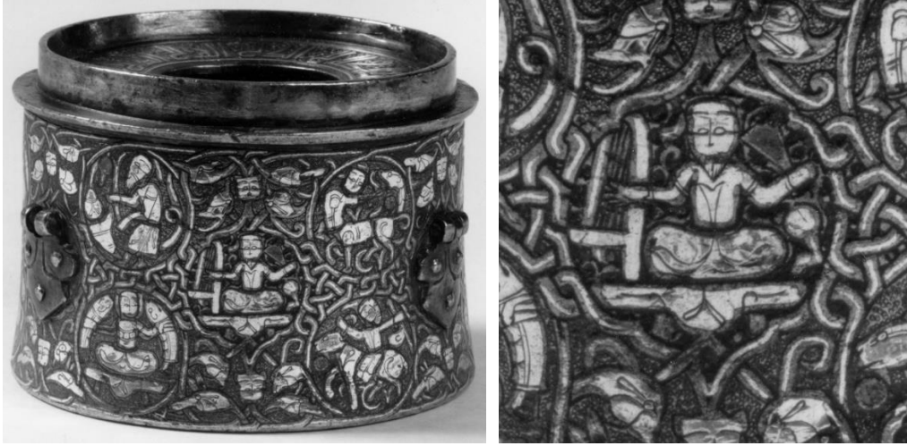
Fotoğraf 5-6: Gümüş ve bakır kakmalı tunc hokka üzerinde çeng çalan figür tasviri, David Collection