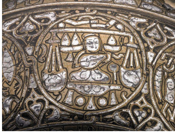
Fotoğraf 10: Gümüş kakmalı ve kazımalı kapaklı tunç kasede terazi burcu (Vescovali Kasesi), British Museum, (Canby, Beyazıt, Rugiadi, & Peacock, 2016, s. 208, cat. 124, fig. 82).