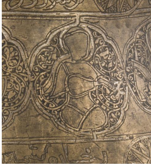
Fotoğraf 2: Bakır alaşımli gümüş kakmalı şamdan, Pergamon Museum, ( http://www.smb-digital.de/MuseumPlus?service=ExternalInterface&module=collection&objectId=1525433&viewType=detailView. Erişim tarihi: 09.02.2020.)

Zühre gezegeninin tasvir edildiği diğer maden eserlerden biri de AOR 41-107 envanter numarasıyla Louvre Museum'da yer alan ve müze tarafından 13.yy'a tarihlendirilen gümüş kakma ve kazıma tekniğiyle süslenmiş bakır alaşımli, düz tabanlı bir kutudur 3 .