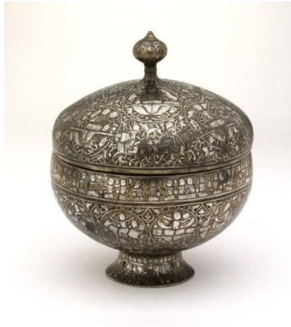
Fotoğraf 8: Gümüş kakmalı ve kazımalı kapaklı tunç kase (Vescovali Kasesi), British Museum, (Canby, Beyazıt, Rugiadi, & Peacock, 2016, s. 208, cat.124).

Müziyen figürler dışında iki figürün de karşılıklı olarak dans ettiği görülmektedir. Soldaki figür sağ diziyle, sağdaki figür de sol diziyle yere çökmüş, ikisi de kollarını kaldırarak bir tür dans sergilemektedirler. Figürlerin arasında yüksek kaideli bir meyve tabağı yer almaktadır. Arkalarında ise içki içen ve kadeh kaldıran başka figürler vardır. Figürlerin ikisi de belden kuşaklı, pantolon benzeri bir alt ve önden kapamalı bir üstten oluşan kıyafetler giymektedir. Soldaki figürün başında, arkadan sırtına doğru sarkan bir kuşağa sahip başlık takılıdır. Figürlerin kıyafetlerinin kolları, dans eden figürlerde alışık olduğumuz üzere uzun tutulmuş ve ellerinden ileri doğru genişleyerek uzanmaktadır.