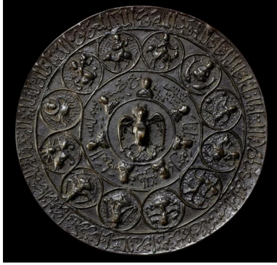
Fotoğraf 14: 12 burç tasvirli tunç ayna, David Collection

vermektedir. Başını da hafifçe geriye doğru çeviren figür, göğüs hizasında tuttuğu ud/barbet benzeri bir telli çalgıyı çalmaktadır. Sağ eli, çalgının gövdesi üzerinde, sol eli de çalgının sapındadır. Armudi gövdeli bir uda benzeyen çalgının kısa bir sapı vardır. Sapın uç kısmında aşağıya doğru kavisli bir hat halinde burguluk kısmı görülmektedir.