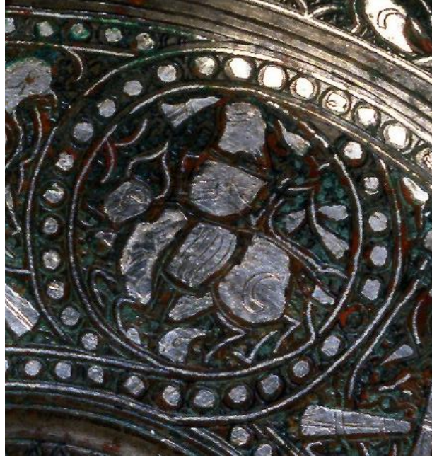
Fotoğraf 13: Gümüş ve savat benzeri bir madde kakmalı tunç tabakta boğa tasviri, David Collection

Boğa tasvirli bir diğer maden eser de 4-1996 envanter numarasıyla yine David Collection'da sergilenmekte olan döküm teknikli tunç bir aynadır. Ayna, en dışta bir yazı kuşağı ile çevrilidir. Bu yazı kuşağında eserin son Artuklu sultanı Artuk Şah adına yapıldığını gösteren bir metin bulunmaktadır.