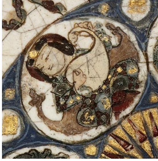
Fotoğraf 17: Minai teknikli astrolojik temalı kase, Metropolitan Museum, (Canby, Beyazıt, Rugiadi, & Peacock, 2016, s. 206, cat. 123).

İlgi çekici örneklerden biri de LNS 261 C envanter numarasıyla Kuveyt Al-Sabah Collection (Dar al-Athar al-Islamiyyah)'da bulunan, pişmiş topraktan yapılmış boğa tasvirli bir kalıptır. Eser, testi, sürahi ya da vazo benzeri seramik bir ürün yapımı için tasarlanmıştır. Kalıbın boyun kısmını bitkisel bir fon önünde kufi yazı kuşağı çevrelemektedir. Gövdesi ise, altlı üstlü iki sıra halinde yan yana dizilmiş ongenlerin içerisine yerleştirilen burç tasvirleri ile süslenmiştir.