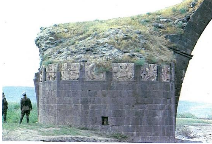
Fotoğraf 19: Cizre İbn Umar Köprüsü'nün gezegen ve burç tasvirli orta ayağı, (İlter, 1978).

gezegen tasvirine dönük olacak şekilde, "C" kıvrımı formunda yerleştirilmiş balık figürü görülmektedir. Balık figürünün yanında bağdaş kurup oturmuş bir insan figürü yer almaktadır. Altına geniş bir pantolon giymiş olan figürün kucağında ud benzeri bir çalgı görülmektedir. Bu çalgıdan figürün Zühre gezegenini temsil ettiği anlaşılmaktadır. Figürün üst gövdesi ve çalgının kalanı, bu kısımdaki taş blok düştüğü için görülememektedir. Ancak figürün sağ eli, çalgının gövdesi üzerinde, sol eli de muhtemelen çalgının sapı üzerinde tasvir edilmiştir. Çalgı, armudi gövdeli bir uda benzemektedir.