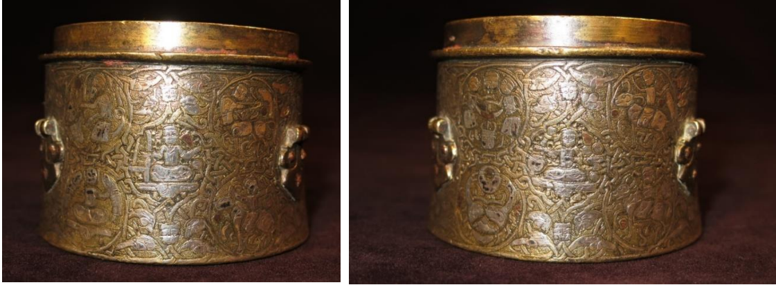
Fotoğraf 3-4: Gümüş ve bakır kakmalı tunç hokka, David Collection, Fotoğraf: Anne-Marie Keblow Bernsted

Diğer müzik tasvirli madalyonda, minder benzeri bir nesne üzerine bağdaş kurup oturmuş bir figür, sağ elinde bir çeng, sol elinde de bir kadeh tutmaktadır. Figürün yüz hatları diğer figürlere çok benzemektedir. Yine kazıma ile şekillendirilmiştir. Figür, üzerine iki kolunda tırazi olan önden açılan bir kıyafet giymektedir. Kıyafetin göğüs hizasından bir yaprak gibi başlayan ve belden aşağıda iki bacağına doğru kıvrımlı birer dal ve yaprak gibi devam eden çizgisel bir süsleme görülmektedir. Figürün kadehi tuttuğu sol eli kapalı olarak tasvir edilmişken; çengi tuttuğu sağ eli açıktır. Sağ elinin parmakları, ayrı olarak gösterilen figür, çalgıyı tutuyor gibi değil; tellerine dokunarak çalgıyı çalıyor gibi gösterilmek istenmiştir. Çeng, seramik eserlerde gördüğümüz gibi açık değil kapalı arp görünümündedir. Kasnağının üst kolu aşağıda ayak olarak devam etmiş ve figürün oturduğu minder benzeri nesneye dayalı durmaktadır. Alt kol ve üst kol kalınlıkları aynıdır. Çengin telleri de tasvir edilmiştir. Ön kısımda alt ve üst koldan daha ince bir ön kol görülmektedir. Üst kol yukarıda öne doğru hafif kavis yapmaktadır.