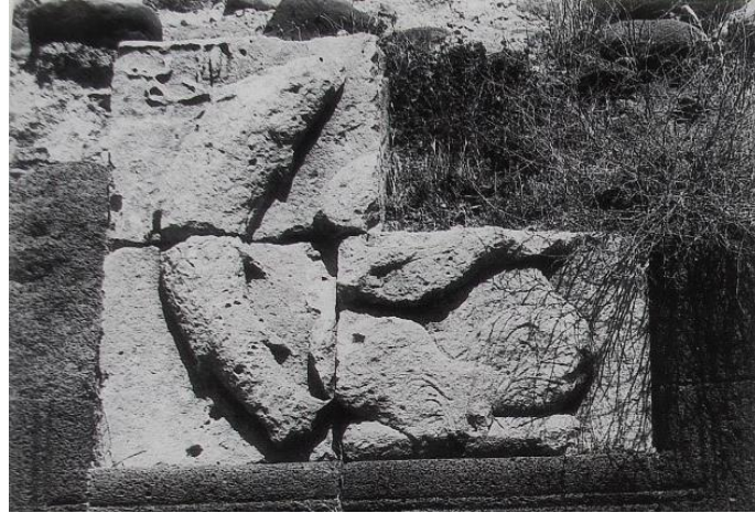
Fotoğraf 20: Cizre İbn Umar Köprüsü'nden Zühre ve Balık burcu tasvirli taş, (Gierlichs, 1996, Tafel: 47).

Bu eserler dışında bir de oyma tekniği ile yapılmış mermer bir blok üzerinde görülen çalgı çalan bir figür tasviri bulunmaktadır. I. 7168 envanter numarasıyla Pergamon Museum'da sergilenen, 13.yy'ın ilk yarısına tarihlendirilen ve Türkiye'den götürülmüş olan bu eser, bir mimari süsleme kompozisyonunun parçası gibi görünmektedir. Ancak bu muhtemel kompozisyonun devamına ilişkin elimizde veri olmamasından dolayı, bu mimari süsleme ögesini konusu bakımından kesin bir kategoriye koymak mümkün değildir. Bu eserde yer alan