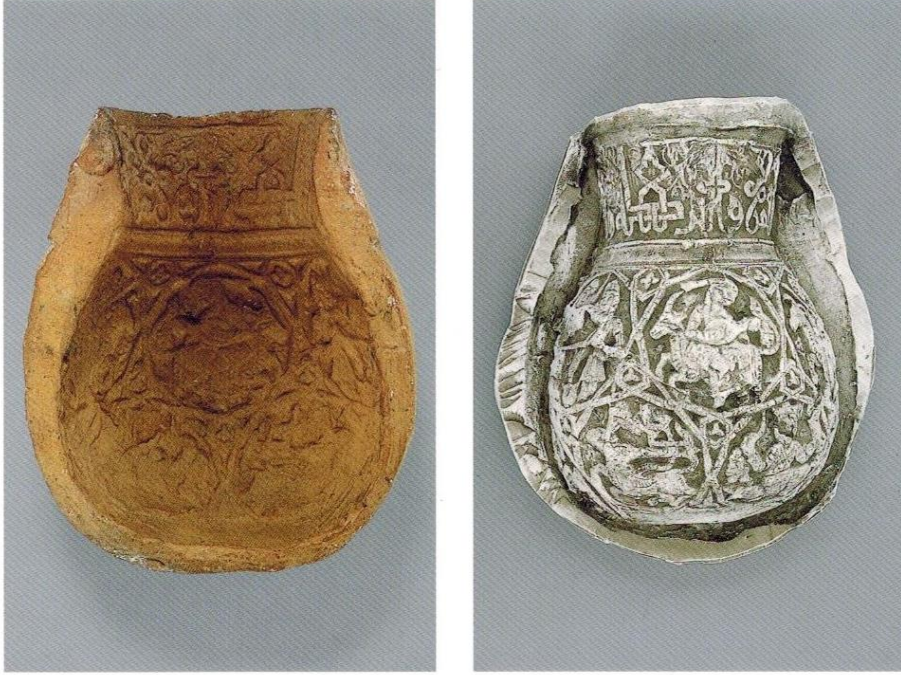
Fotoğraf 18: Pişmiş topraktan sürahi ya da vazo kalıbı, Kuveyt Al-Sabah Collection ( Dar al-Athar al-Islamiyyah ), (Watson, 2004, s. 139)

Zühre gezegeninin müzik ile ilişkilendirildiği sahneler arasındaki ilgi çekici örneklerden birisi de Paris Bibliothèque Nationale de France’da yer alan Persan 174 numaralı Nasr-el-Din Sivasî’nin Tezkire’sine ait bir minyatürdür.