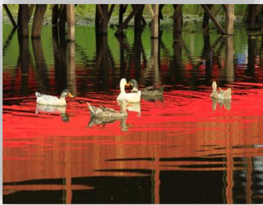
Resim 3. Acarlar Longozu