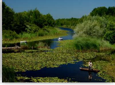
Resim 1. Acarlar Longozu