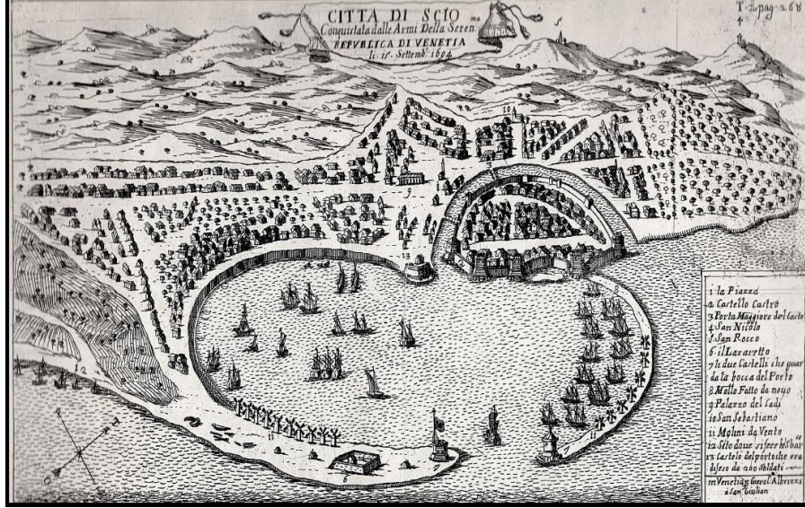
Sakız Limanı. (Dal 2008: 53). Dal, gravürü The Engravings of Chios , s. 111'den alıntılanmıştır.

Muhassılların bu mali görevleri uzun bir süre devam etmişe benzetilmektedir. 1226/1811-1812 yılında hassa silahşorlerinden Sakız muhassılı El-Hac Yakub bölgedeki harir resmini toplamakla görevliydi. Sakız, Sisam, Çeşme yakası ve çevre kazalarında 1226 ve 1227 senelerine mahsup olmak üzere hâsıl olan haririn balyalarından mizaniye resmi adıyla 60'ar parayı toplayacak ve tersane-i âmire hazinesine teslim edecekti (BOA. C.BH.00085-04076-001).